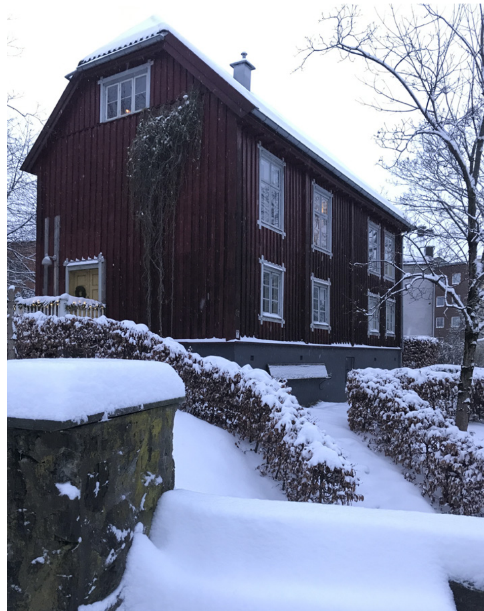
Løfter man blikket og ser oppover General Birchs gate får man øye på Løkkeberg, riktignok flyttet litt og dreid litt for å få plass til Markushjemmet, men det skinner i sin fordums prakt til glede for alle dem som har sin daglige ferd i området.