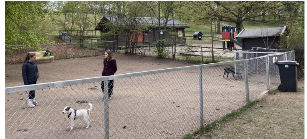
Barneparken på bakhaugen, St. Hanshaugen (Colletts gate 44) mai 2022. Erstattet kryp-inn brukes av bydelens service-sentral. Ny hundegård er tatt i bruk.

for litt større barn og skal offisielt åpnes i løpet av våren. «Kryp-inn» som står der fortsatt og er vernet, det kan ikke fjernes.