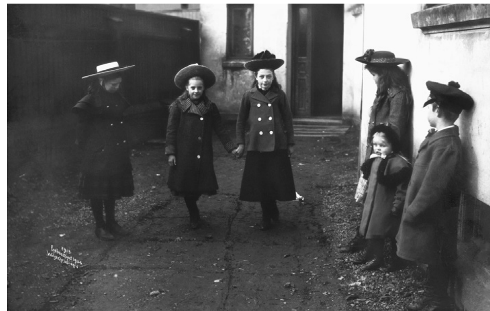
Paradishopping i bakgård. Ca. 1904.

Barna oppholdt seg utendørs uansett vær, sommer som vinter. Når været var dårlig var det ingen steder de kunne søke ly. De minste barna brukte tøybleier, og foreldrene sendte med en våt klut i en pose. Posen fikk de i retur – med innhold. Når de større barna måtte gå på do skjedde det bak buskene.