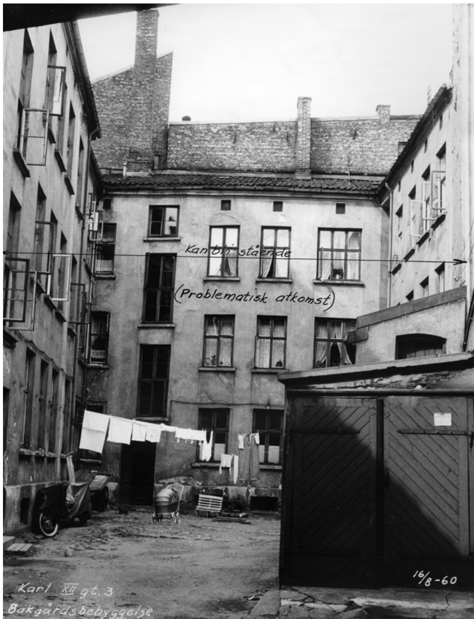
Bakgård på Vaterland, 1960.