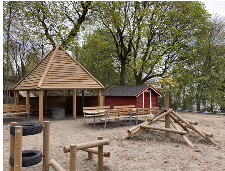
Nye St. Hanshaugen barnepark med rødt vernet kryp-inn. Mai 2022.

mest uheldige sted. Ved foten av parkens aller beste ake- og skibakke. Dessverre.»