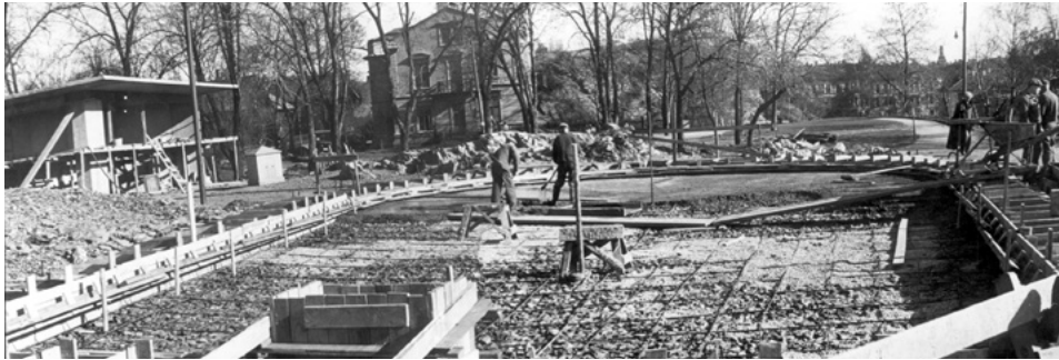
Bygging av dammen på toppen av Stensparken.