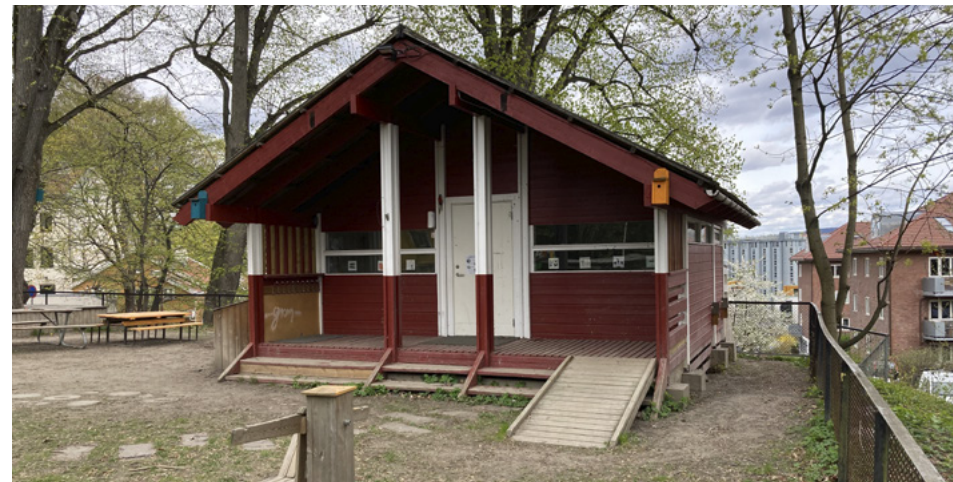
Telthusbakken barnepark mai 2022. Her ligger Oslos best bevarte Ål-hytte. Hytta er fredet. Gjerder og uteområde er bevart.

Laura Gundersens gate 3 var i drift på 1950-tallet. Hadde Kryp-inn. Ble revet i 1958–59. Der står det nå en boligblokk.