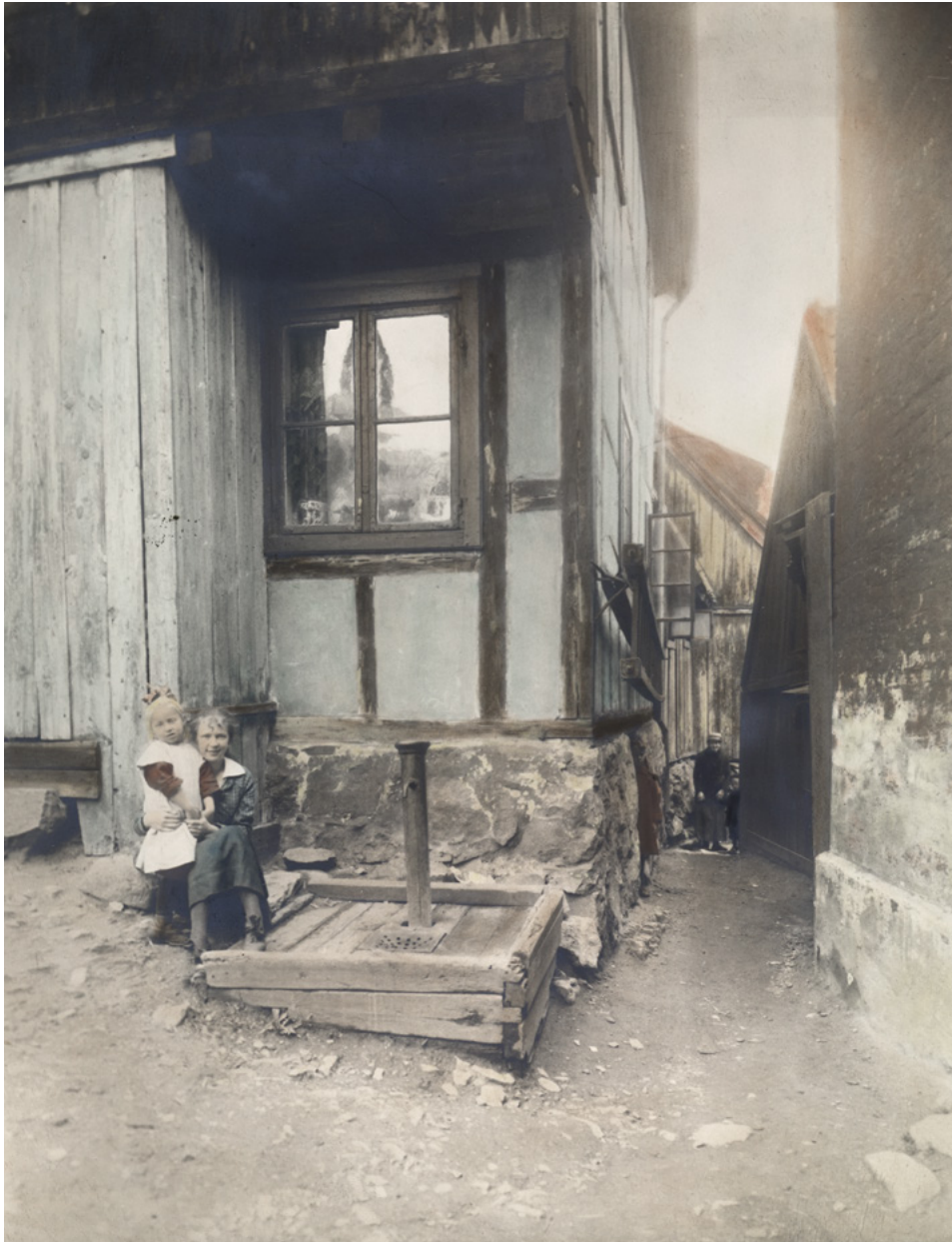
Barn ved vannpost, Hammersborg ca. 1910.