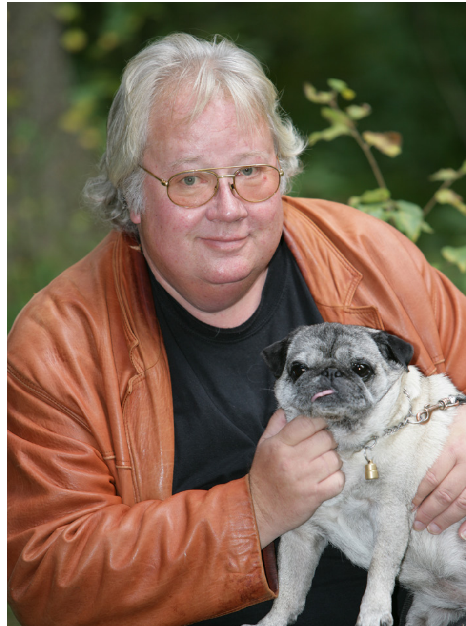
Knut Borge slik vi naboer husker han. Med sin mops, Per Otto eller Peggy eller Siw eller...?