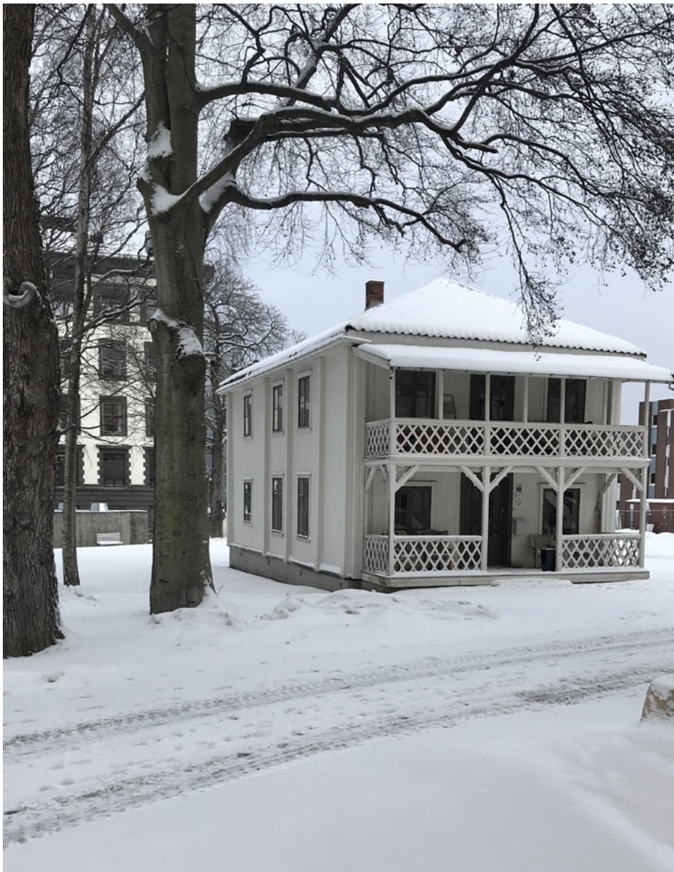
Det gamle løkkehuse på Lovisenberg står inne på sykehusets område. uten sidebygningen som Frølich bygde. Huset var opprinnelig en lade flyttet hit fra Ladegårdsøen, nå Bygdøy. Det har altså fungert som låve for korn eller høy som skulle forsyne Akershus. Verandaen ble satt opp i Frølichs tid.

Christiania var kjent for de mange vakre løkkene som omkranset byen. Blant disse var Løkkeberg, Valle og Lovisenberg, for å ta noen eksempler. Her kunne de kondisjonerte nyte sommeren samtidig som de drev matauk.