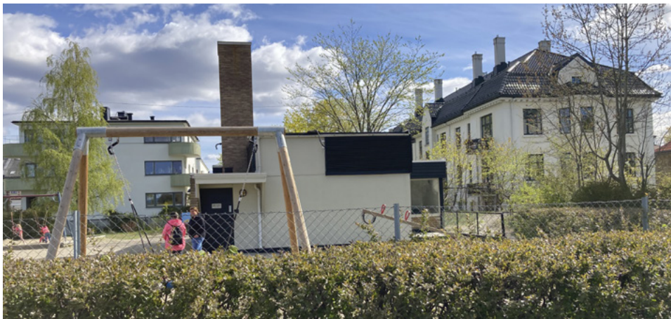
Dette bildet er tatt fra Idioten park. I forgrunnen Iddern barneparks hus med luftetårn fra garasjen under. I bakgrunnen Anton Schjøths gate 13 der Knut Borge bodde i øverste etasje. Mai 2022.