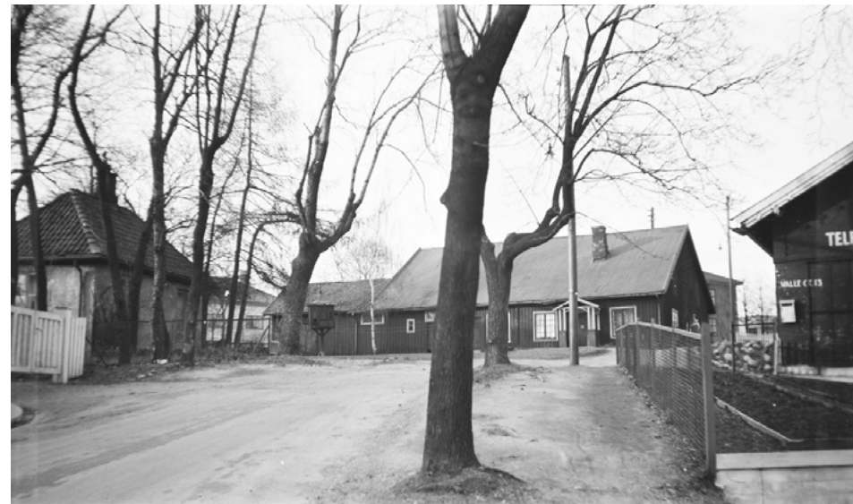
Valleløggen, tun, portstue, drengestue.

Utviklingen av et dansk nettverk i Norge skjedde på bekostning av det gamle norske elitenettverket. Byrådet i Christiania ble ikke lenger rekruttert fra byens øverste sosiale lag. Medlemmene av byrådet, borgermestrene og rådmennene, ble nå kongelige embetsmenn, under betegnelsen magistrat. Borgerne så sine interesser truet, og løsningen på konflikten ble å opprette et borgerutvalg, kalt de eligerte (valgte) menn. Disse var ikke demokratisk valgt, men ble i all overveien de grad rekruttert fra det ledende handelsborgerskap, og i løpet av 1700-tallet ble borgerutvalget i realiteten selvsupplerende, i det de eligerte selv foreslo hvem som skulle fylle ledige plasser i utvalget. I utgangspunktet skulle de eligerte gå gjen-