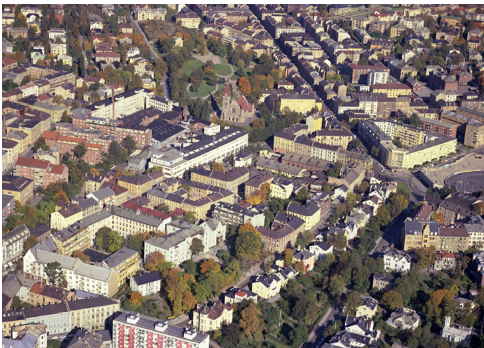
Stensparken sett fra luften.

vann og toalett, og kanskje en telefon. Flere parktanter søkte parkvesenet om å få satt opp gjerder av hensyn til barnas sikkerhet. Etter krigen ble det satt opp gjerder. På 50-tallet vokste det fram små «kryp-inn» - tre vegger og et gitter, uten oppvarming eller noen særlige fasiliteter. De ble oppgradert etter hvert. Fra 70-tallet engasjerte Oslo kommune arkitekt Alf Bastiansen til å tegne et parktantehus. Det ble oppført som typehus for mange barneparken rundt i byen, og det inneholdt et stort oppholdsrom, toalett og lagerrom.