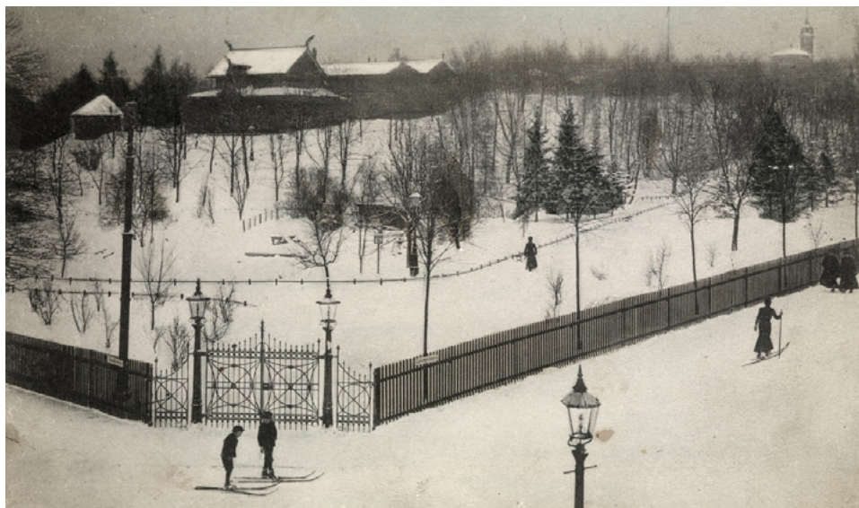
Barn står på ski ved St.Hanshaugen. Hasselbakken i bakgrunnen. Ca. 1905

Uten at jeg husker det med sikkerhet antar jeg at parken på barnehagens sydside ble nedlagt da det ble bygget barnepark på det vi kaller «Bakhaugen», mot Collettsgate. Og en som har hatt både småbarnstid, oppvekst og yrkesliv i tilknytning til St. Hanshaugen vil påstå at den barneparken ble lagt på det aller, aller