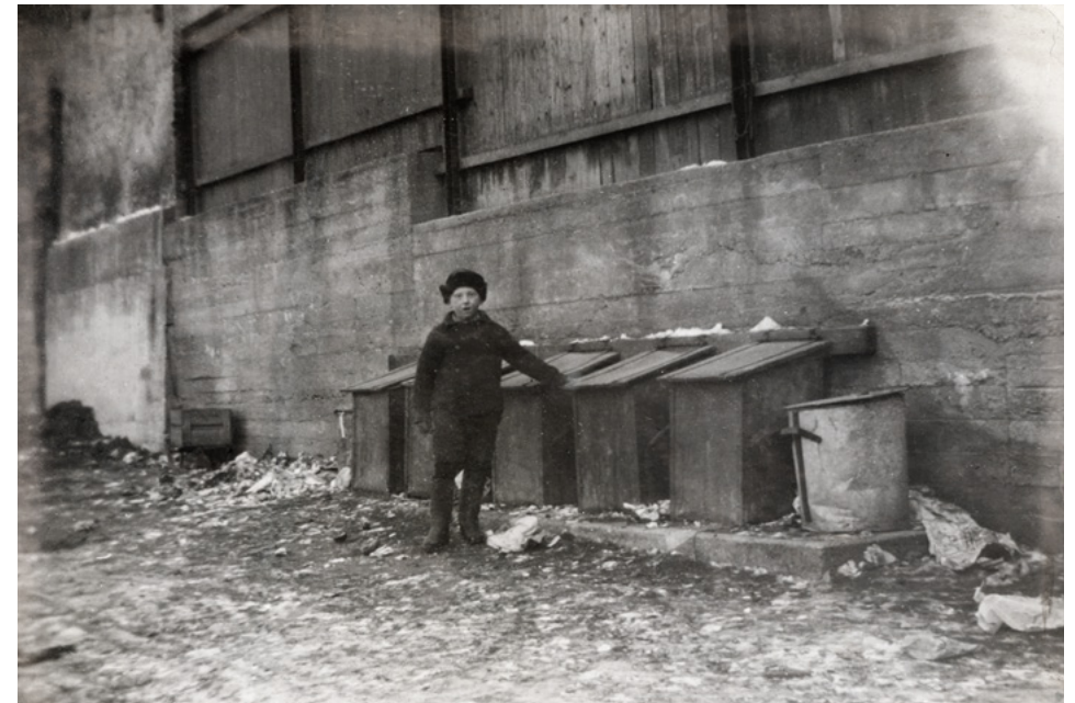
Barn ved søppelkassene i bakgård til en arbeiderbolig, 1930.

«Herved bekreftes at de har tillatelse til å virke som parktante på St. Hanshaugen (den nye lekeplassen mot Gjetemyrsveien). Ved eventuelt opphør bes dette meddelt parkvesenets kontor omgående.» (1934)