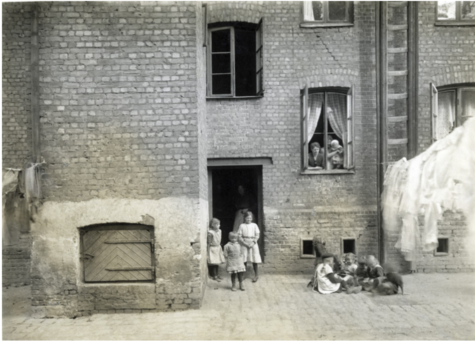
Bakgård med barn i lek. Kirkegårdsgata 22. Klesvask.

viktig å utvikle åpne, store gårdsplaser og parker. Kvinnesaks pionéren Fernanda Nissen (1862–1920) var formann i Kristianias parkutvalg. Hun så en mulighet til å bruke parkene i Oslo på samme måte som de alt var i bruk i andre land. Dette gjorde det mulig å kunne tilby arbeid til kvinner, og hjemmeværende kvinner kunne få noen timer fri midt på dagen. Husmorforeningen tok opp saken. I 1921 ble parklek omtalt som bra for barna og godt for mor. Parker ble etablert