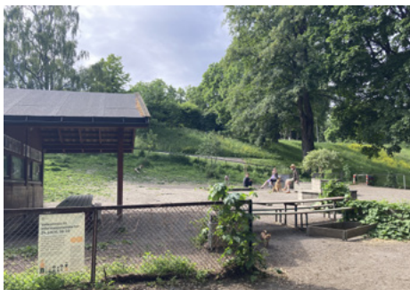
Stensparken barnepark juni 2021. Plakaten inviterer til åpent møte om videre bruk av barneparken.