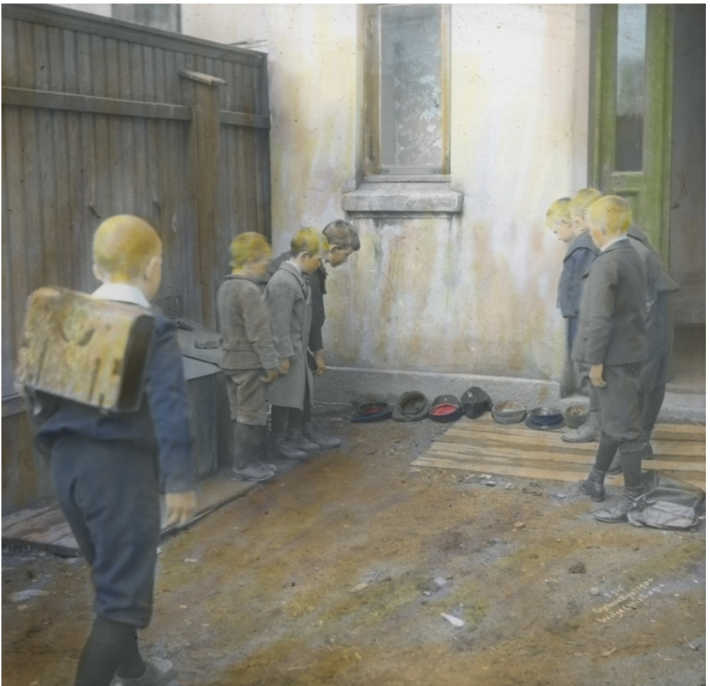
Klinking i en bakgård i 1904.