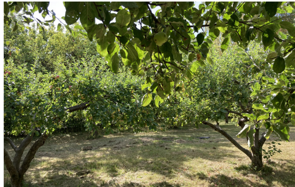
Her kan Viestads hus komme.

Jeg tror vi går en brukbar framtid i møte. Det har vært flere utbyggings-trusler her som vi har klart å unngå. Vi unngikk en svær utbygging i 2004. Før det var det snakk om en utvidelse av gravlunden. Etter det var det snakk om en diger barnehage her. Men området er som det er. Det er det originale området fra 1909. Det er viktig at det er stort. Det gjør noe med hele stedet, gjør noe med atmosfæren og mentaliteten her.