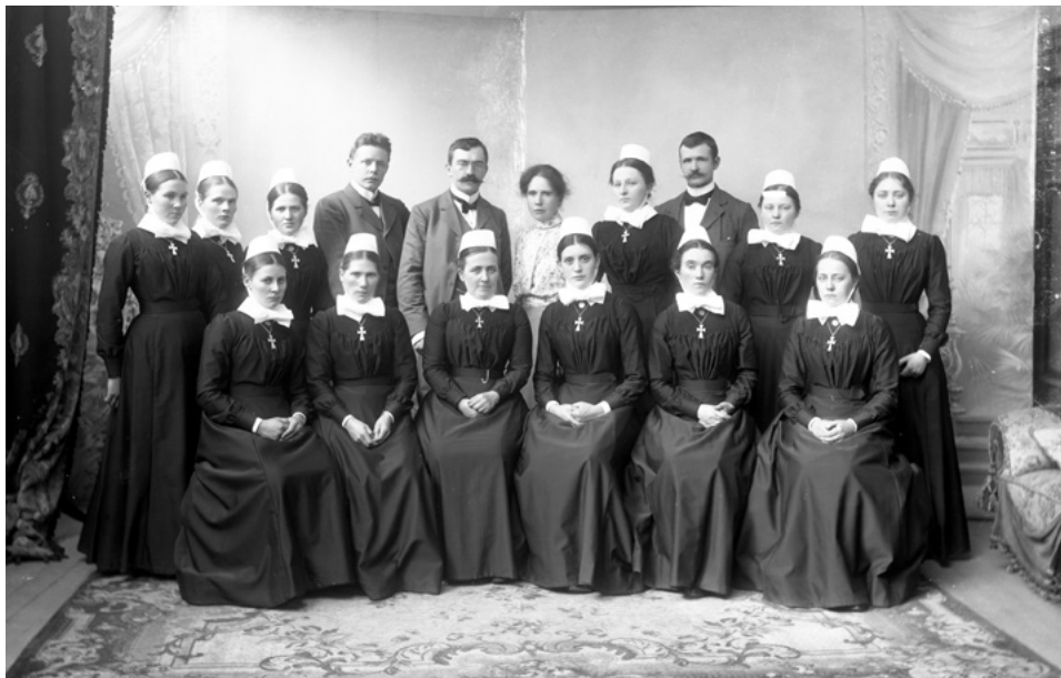
Bildet viser antageligvis personalet ved Kristiania kommunale sykehus (Kroghstøtten?) ca. 1899. Diakonissene ved sykehuset med legene i midten bak.

ale lag, medførte vigslingen til diakonisse at de klatret i samfunnet, og for dem alle var dette et respektabelt yrke.