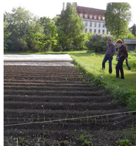
Dyrka mark – inspeksjon.

Så her har vi et stykke landbruk midt i Oslo, med traktorer, landbruksredskaper og alt vi trenger for å drive landbruk. Områdets størrelse er ganske nær 40 da. Skoleaktiviteten utgjør omtrent en tredel av området, parsell-hagene en tredel, og resten er sentrale fellesområder som gressplener m.m.