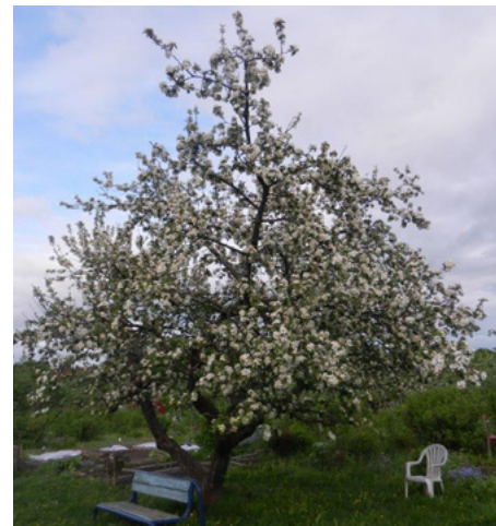
Frukttre i blomst

Området her er åpent når jeg er på jobb. Det skal være åpent alle hverdager mellom ni og fire. Da kan hvem som helst komme inn her, det er åpent for alle. Hvis dere blir lenger enn det, er det fortsatt åpent, men ingen vet hvor lenge. Det kan være låst når dere skal ut. Alle som har parseller får nøkkel, så de kan komme og gå som de vil.