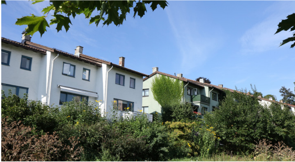
Akersborg terrasse.