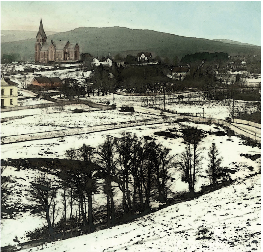
Bislettbekken ved Adamstuen.