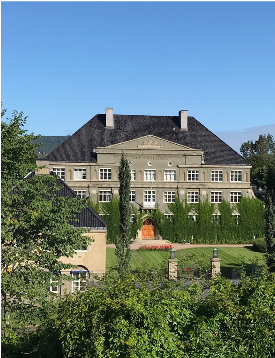
Veterinærhøgskolen står som et monument over et samfunn som bensinmotoren forandret totalt, der veterinærene spilte en avgjørende rolle, ikke bare når det gjaldt landbruksproduksjon og transport, men også for forsvaret av landet.

Fra midten av 1800-tallet ble området rundt Adamstuen bebygget med institusjoner som sykehus og skoler, men også med bygårder. Mange av institusjonene var en del av nasjonsbyggingen, slik som for eksempel Veterinærhøgskolen, men mange var også uttrykk for et behov for ensretting og disiplin.