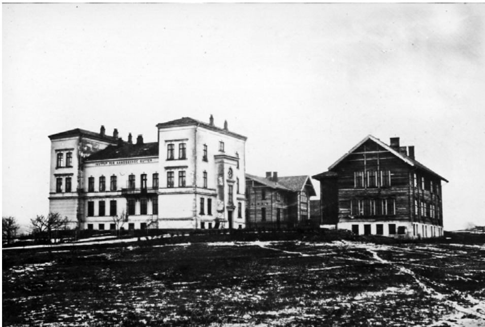
Lindern Institutt for åndssvake gutter. (1890)

Disse ble omtalt som de «vanartede eller moralsk fordærvede», og ansås å ha en svak sosial bakgrunn.