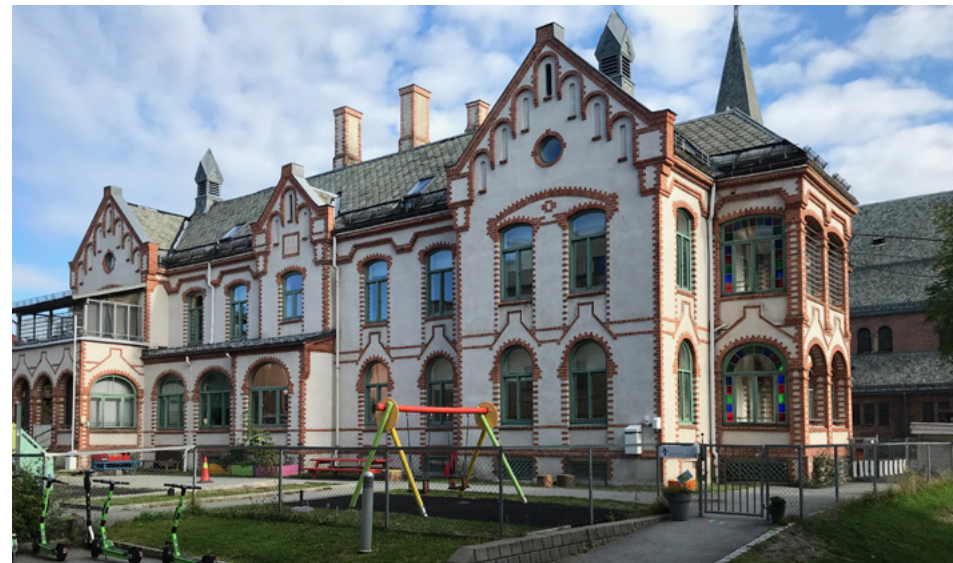
Hjemmet for «udtjente Diakonisser» bygd i 1900, tjener i dag som barnehage.

ge for mat, stell og åndelig omsorg. Mange av de velstående fruene overlot imidlertid arbeidet til tjenestjenta, og etter hvert ble det unge kvinner fra landsbygda som ble lært opp til sykepleie. De lærte å lese, skrive og regne, de fikk kunnskaper om legemidler, de lærte å årelate, og forpliktet seg til ikke å motarbeide legens ordre. Foreningen bygget på det prinsipp at sykepleien i seg selv hadde en moralsk verdi, og brøt med den oppfatningen at pleien bare var et virkemiddel i en større religiøs sammenheng, selv om den var preget av en kristelig omsorgsidé. Systemet bygget på frivillig tilhørighet