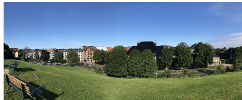
Panoramabilde fra Idioten med Veterinærinstituttets karakteristiske valmtak i midten.