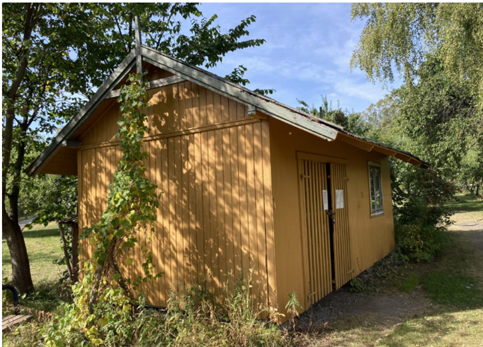
Bolteløkka skoles hytte.

Hadde de gode tidene på 80-tallet fortsatt i fem år til hadde dette stedet vært borte. Det er temmelig sikkert. Da jeg ble ansatt i 1993 var det bare å begynne å grave opp. Det har vært en langvarig prosess å få det opp til et visst nivå igjen. Men riktig utnyttet potensiale er det fortsatt ikke økonomi til.