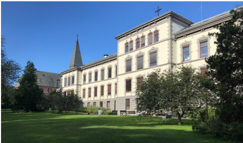
Diakonissenes sykehus ble flyttet fra Ullevålsveien til nye, moderne lokaler på Lovisenberg i 1895.

hjelpe dem som lå til sengs og gå stuepiken til hånde i hennes arbeid» 2 .