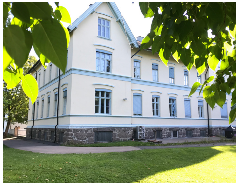
Geita troner i landskapet nå som før. Bygd av Magdalenastiftelsen i 1880 for å huse «falne kvinner», senere brukt som tvangsskole og observasjonsskole. Eiendommen har vært en del av Veterinærhøgskolen siden 1990.

terinærinstituttet oppført etter tegninger av arkitekt Bredo Greve. Det ble byggemeldt i 1912 og tatt i bruk i 1914. Greve fikk også oppgaven med å tegne Veterinærhøgskolen. I tillegg til eiendommen der Hansens institutt hadde ligget, fikk man også kjøpt en tilstøtende tomt, og til sammen hadde man nå 41 dekar til rådighet for den nye høyskolen. Arbeidet på hovedbygningen startet imidlertid først i 1925, og anlegget ble ferdigstilt i 1936. Resultatet ble en monumental bygning med et kraftig og ukonvensjonelt formspråk i fasaden ut mot byen, som den dag i dag sier noe om den viktige rollen veterinærene hadde i samfunnet.