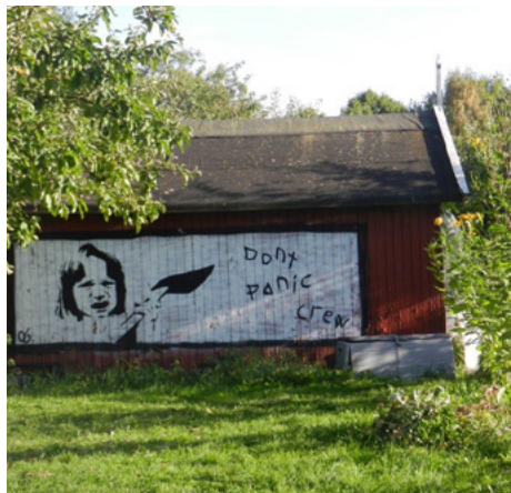
Dette gatekunstverket dukket opp en morgen, sannsynligvis i 2006. Det er såpass bra at vi har ikke malt over det.

Hageselskapet en «bytte plante-dag» her. De har med seg sine egne planter, noen er herfra, og noen planter vil bli solgt. I fem år har vi hatt en «bønder i byen» festival. Den har vært med musikk, litteratur, mat m.m. Den tradisjonelle «Geitmyradagen» er første eller andre søndagen i september. Det er en mer åpen familiedag. Alle er velkommen hit på disse åpne dagene.