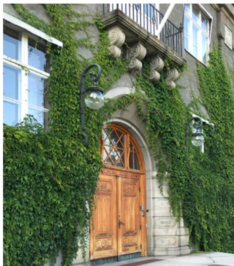
Vakker detalj fra Veterinærinstituttet.

På tomten på hjørnet av Ullevålsvæien og General Birchs gate ble Ve-