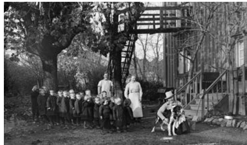
Veslehjemmet på Løkkeberg, ca. 1912–1915