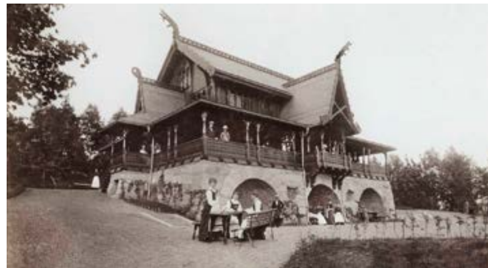
Restaurant Hasselbakken på St. Hanshaugen som lå omtrent der trappene fra dagens uteservering til lekeplassen går.

Her på St. Hanshaugen lå to restauranter oppført 1890–1896, ved dragestilens fremste arkitekt, kommunearkitekt Holm Munthe. Den ene brant 1936 og den andre ble da revet. Det er nå planer om å gjenreise en av dem, kanskje begge.