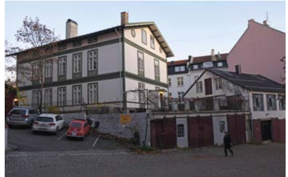
Hallingsgate 5, Oleløkken.

Der det huset ligger har spekulanter søkt om å få bygge et hus som var så stort som husene like