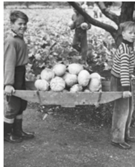
Innhøsting på Geitmyra. Foto: Paul Andreas Røstad 1955 Eie: Oslo Museum

Kilde: Ut i det grønne , Oslo kommunale skolehager 75 år, 1909–1984. (Oslo kommunale skolehager 1985.)