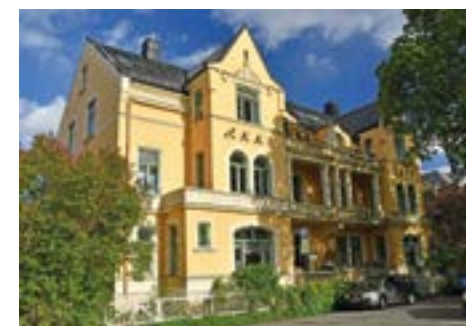
Nr. 31 B, frittliggende leiegård 1897.

heter feilaktig det, for det var et overvintringssted for svaner, ikke bolig for bjørner. Men det har vært bjørn og andre dyr i menasjeri på haugen. Bjørnene ble slaktet i 1917. Trehuset leies nå ut til møter og selskapelighet.