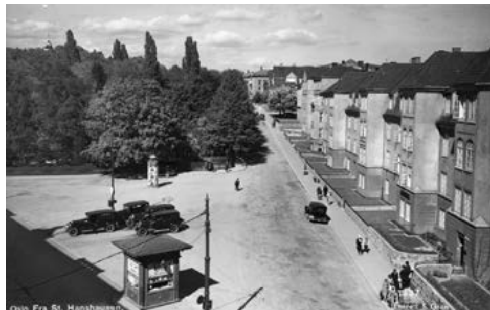
St. Hansplassen, ca. 1935. Fra 1962 med navnet Knud Knudsens plass. Geitemyrsveien 1-7.

Leiegårder ca. 1925. Arkitekt Harald Aars.