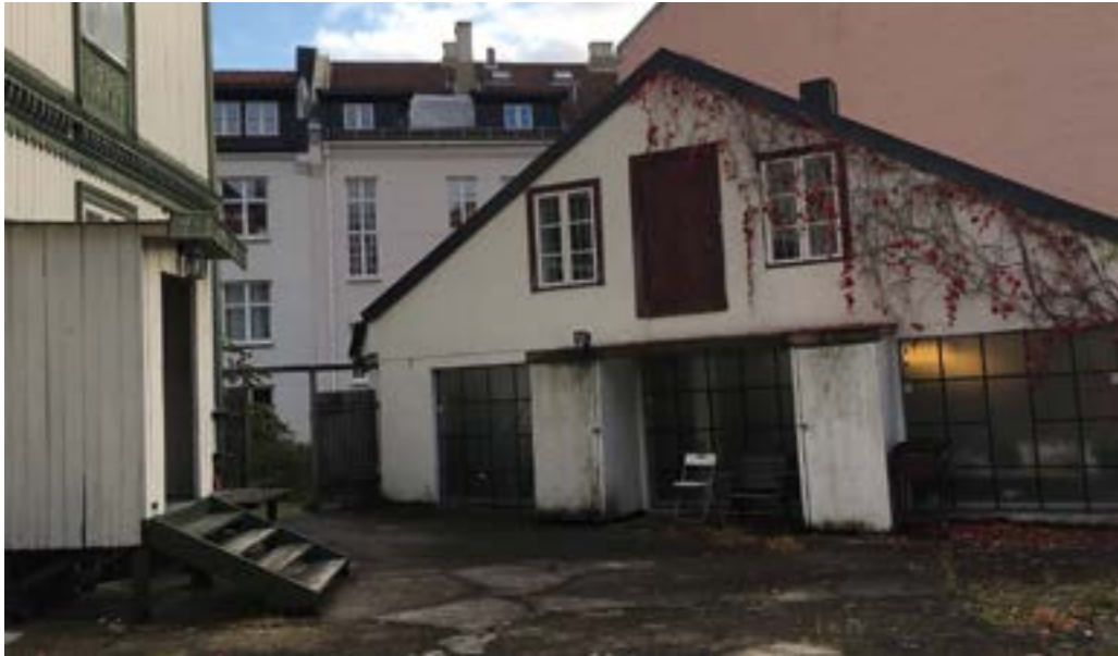
Hallingsgate 5 mot Hallingsgate. Foto Liv D. 2019

mer dit kan dere se en lang hvit bygning med et stort 1700-talls tak, det er gamle Stensberg gård. Det er ganske imponerende at de tok seg bryet med det. Men de hadde jo god råd, så de gjorde vel det de ville.