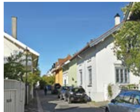
Frølichbyen, Anton Schjøths gate 1-5 til høyre.