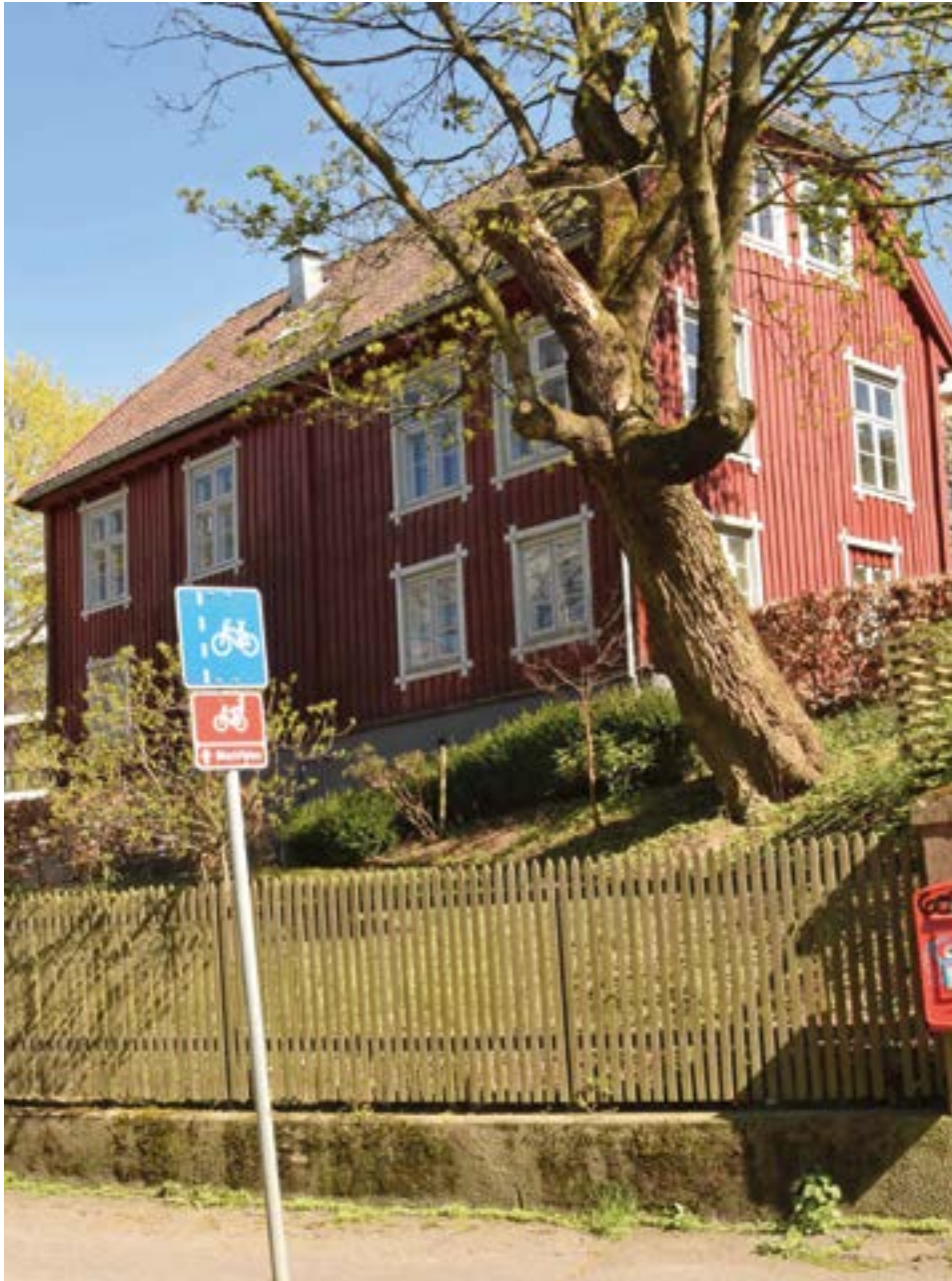
Løkkeberg, byens eldste stående løkkebygning.