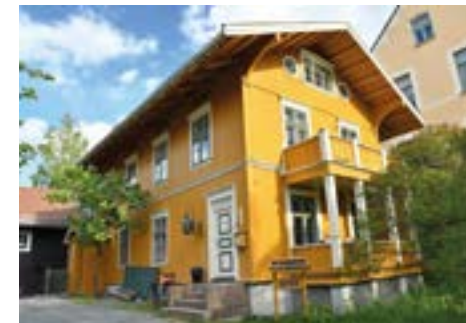
Voldeløkken eller Nicolailøkken og uthuset som ligger ved skrenten ned mot Ewald Ryghs gate 16.

Huset har usedvanlig langt takut-spring. Uthusene er gamle. Løkken ligger ved en skrent ned mot Ilastrøket, en forkastning som var opphav til en gang med vulkans diabas. Også her var det trolig et steinbrudd for gatestein.