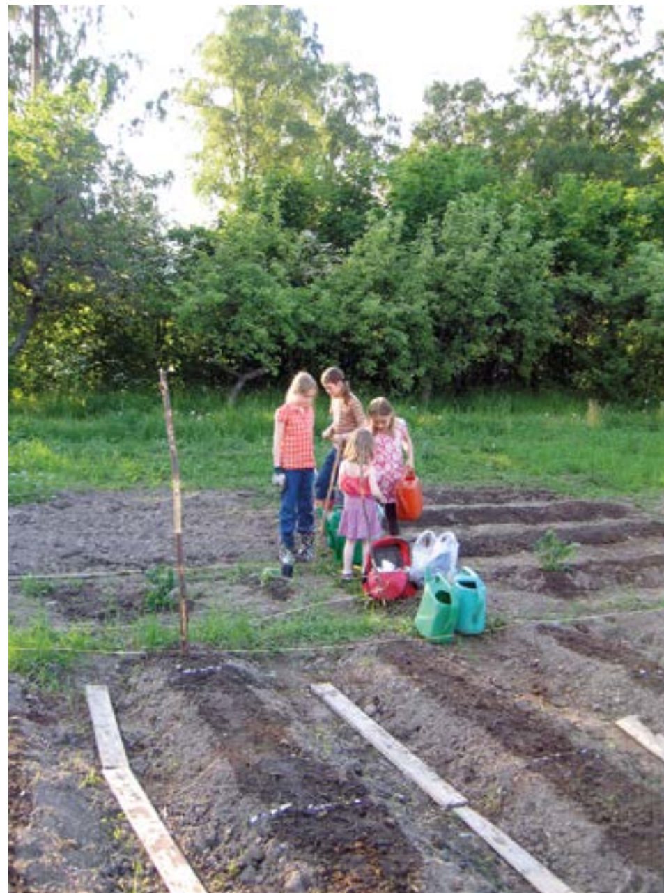
Vårønn i skolehagen 2007.

Etter krigen var det bolignød, Bolig-etaten var ute etter tomter, og skolehagene var i faresonen. Parketaten