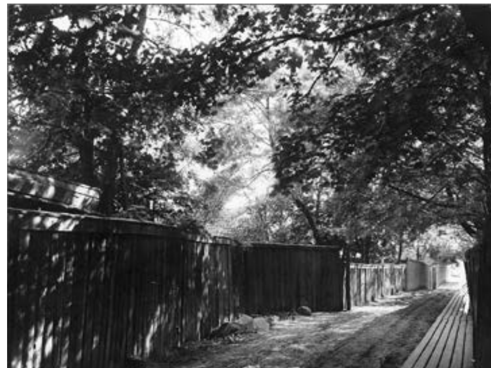
Knivstikkergangen, plankegjerd, 1912 – 1914.

Nederst går gaten som heter Stensberggata nå. Da het den Knivstikkergangen. Grunnen til det må jo ha vært en eller annen episode som ga den navnet.