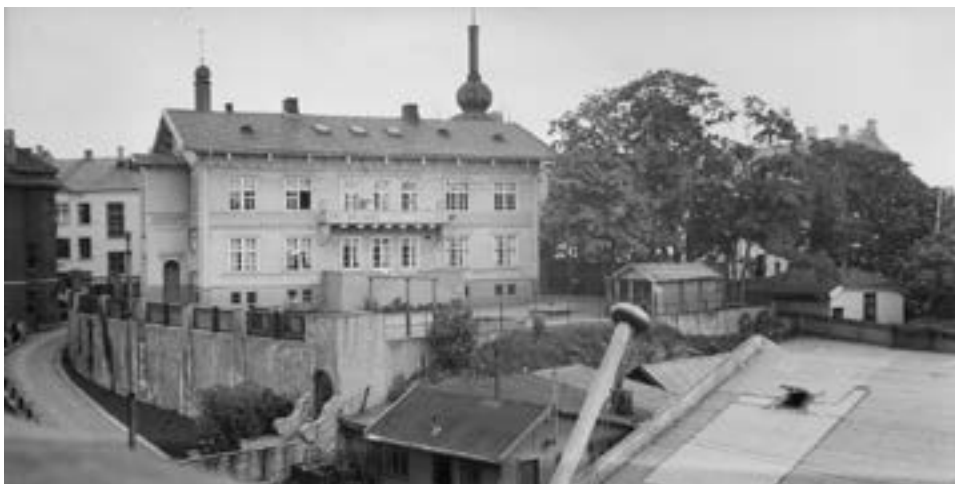
Et godt bevart sveitserhus, løkken Høien fra 1853. I bakgrunnen kuppelen på Markus kirke.