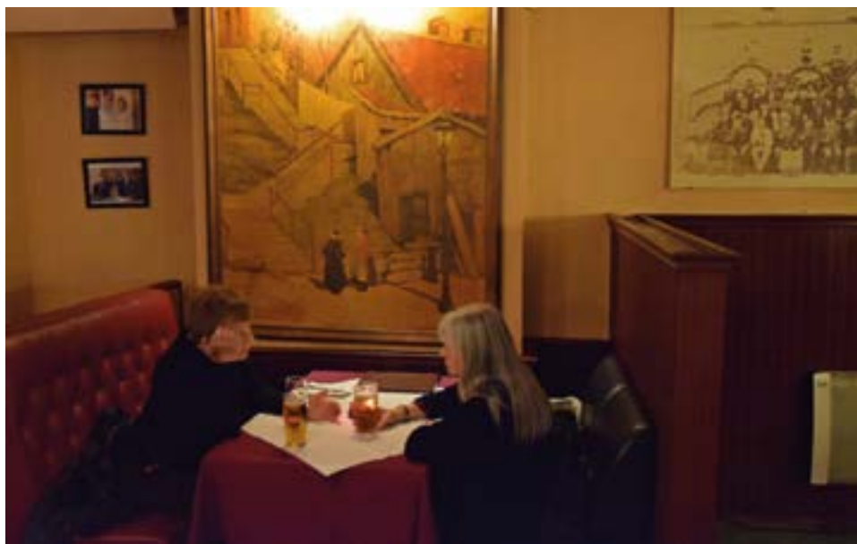
Noe må være som det var. Restaurant Schröder, 2016, med maleri av trappen fra Rostedsgate til Damstredet.