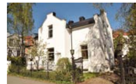
Geitmyrsveien 61, oppført av Christiania Selvbyggerforening, Foto: Helge Høifødt

1942), som er best kjent for å ha regulert Ullevål hageby og tegnet krematoriene Vestre gravlund. I 1906 foreslo han å bygge Rådhuset i Pipervika, litt østenfor den tomten som ble valgt i 1918.