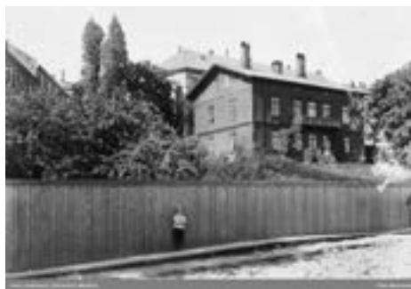
Hallings gate 5 (tidligere Ullevålsveien) Foto Holmsen, Johannes Markus – 1912. Eie: Oslo Museum

Nedover her hadde Broch sin gamle kålåker. Han fikk en del premier for kålen sin i de konkurransene de hadde den gangen.