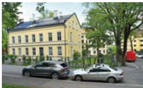
Det Ankerske Waisenhus, 1882, Brandts gate til høyre.

Da Vår Frelzers Gravlund ble utvidet i 1881, flyttet Waisenhuset til Geitmyrsveien 19, i en bygning oppført i 1882 ved arkitekt A.J. Olsen.