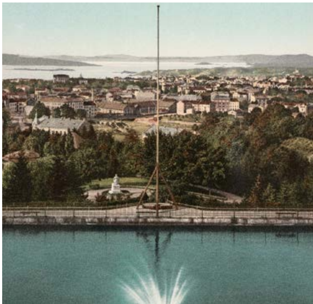
Panorama fra St. Hanshaugen, 1900 – Foto: Væring, Ole Martin Peder / Oslo Museum