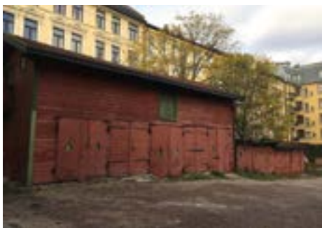
Uthus og garasjer – Hallingsgate 5.

Det har jeg og mine fettere og kusiner fått god bruk for. Vi kunne jo bare flytte inn hit når vi skulle studere – til en billig penge.