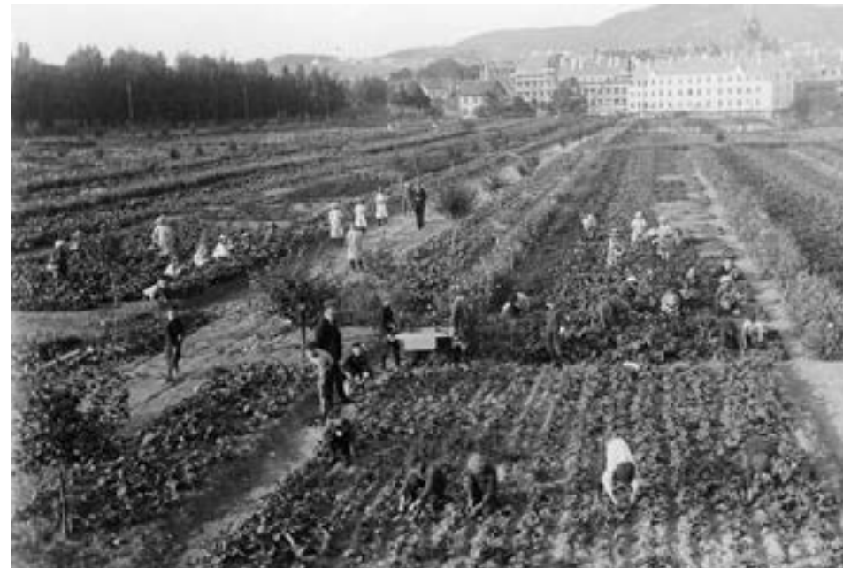
Geitmyra skolehage. 1912 (ca)

I 1909 vedtok Kristiania Formannskap at en del av eiendommen kunne benyttes til skolehager for seks folkeskoler: Møllergata, Foss, Bolteløkka, Lilleborg, Sagene og Grünerløkka.