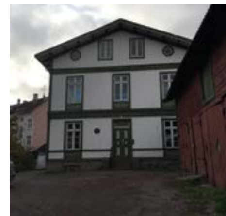
Hallingsgate sett fra siden som vender mot Ullevålsveien, Foto Liv D. 2019

høyden litt ned visuelt. Det finnes et par andre hus bak slottet som er bygd i samme stil. Det er sveit- serstil. Huset står på gul liste. De kan ikke forandre noe utvendig, men innvendig har de forandret mye både i første og andre etasje.