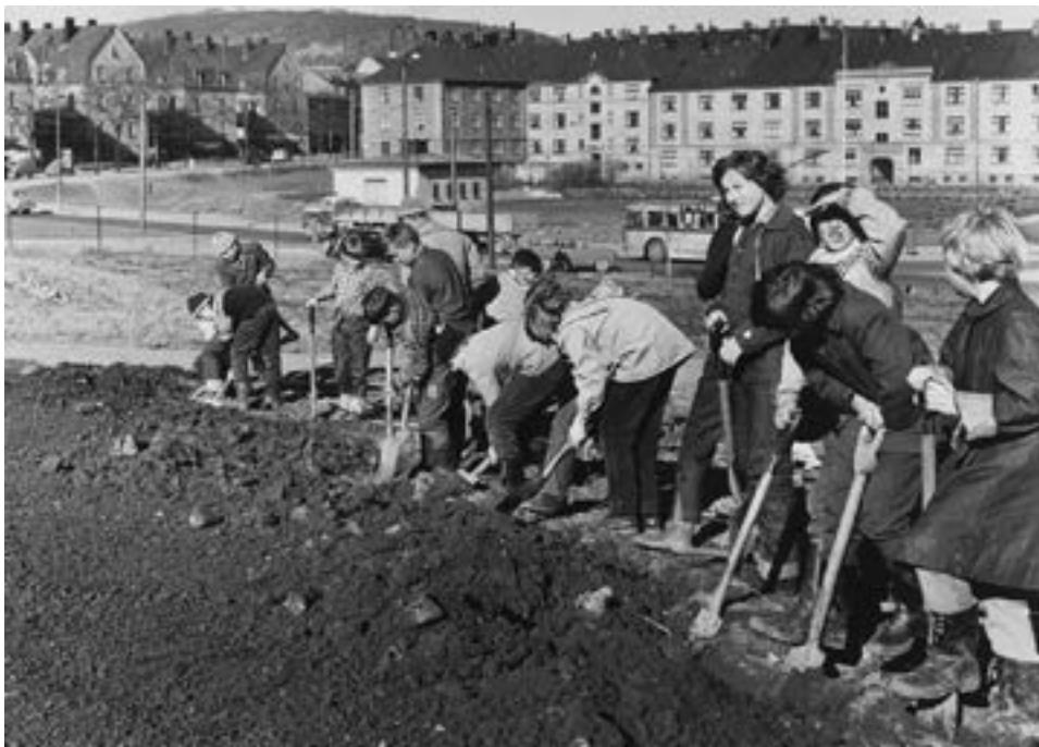
Geitmyra skolehage.

ten, har det vært det pedagogiske og det oppdragende som har vært det viktige med skolehagen. Så har matauk kommet som en bivirkning.