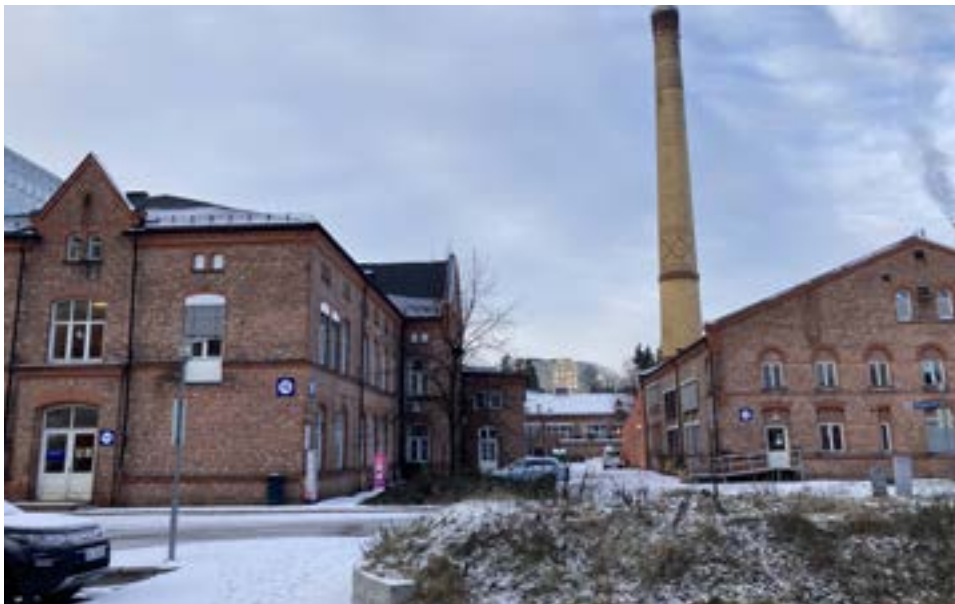
Kjøkkenbygning og fyrhus.