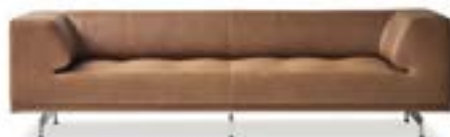
Delphi sofa / Hannes Wettstein, 2007