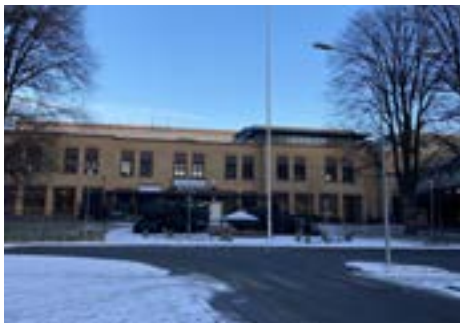
Sentralbygningen – hovedinngang til sykehuset.