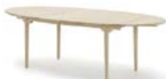
CH339 spisebord / Hans J. Wegner, 1962