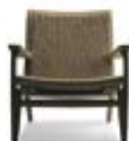
CH25 / Hans J. Wegner, 1950