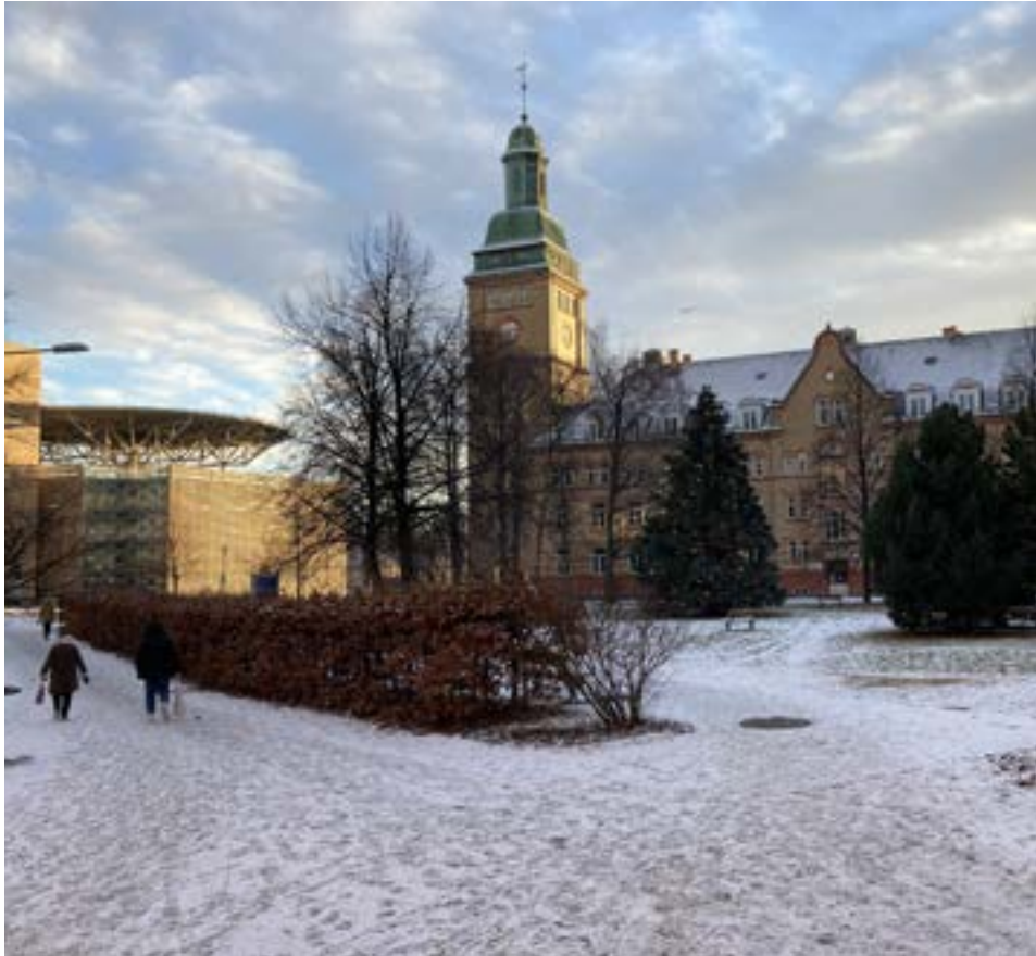
Administrasjonsbygget, tårnet, garasjebygg og helikopterlandingsplass.