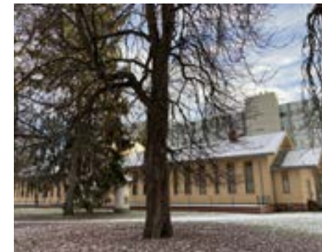
Bygg 24. Tidligere del av epidemisykehuset, nå museum. Fredet.

Bygg 24, i dag museum, sammen med bygg 30 og en bygning nærmere Tåsenporten, dannet sammen med