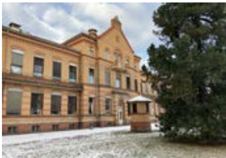
Bygg 19. Tidligere difteribygget fra 1904. Fredet.