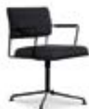
Time chair / Henrik Tengler, 2012