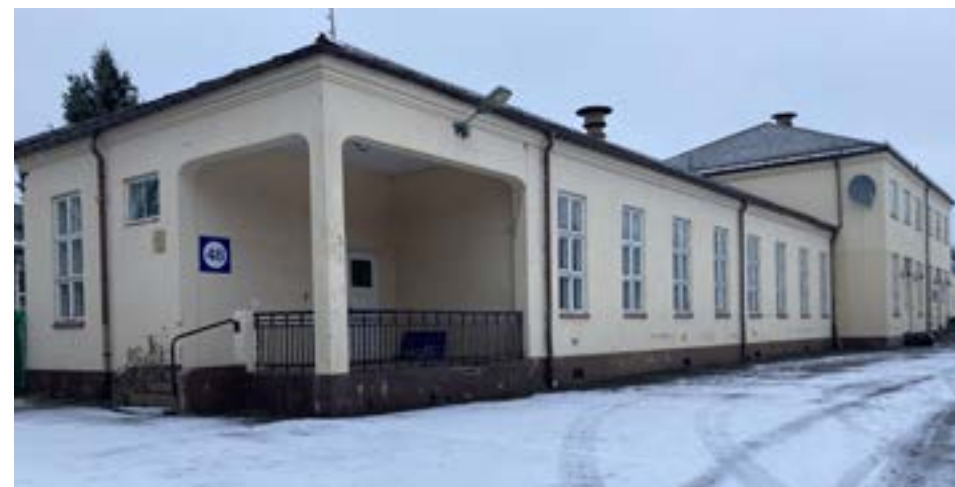
Bygg 48. Nyere paviljongbygning fra 1915, Fredet.

Bygg 37 er et kompleks sykehuset har slitt med å utnytte i alle år. Det ble ferdig i 1952 og skulle dels være sykehjem og geriatrisk avdeling, dels somatiske avdelinger som hud og annet. Bygningen består av to fløyer