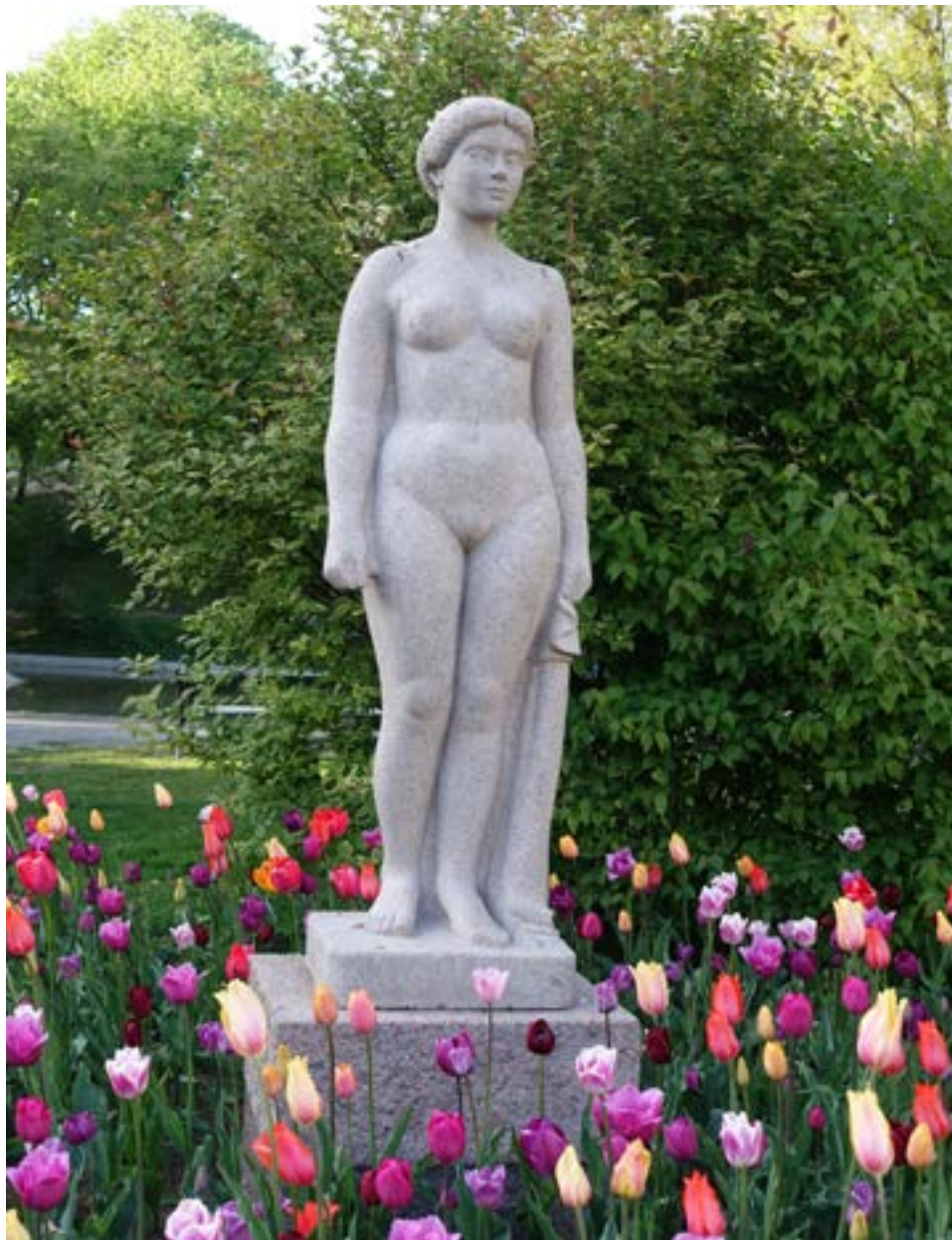
«Kvinne» utført i granitt av Ørnulf Bast

Norske billedhoggere er rikelig representert i bydelen vår. Ikke minst har St. Hanshaugen blitt utsmykket med et variert utvalg av statuer til glede for dem som har sin ferd gjennom parken og dens nærområder.