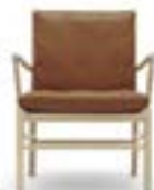
Colonial stol / Ole Wanscher, 1949