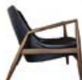
The Seal / Ib Kofod-Larsen, 1956