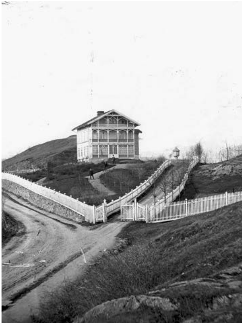
Reiersens løkke. Hovedbygning. Revet i 1935.

Murhuset som ligger øverst i Stensparken, rett nedenfor Blåsen, har hatt mange navn og har en historie tilbake til-1800 tallet. Tidligere sto det også en trebygning der, som var hovedbygningen på eiendommen.