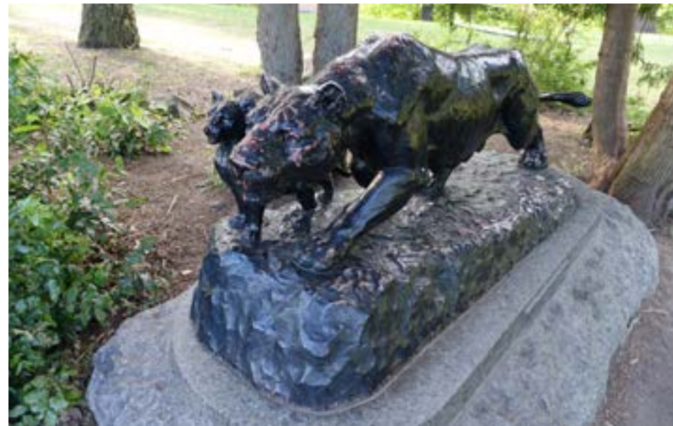
«Løvinne med unger» av Hermann Stuetzer

Litt lenger nord finner vi «Løvinne med unger» av Hermann Stuetzer, oppført i 1891.