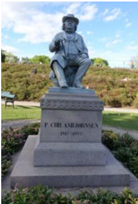
«Peter Chr. Asbjørnsen» av Brynjulf Larsen Bergslien

i Studenterlunden og Johannes Brun på Bankplassen.