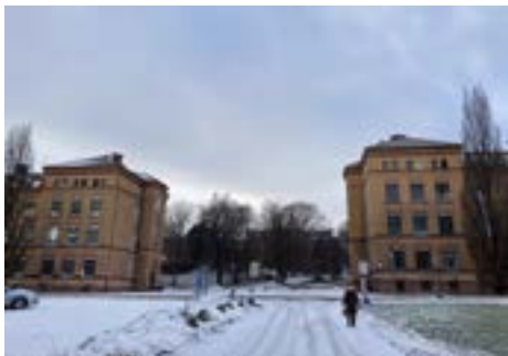
1900-tallssykehuset. Bygg 20 og 31 fra 1904

Balkongene vi ser var for besøk, pårørende kunne snakke med pasientene gjennom vinduet. Stor etasjehøyde og høye vinduer beholdes sammen med god oppdriftsventilasjon. Bygningene i perioden var solide bygninger med bærende fasader og korridorvegger i 2 ½ steins vegg eller 60 cm tykk, kompakt mur med fasadestein i tysk, glatt tegl i spesialformat, gul, med bånd og ornamen-