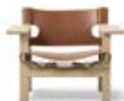
Spanske stol / Borge Møgenssen, 1958