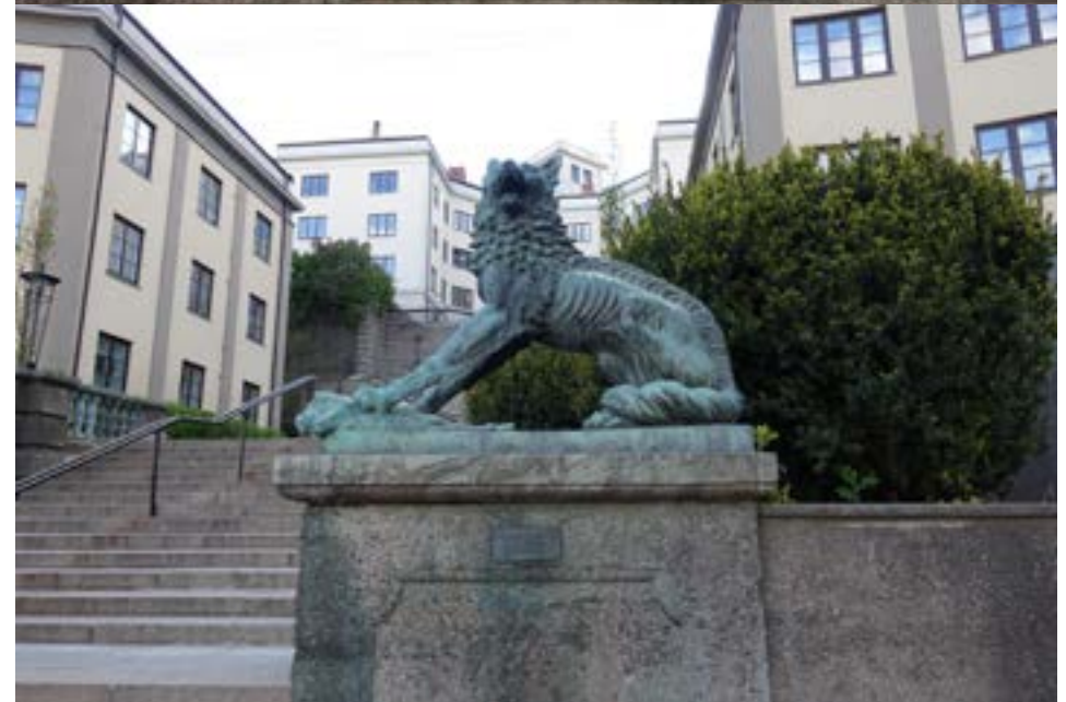
«Hunnulv og hannulv» av Dyre Vaa