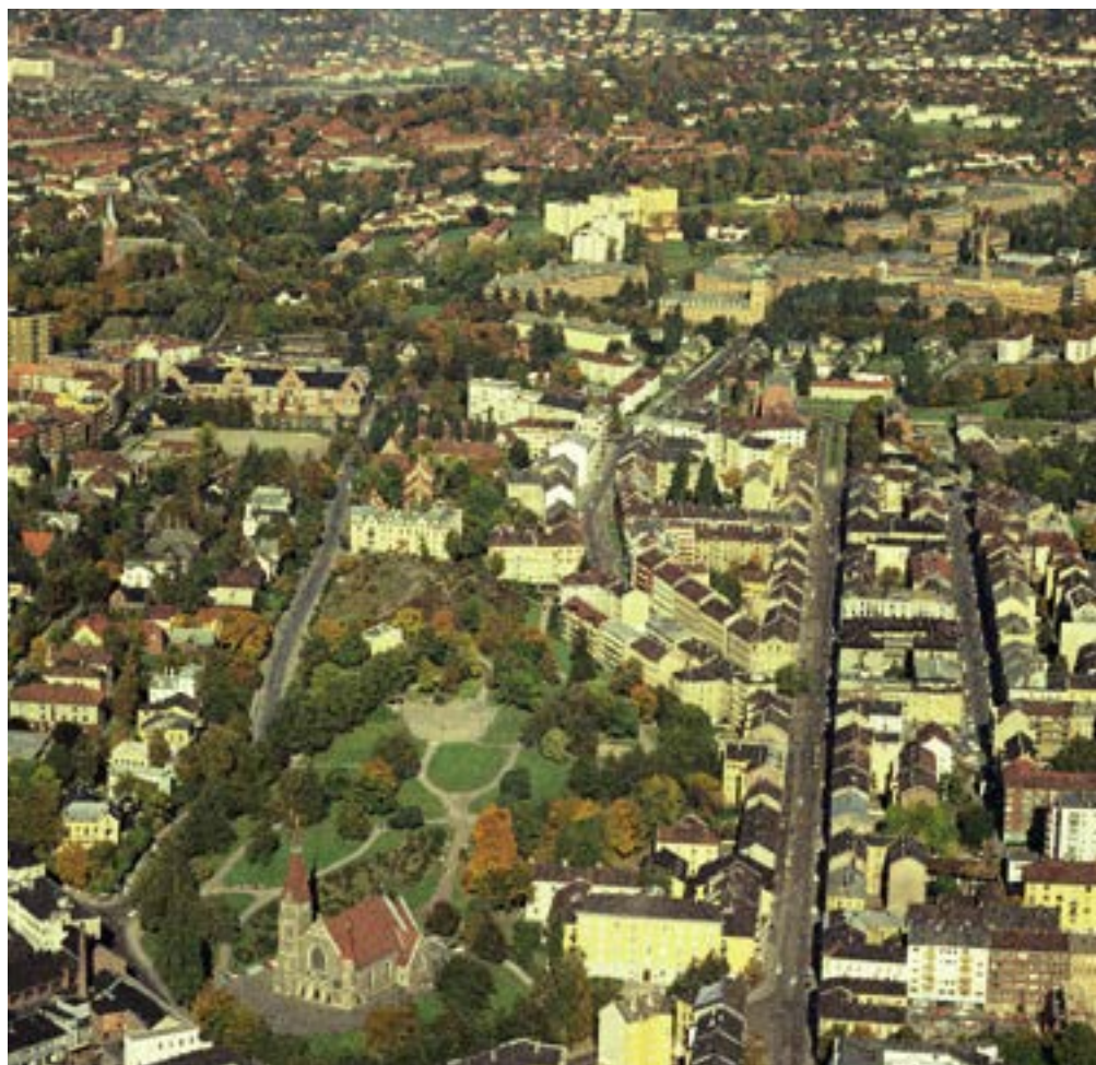
Stensparken, Ullevål sykehus i bakgrunnen. 1964.