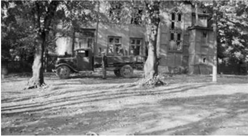
Reiersens løkke.

I 1865 anmeldte Reiersen at han ønsket å oppføre et tilbygg til hovedbygningen. I byggeanmeldelsen står det at de utvendige veggene mot gårdsrommet vil bli oppført i bindingsverk og utmurt med kalkstensmur. Iflg folketelling i 1875 bodde Reiersen i tilbygget, Pilestredet 84 b, med familie, tjenerstab og logerende.