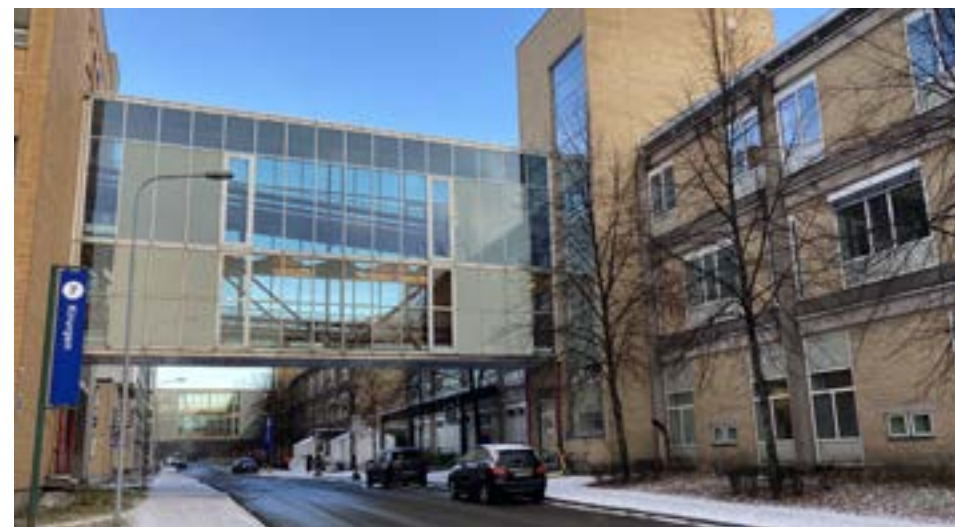
Barneavdelingen med bro over til kirurgen. I bakgrunnen bro over til kvinnesenteret.

Over gata ligger barneavdelingen (bygg 09), et stort løft, ferdig i 1999. «Føde- og barn» fra Aker og Ullevål ble samlet her sammen med gynekologisk avdeling i et nytt kvinne- barnsenter som også omfattet det eldre bygg 8 eller Nordfløyen. Barneavdelingen har en variert utforming med synlige, konstruktive elementer som søyler tilpasset bjelker og tilstøtende vegger og fasadelementer. Bygningen er delt opp i lesbare partier skilt med tydelig eksponerte trappe- og heistårn (ØKAW arkitekter). Bygnin-