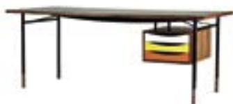
Nyhavn arbeidsbord / Finn Juhl, 1945