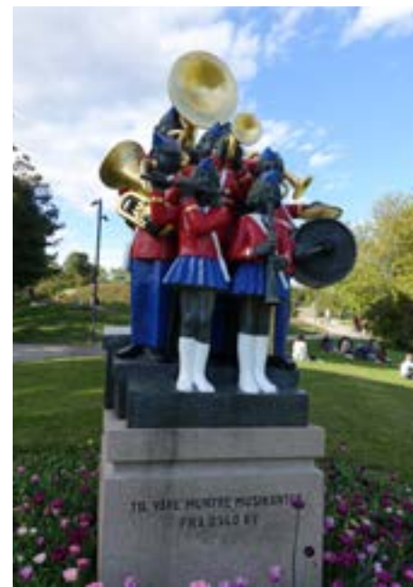
«Til våre muntre musikanter fra Oslo by» av Arne Vinje Gunnerud.

Gunnerud ble født i Oslo 11. august 1930, og døde i Arendal 25. april 2007. Fra 1970-årene har Gunnerud arbeidet mest med bronse, til dels i stort format med utsmykningsoppdrag.