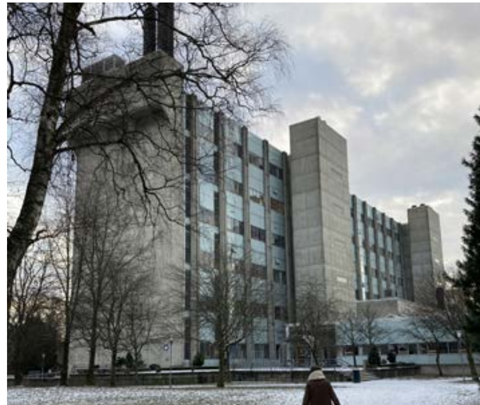
Labatoriebygget, blodbank, ferdig i 1976-1980. Fredet.