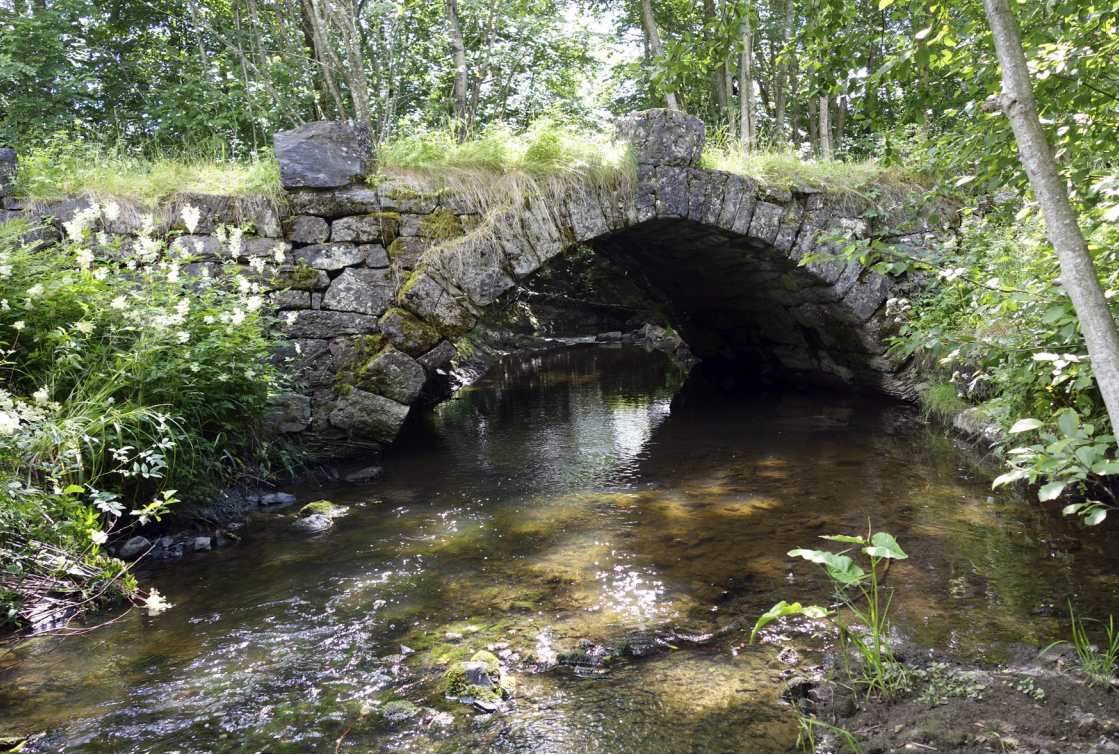
Gamle Øverland bro.