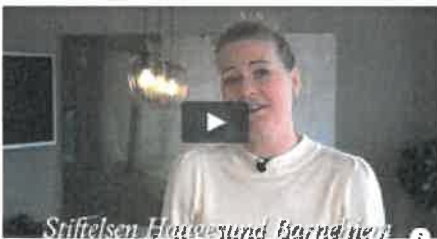
Stiftelsen Haugesund Barnehjem | Mai 2022