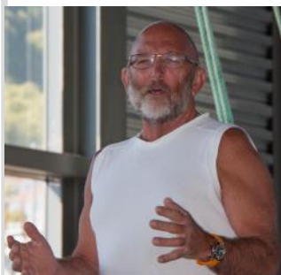
Foredrag med stor innlevelse

1800-tallet. Mennene som i små skuter søkte nye næringsveger dro over havet mot Vestisen og Grønland for å tjene til livets opphold. Det skulle fanges rev, sel og isbjørn til skinnhandelen.