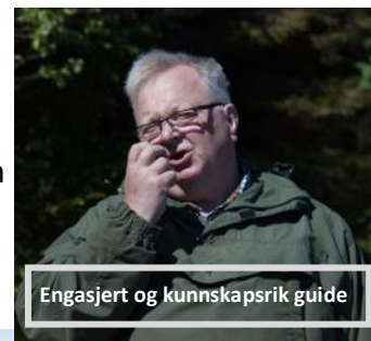
Engasjert og kunnskapsrik guide