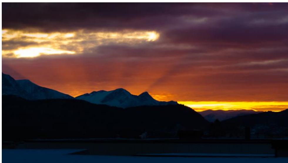
«Solsnu» - det går mot lysere tider!

Org.nr. 987 814 217 Bankkonto 3910 26 50933 Våre nettsider finner du på www.puiaa.no