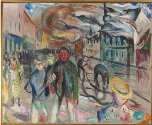
Edv. Munch var der og lagde skisser av brannen.

forunderlig nok er det annonser for to av dem på forsiden samme dag. Akkvisitørene må ha handlet raskt. Litt lenger ut i avisen finner vi dessuten en liten notis: «Branden på Grønland forevises allerede i aften