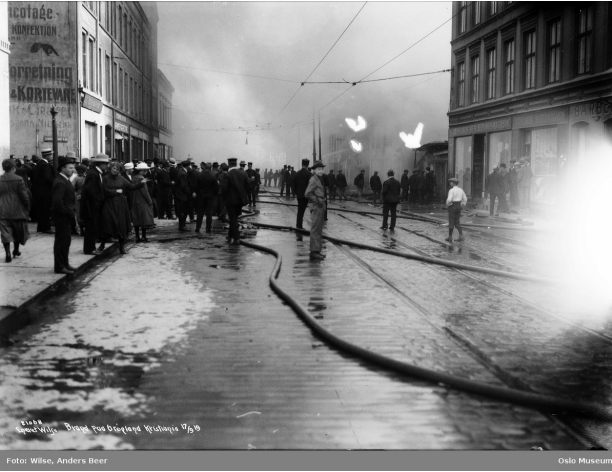
Brannen på Grønland 17/9 1919.