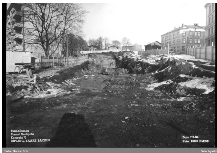
Heibergløykka ble nesten utslettet av tunnelbanearbeidene på Tøyen i 1960, men ble bevart med et nødsrik!

Byantikvar Arno Berg var forferdet over disse plane- ne og han foreslo barnehage som et mulig bruksom- råde. Ideen ble ikke realisert på det tidspunktet og nye trusler oppsto. Undergrunnsbanen skulle bygges,