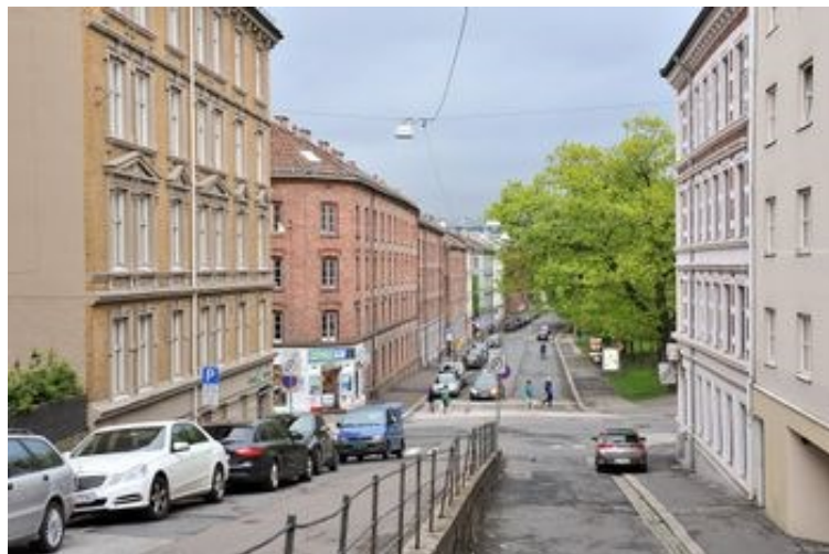
Jens Bjelkes gate sett nordover fra Sexes gate.