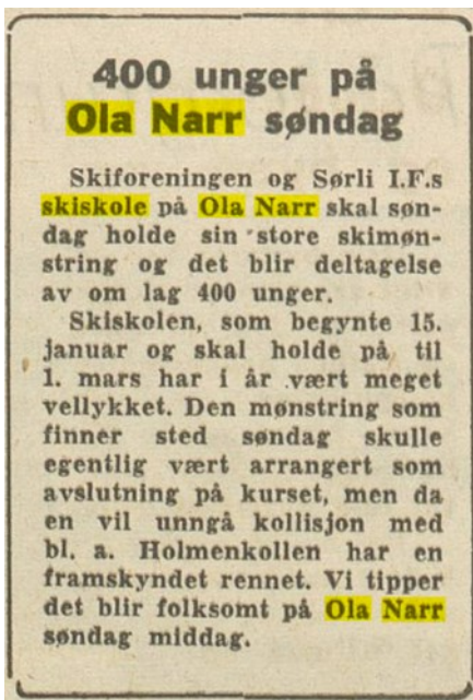
Arbeiderbladet lørdag 17/2 1951