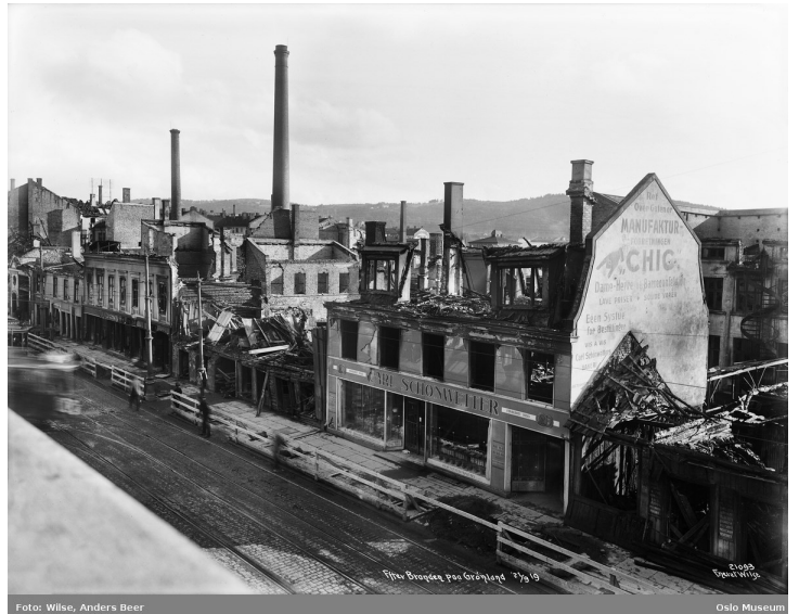
Etter brannen på Grønland, sett fra Grønland 21/9 1919.

av møbler, bekledningsgjenstander og varer av enhver art ble ustanselig kjørt bort. I et av husene forsøkte man å lempe et piano fra 2. etg ned på gaten, men forsøket mislyktes og pianoet knustes mot brostenene. I Schønwetters bakeri søkte man å redde hele beholdningen av bakervarer, noe som visstnok bare delvis lyktes; midt mellom alle brannslangene på gaten fløt brød og honningkaker i store mengder. ---- Heldigvis gikk det ingen menneskeliv tapt, men den første tiden var man vitne til mange uhyggelige scener hvor gråtende barn løp omkring fortvilet og ropte på sine foreldre. ---- Fra bakgårdene inne i kvartalet lød rett som det var mektige drønn av sammenstyrtede vegger og tak. Politiet hadde sin fulle hyre med å av-