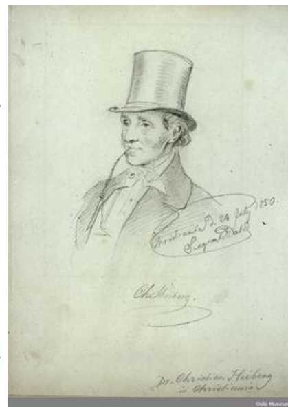
Blyanttegning av Heiberg fra ca. 1850, utført av Siegwald Johannes Dahl.

han å se den danske eventyrdikteren H. C. Andersen da han var på besøk i Kristiania i 1871. Den 18. august holdt man fest til ære for den berømte dansken i Botanisk hage.