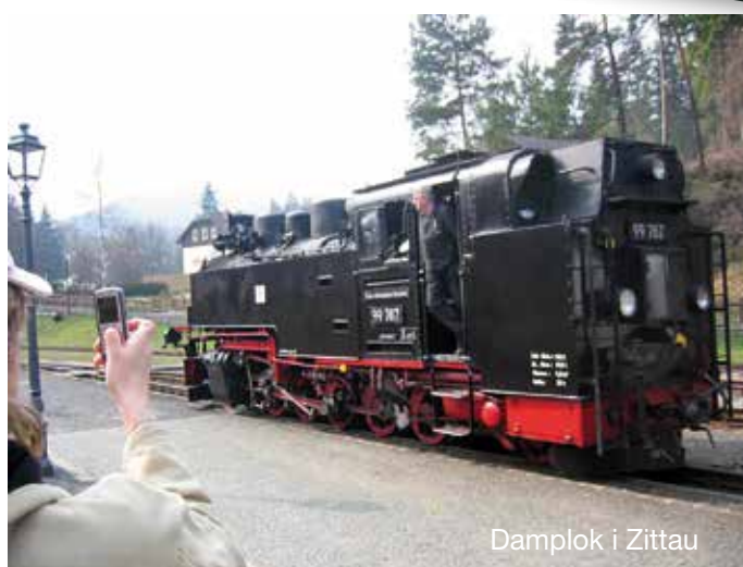
Damplok i Zittau