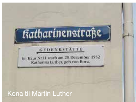
Kona til Martin Luther