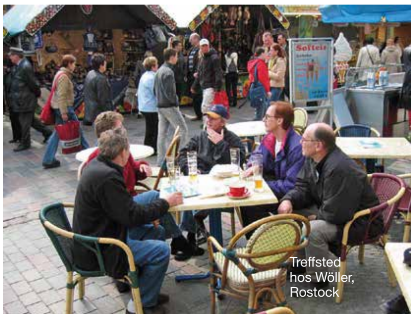
Treffsted hos Wöller, Rostock

I Kühlungsborn tok vi «Molli» til Bad Doberan, her gikk toget inni byens gater. I Rebnitz-Damgarten besøkte vi et flott ravmuseum. Videre besøkte vi bryggeriet i Stralsund, rakettmuseet i Peenemünde og Otto Liliental (Tysklands flypioner) museum i Ahlbeck, før vi kom til grensa mot Polen. Alle tok en spasertur over grensen.