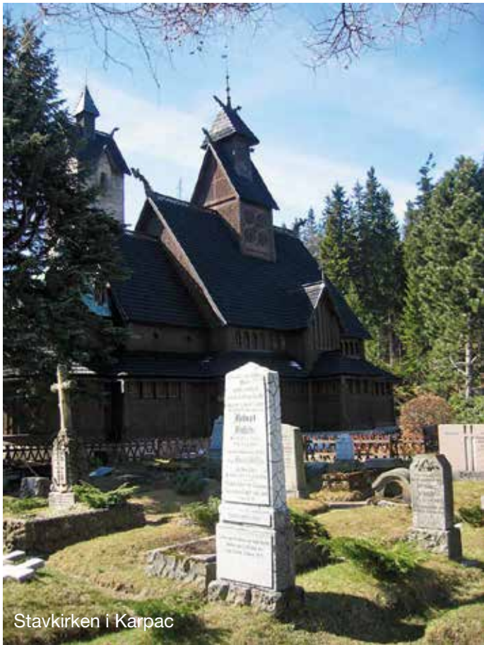
Stavkirken i Karpac