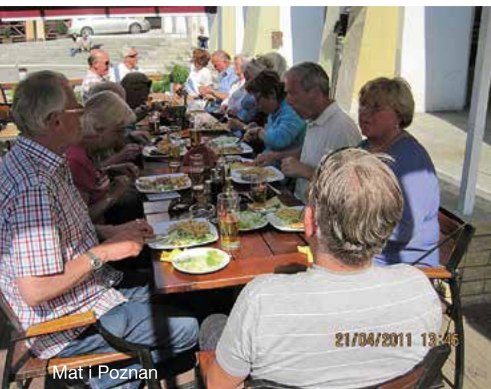
Mat i Poznan