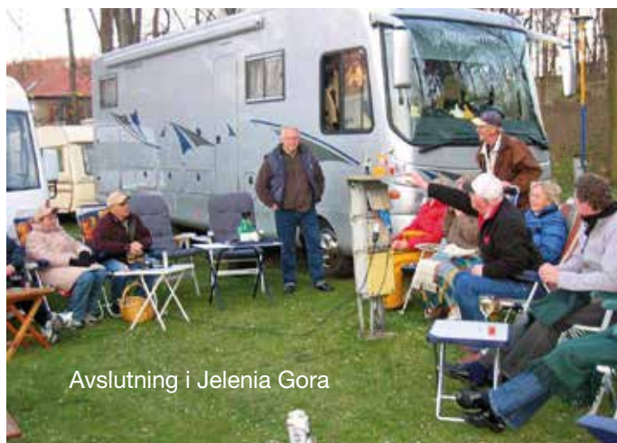
Avslutning i Jelenia Gora

I Zittau henger det et fastklede fra 1400, som er håndbrodert med bibelhistorie. Etter noen flotte kloster langs veien kom vi til Liberec, CZ. Vi passerte Harkova, hoppbakke og besøkte en norsk stavkirke i Karpac. Turen ble avsluttet i Jelenia Gora.