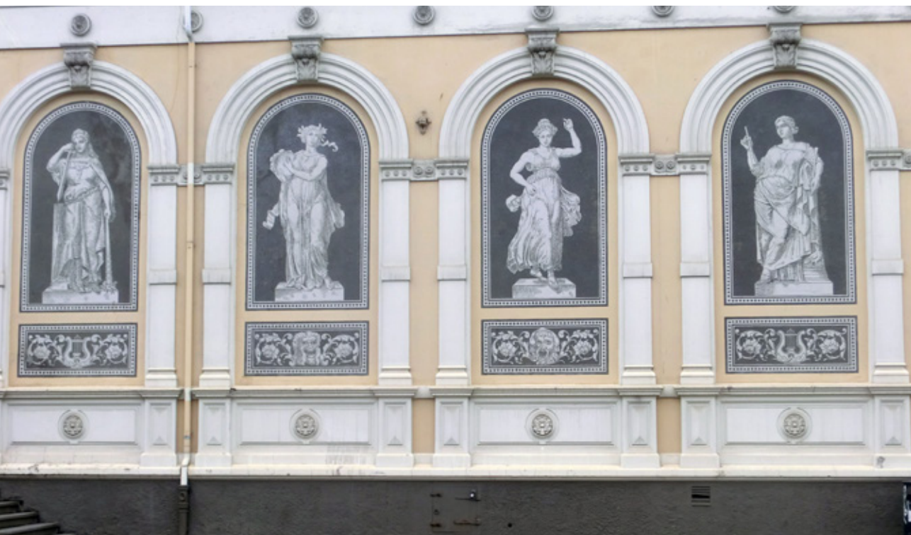
TEATERVEGGEN: Musene er beskyttere for kunstene tilknyttet teatret: dans, komedie, tragedie og lyrikk.

Men den gående som stopper opp litt, vil få et glimt inn i gammel europeisk kultur. I nisjene