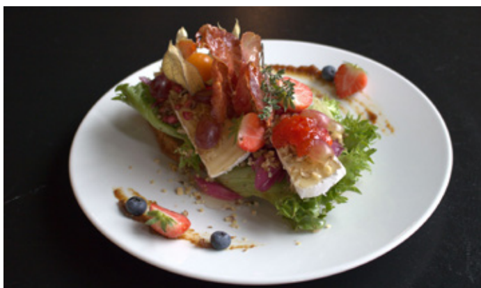
SMØRBRØD: Sansen for Smak har stor suksess med sine danske smørbrød, men også disse har sin unike vri.