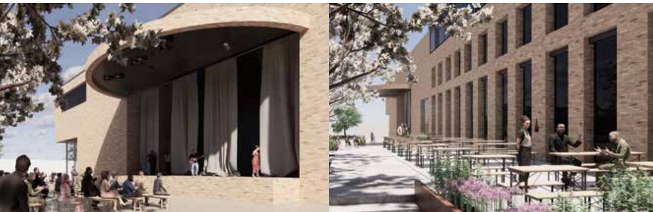
Skisser fra mulighetsstudien ved Dyvik arkitekter viser hvordan teatrets nye tilbygg kan bli seende ut.

– Vi kom ikke med på statsbudsjettet i år, men setter vår lit til neste års statsbudsjett.