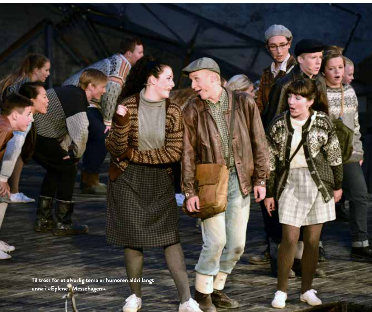
Til tross for et alvorlig tema er humoren aldri langt unna i «Eplene i Messehagen».