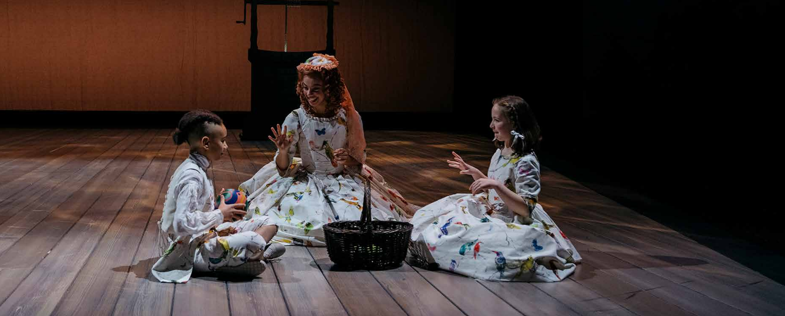
Teatersjefen er stolt over teatrets mangfoldssatsing, og flere av teaterskolens barn spiller nå i Mio min Mio.

både nasjonalt og internasjonalt. Vi må også se på hva som rører seg i samtiden. På teatret har vi et dramaturgiatet. Sammen skal vi finne materialet som gjør himmelen vår litt høyere, som kan trigge oss, få oss til å stille spørsmål og bevege oss. Det synes jeg er viktig. Og så jobber vi i en vekselvirkning mellom klassisk og nyskrevne dramatikker, sier Elisabeth som også liker å flytte bøkene opp på teaterscenen. - Jeg synes det er mye interessant i litteraturen. Og teateret kan tilføye så mye fordi vi er mer enn bare teksten. Det er menneskene, lys, lyd, kostymer, scenografi og møtet med publikum. Vi er også ute og ser forestillinger på andre teater, men det har det jo blitt lite av under pandemien, sier Elisabeth