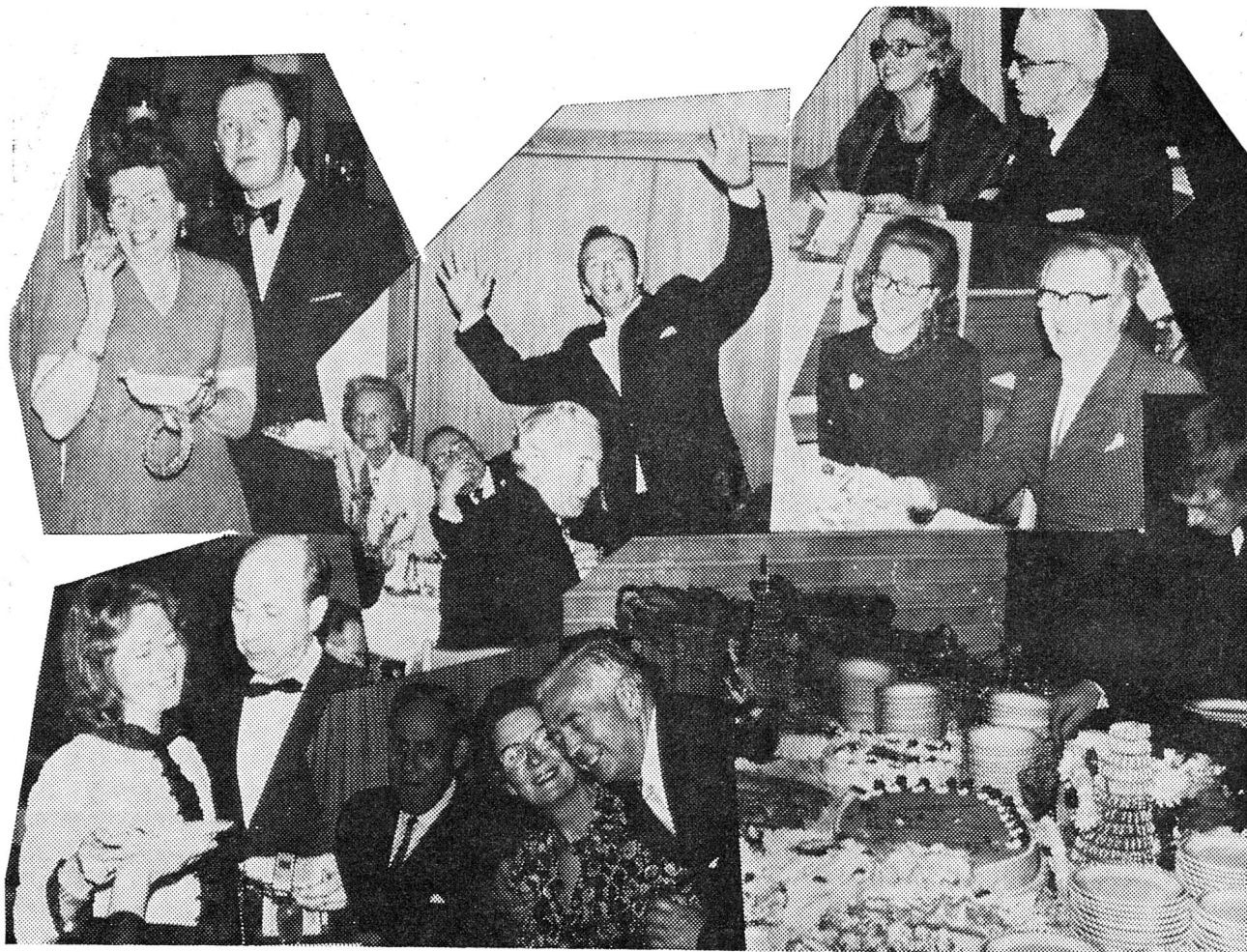
Noen av de glade festdeltakere på Fagerfjell.