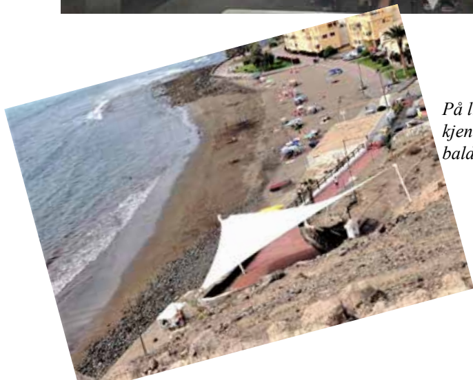
På litt avstand er kirkens kjennetegn den lyse, store baldakinen.