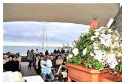
Bilde fra en av seremoniene i fjellkirken i El Pajar med havet i bakgrunnen.