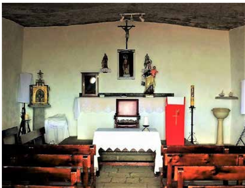
Slik ser den lille kirken ut med et flateinnhold på ca. 50 kvadratmeter.