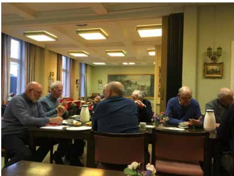
Brødre tilstede på Det Gyldne Anker.

Meningen var også å ha promosjon slik «Det Blanke Skjold» i Sarpsborg hadde, og den 19. januar 1993, holdt «Det Blanke Skjold» sin promosjon og her ble 15 Brødre fra «Det Gyldne Anker» tatt opp, igjen et jubileum, det er 25 år siden.