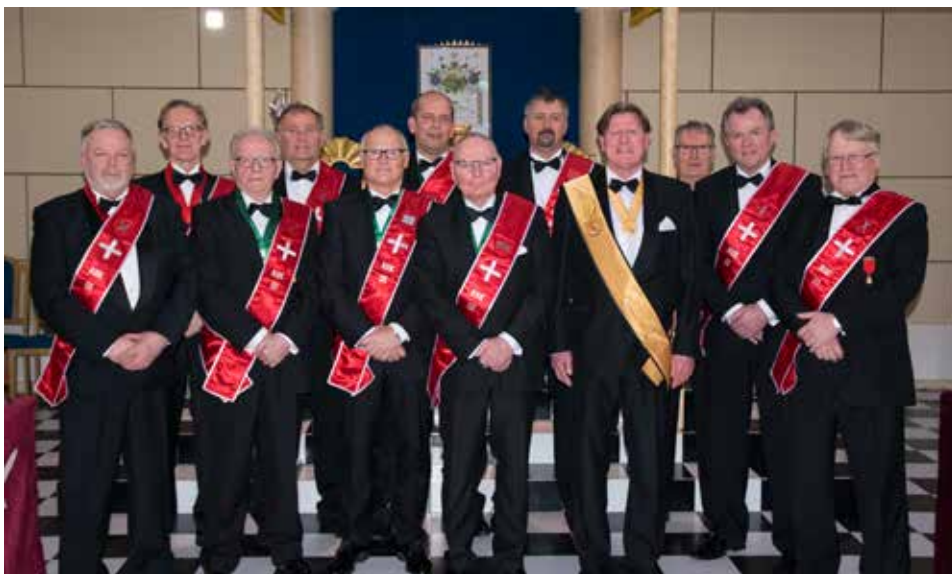
Den nye Hird for 2018