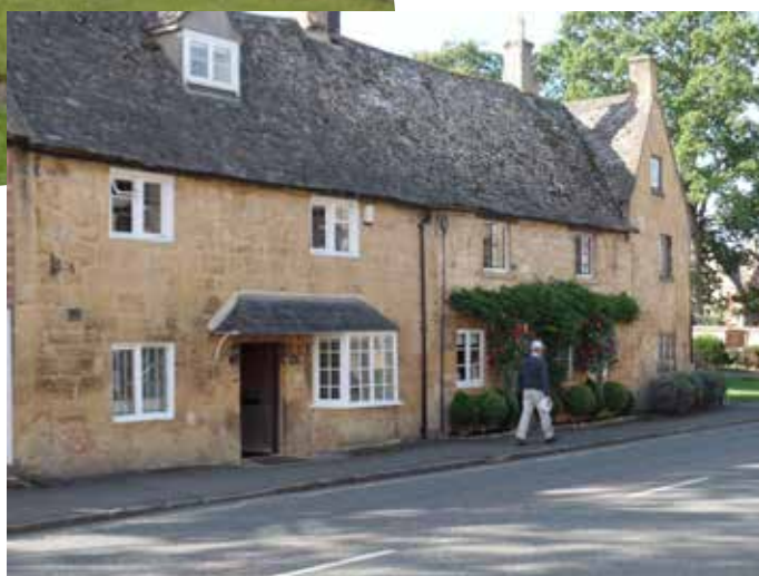
Bilder fra landsbyen Broadway i Cotwolds..