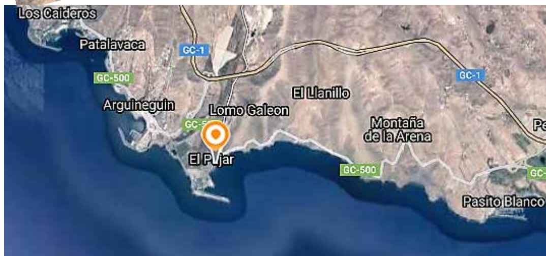
Kartet viser hvor på Gran Canaria kystbyen El Pajar ligger plassert.