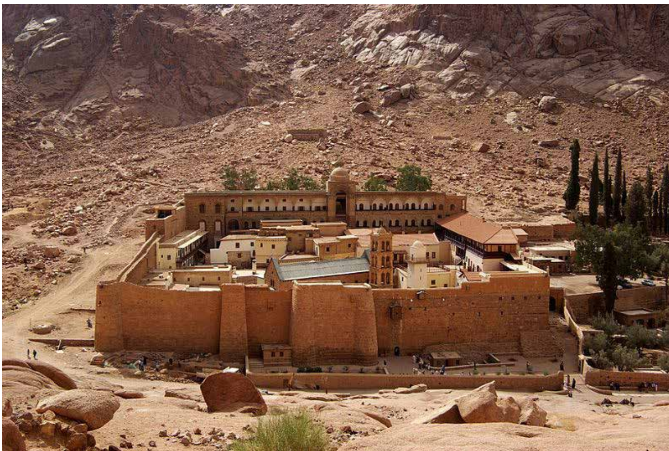
Katarinaklosteret i Sinaiørkenen.

Katarinaklosteret er et ortodokst kloster som ligger ved foten av Sinaifjellet i Egypt. Det er oppkalt etter den hellige nonnen Katarina. Klosteret er kristenhetens eldste og «Verdensarven» står på UNESCOs liste over verdens kulturarvsteder.