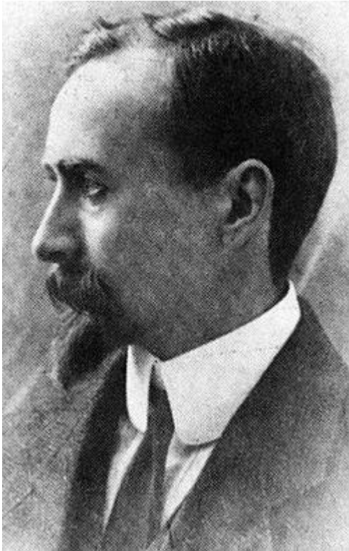
Kyrre Grepp, Arbeiderpartiets legendariske partileder fra 1918 til 1922. Han døde i 1922 av tuberkulose, bare 42 år gammel. Hans skjegg er tydeligvis inspirert av kjente russiske revolusjonære.