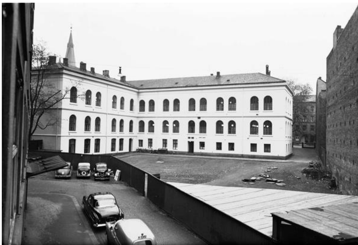
Hammersborg skole med adresse Akersgata 73A. Det var i disse bygningene Rudolf Nilsen gikk de to siste årene på latinlinjen 1918-1920. Man skimter Akersgata i bakkant til høyre og spiret på den katolske St. Olavs kirke over taket på skolefløyen til venstre.

Våren 1919 mens Rulle gikk i 2. gym. på Hammersborg høyere skole, tok han spranget inn i den organiserte politikken og meldte han seg inn i Samfundslaget som var tilknyttet Norges Sosialdemokratiske Ungdomsforbund (som var datidens navn på ungdomspartiet til det enn så lenge samlede Arbeiderpartiet).