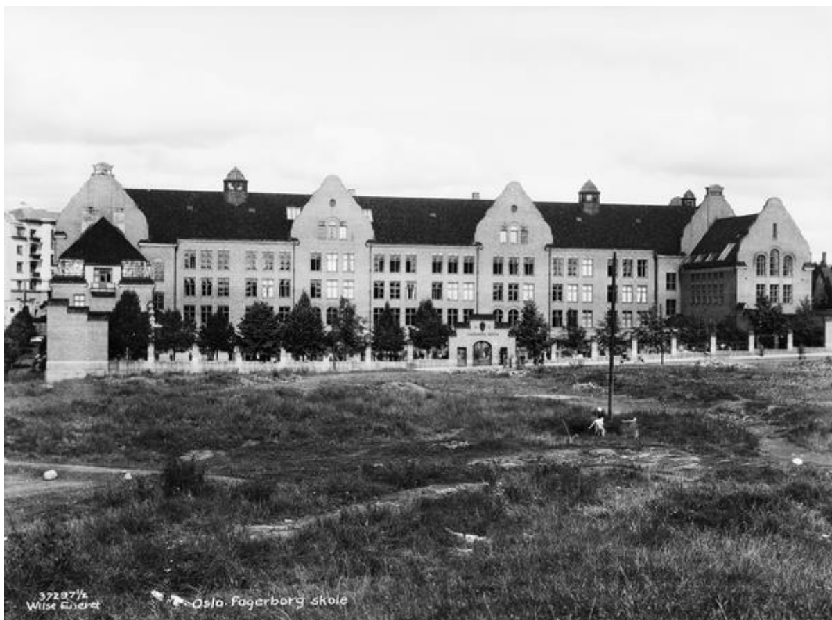
Fagerborg skole i Pilestredet 109. Det var her Rudolf Nilsen gikk de to avsluttende årene på middelskolen og fortsatte videre på 1. gym. som han gjorde ferdig i 1918.