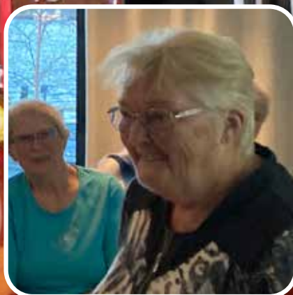
Turid inviterte til møte om fremtidsfullmakt