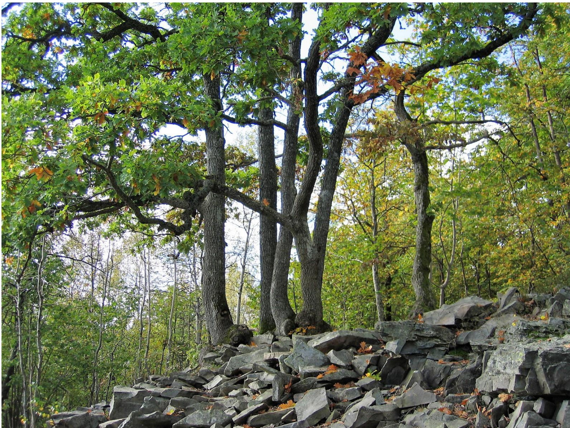
Fra området under Eineåsen som ble vurdert i 2006

Naturmangfoldstrategi for Bærum kommune behandles nå i hovedutvalg for miljø, idrett og kultur og ventes på høring med det første.