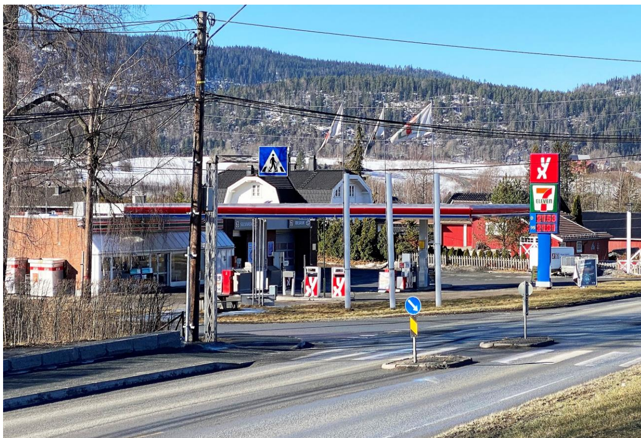
Kommunen ber utbygger holde ny bygningsmasse innenfor rammen av dagens bygning.

Byggesaken om nedlegging av bensinstasjonen og bygging av dagligvare-butikk, er i en utredningsfase der kommunen kommer med spørsmål og krav til utbygger.