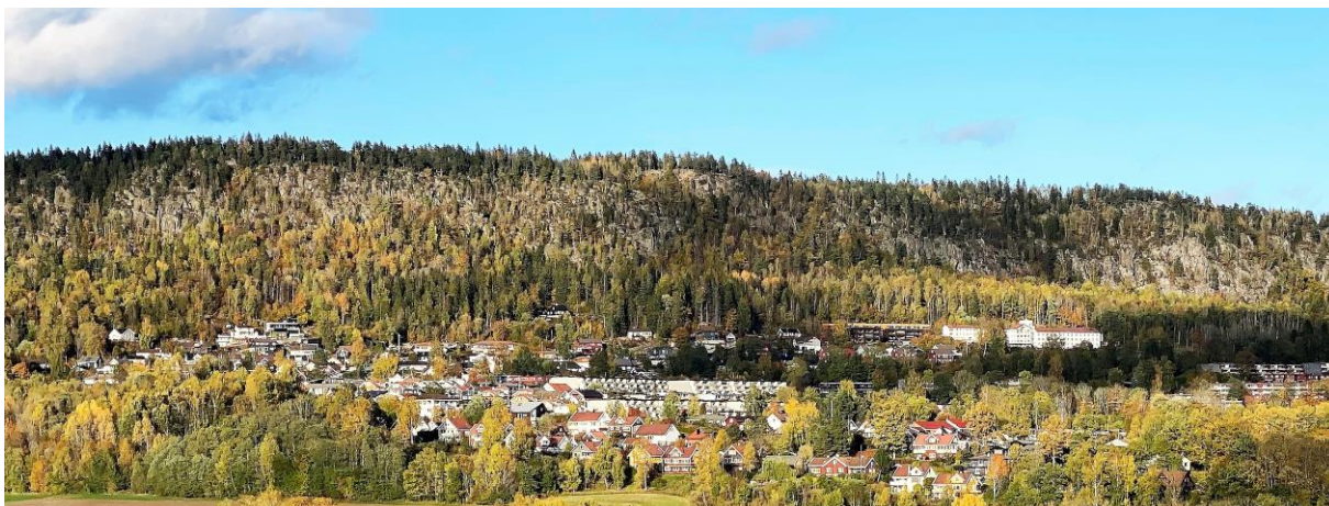
Det ser landlig ut her fra Skui gård. Plass til flere enn de rundt 10.000 som bor her allerede?

Planutvalget i kommunen gjennomførte 1. gangs behandling av kommunens arealplan 12. september. Her fikk forslag om å vurdere fortetting på Rykkinn flertall. Avdøde ordfører, Odd Reinsfelt, sa det imidlertid slik på årsmøtet for noen år siden: «Rykkinn er ferdig utbygget». Se også side 2.