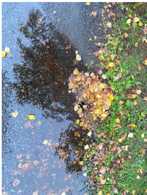
Her er det faktisk en avløpsrist!

Før var dette en plikt for alle som hadde eiendom til offentlig vei. Men ta gjerne kosten og sjekk utenfor eiendommen din, så slipper du vann på avveier.