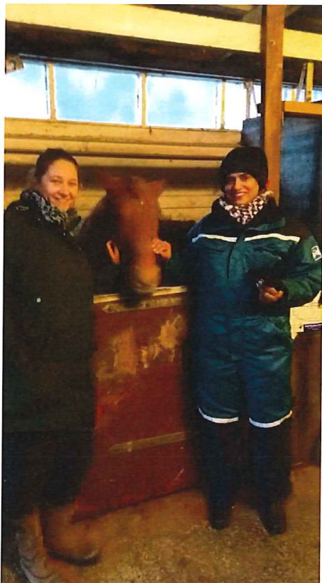
Her er to kvinner sammen med Bergrisa.

Høsten 2016 etablerte vi et tilbud til mødregruppen i Vestre Aker bydel. Gruppen er innvandrer mødre på Hovseter.