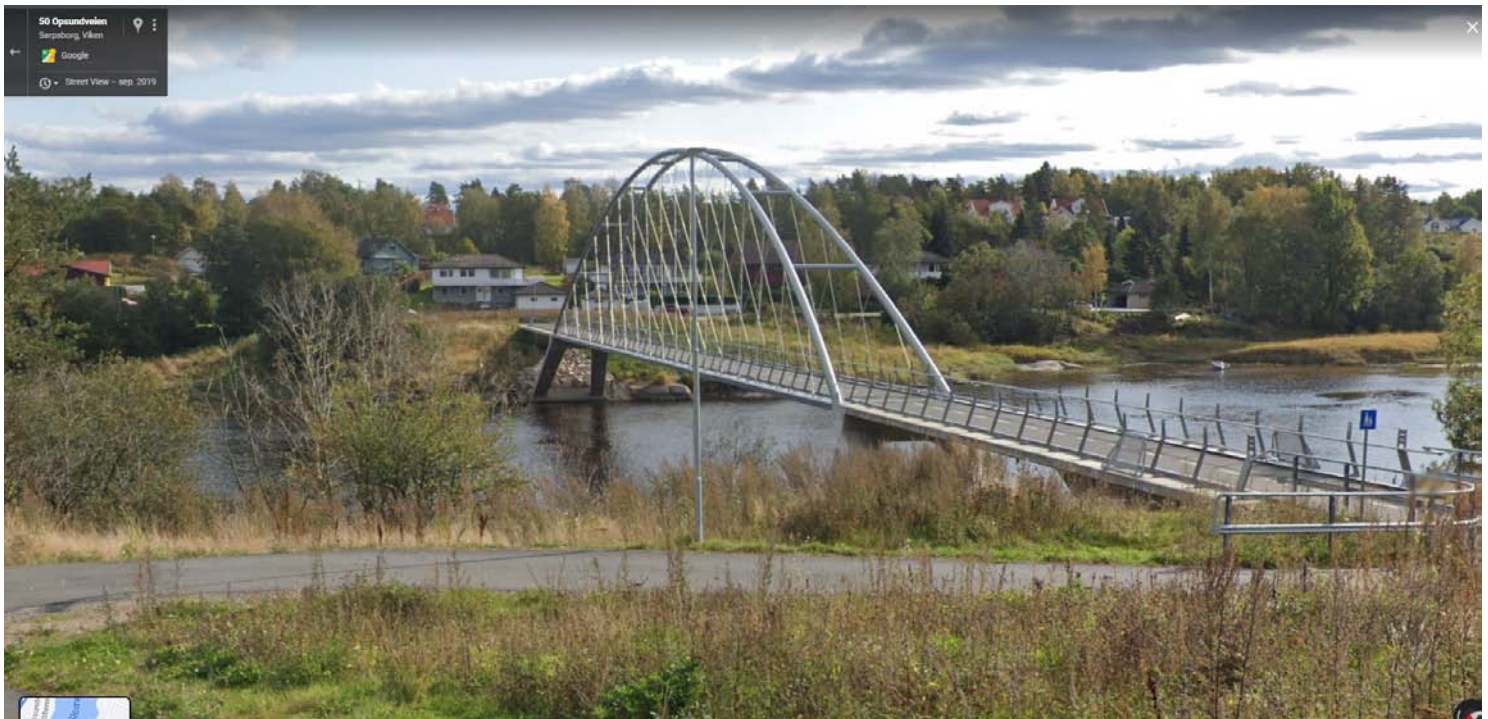
Eksempel 2: Nettverksbuebro Oppsundveien, (Statens veivesen)