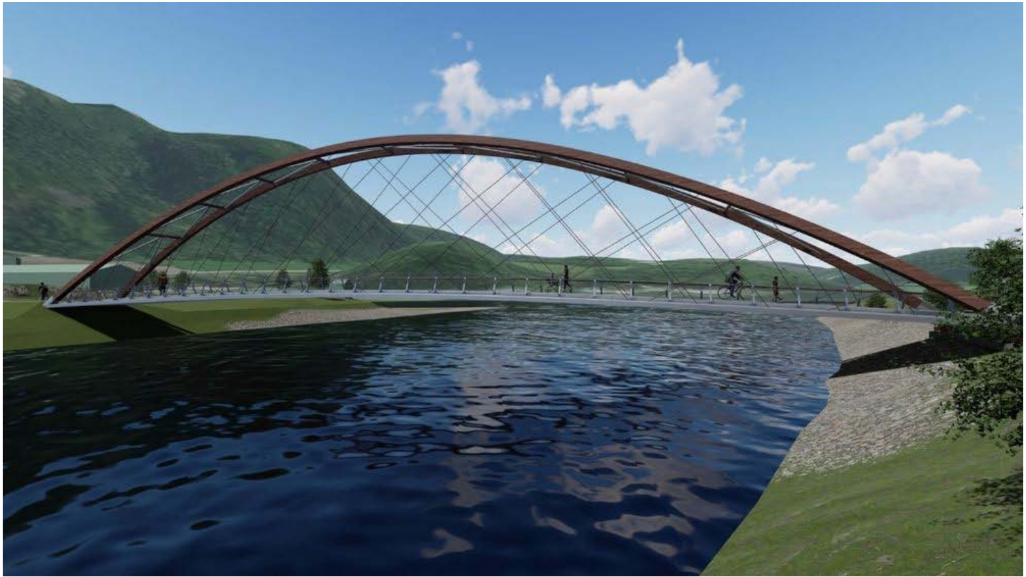
Eksempel 1: Nettverksbuebro Frønes, (Statens veivesen) Lengde 65 m bredde gangbane 3 m