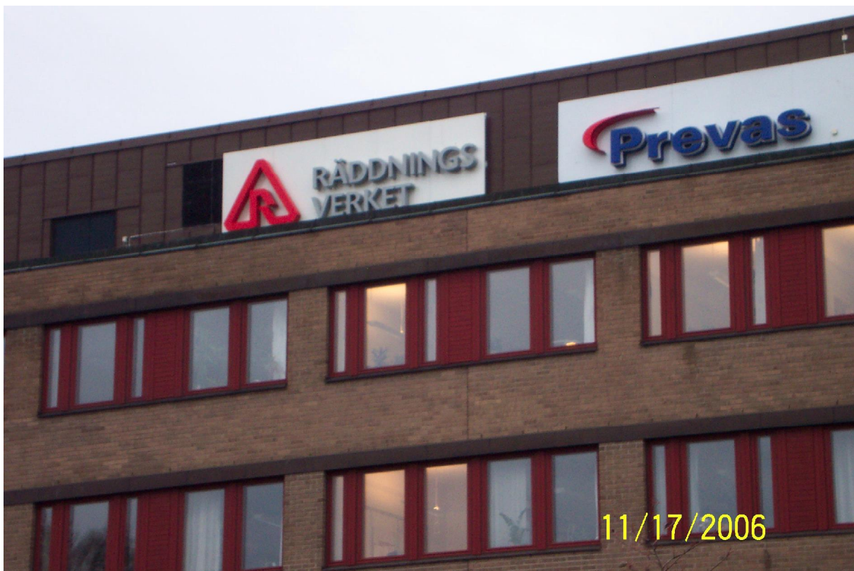
Bilde fra Räddningsverkets hovedkontor i Karlstad.