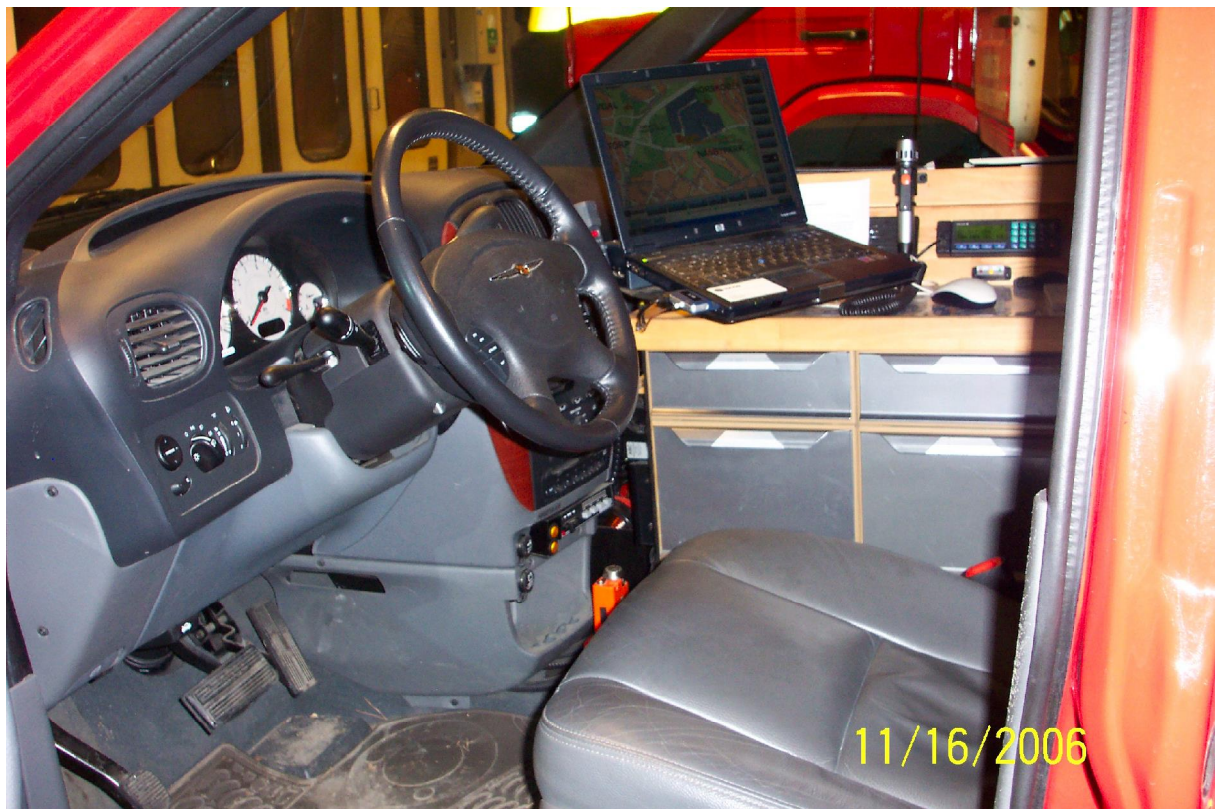
Del av Innsatslederens fører- og kommandoplass i kjøretøy.