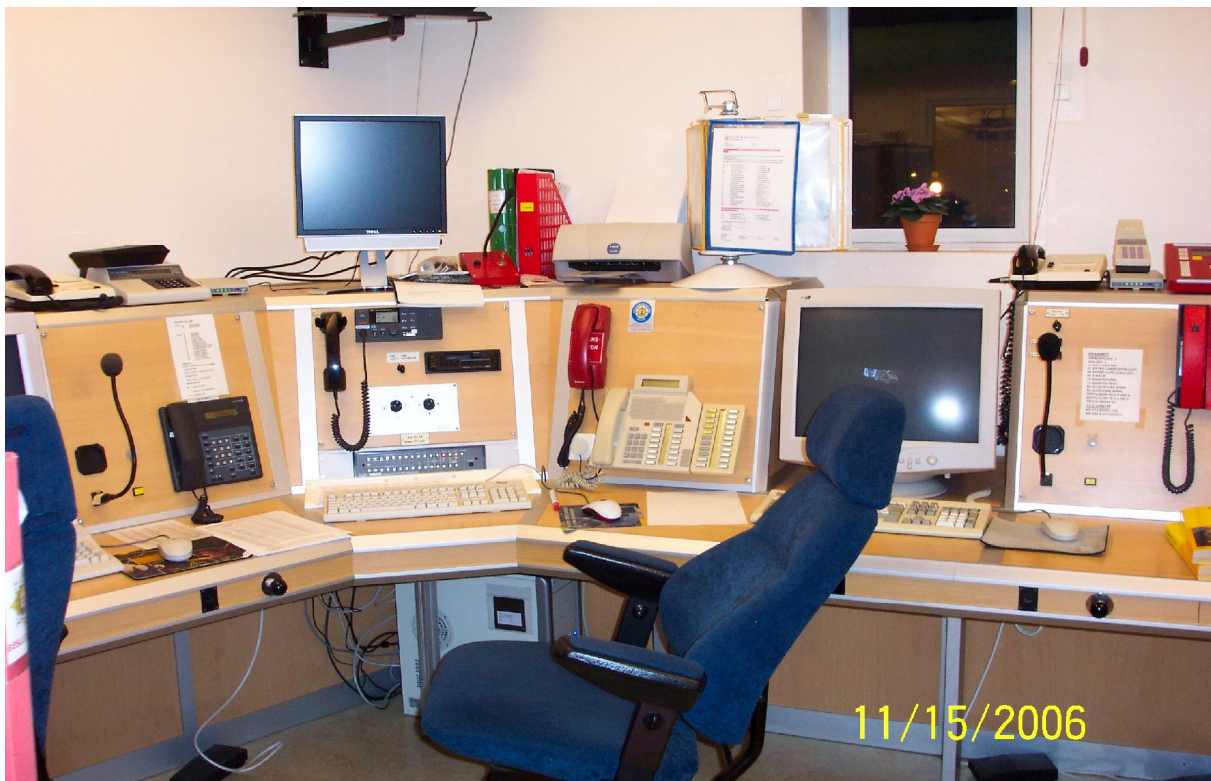
Del av aksjonssentralen for store hendelser i Kalmar.