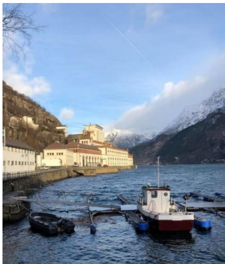
Tyssedal Kraftlags Venner