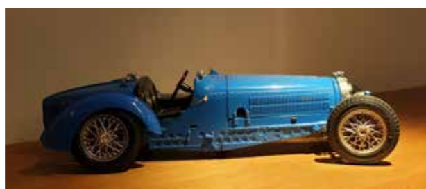
Bugatti eller BMW med boat-tail?

Vi lå på hotel Baseler Hof, et av Hamburgs eldste hotell, og på et av møterommene var det en hylle med modellbiler på rekke og rad. Her er to av de.