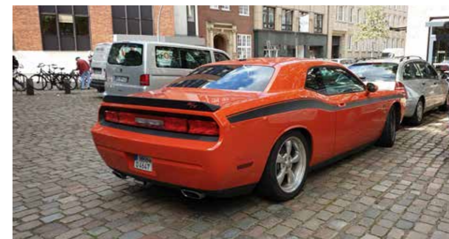
Stilig blikkfang, Challenger RT observert i Hamburg.

Vil du ha mer info om klubben på SMS? Ring 980 30 483 eller send en e-post til: kontakt@amcarfredrikstad.com NB! husk å melde fra om du bytter mobilnummer Søke medlemskap, søknadskjema finner du her: www.amcarfredrikstad.com/img/diverse/blimedlem.pdf