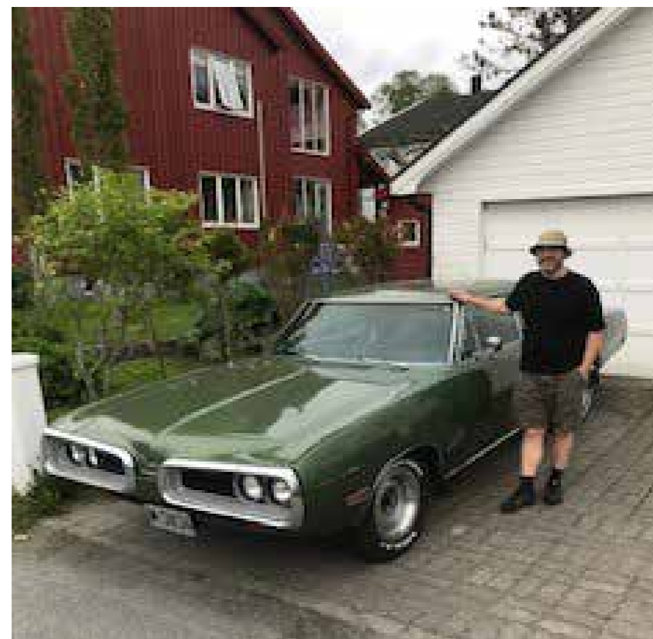
▲ 70 Super Bee

Og hvis noen lurer på om vi fikk noe fisk, jada.