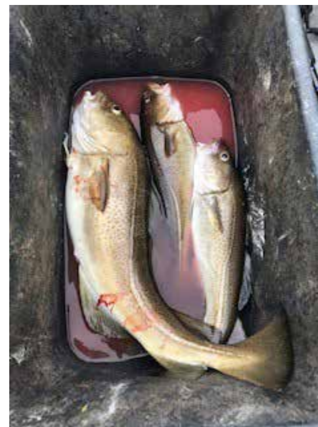
Bildebevis: fisk! ▶