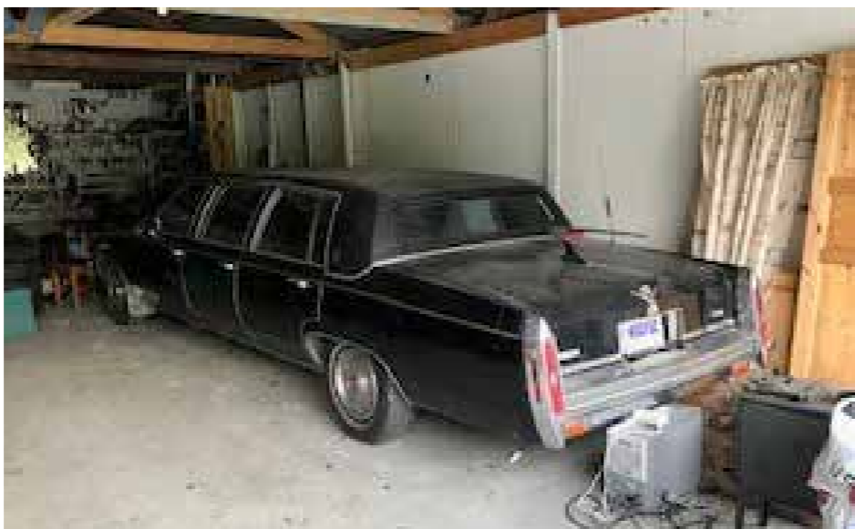
▲ Cadillac limousinen som har vært med i Olsen-banden filmene.

Da han sa at de hadde 3 stk stående på eiendommen, ble jeg litt i fyr og flamme og han tok seg tid til å vise oss de.