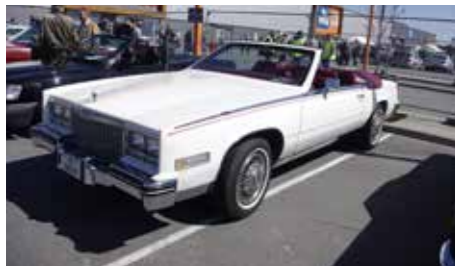
▲ I 1976 kom Cadillac med sin «absolutt siste» convertible og som en stor gimmic leverte de 200 nummererte og identiske Eldorado Convertible Bicentennial. Når GM så i 1984 reintroduserte sin Eldorado Convertible var det mange som hadde investert i den siste convertiblen som ble rimelig for.....net. 1984 Eldorado Biaritz convertible.