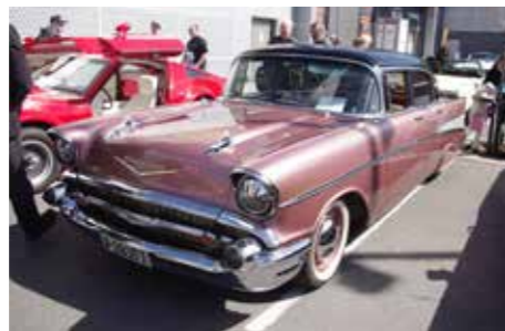
▲ 1957 Belair 4-dørs sedan med 265 Cid V8