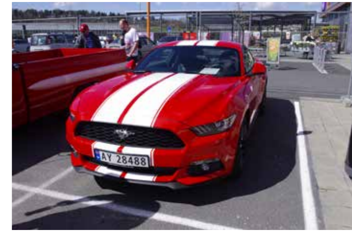
▲ Men med EcoBoost L4 på 317hk er det blitt bedre muligheter å få seg en ny Mustang på norske plater også. 2015 Mustang med 2,3l L4