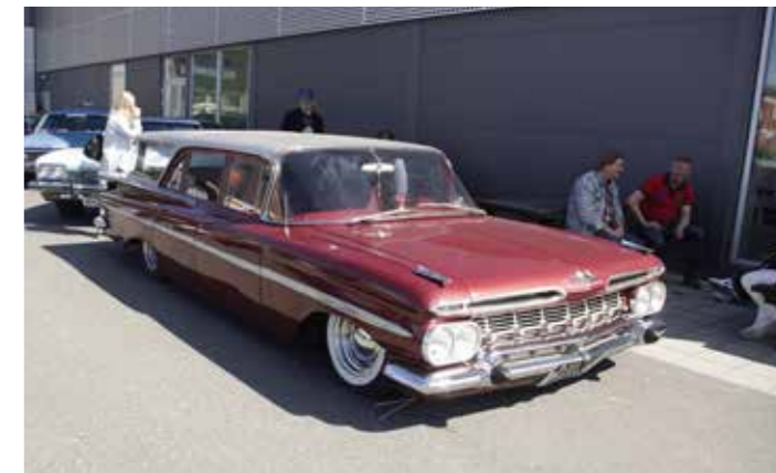
▲ Det var mulig å beskue flere fine stasjonvogner, 1959 Chevrolet Impala Wagon