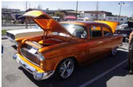
▲ En virkelig nydelig customert 1955 Chevy. Her har far og sønner stått for på å lage en virkelig perle.