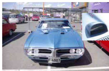
▲ 1967 Pontiac Firebird 400 med doble panserscope og turteller på panseret.