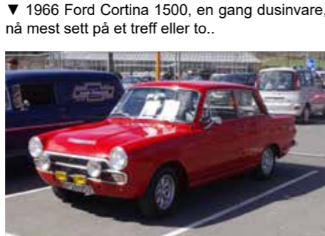
▼ 1966 Ford Cortina 1500, en gang dusinvarer, nå mest sett på et treff eller to..