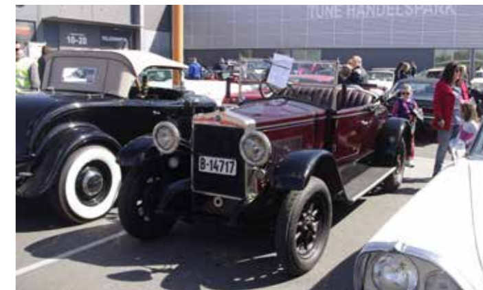
▲ 1927 Fiat 503