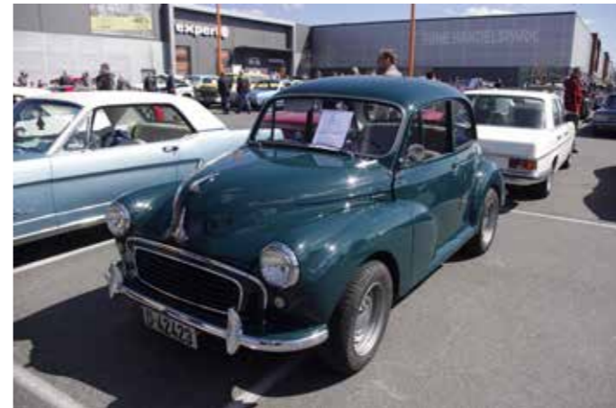
▲ Som med Right On treffet er vårmønstringen åpent for alle entusiast kjøretøy. Her en 1957 Morris Minor, på 70-tallet var det ikke uvanlig å se disse med fire voksne dansker og full pergass på taket på tur over fjellet.