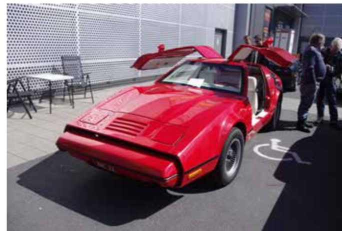
▲ Bricklin SV-1, produsert fra 1974 til sent 1975, det ble produsert under 3000 biler i løpet av disse årene. Husker jeg ikke feil var dette en 1975 modell, og da med en Ford Windsor 351 cid.