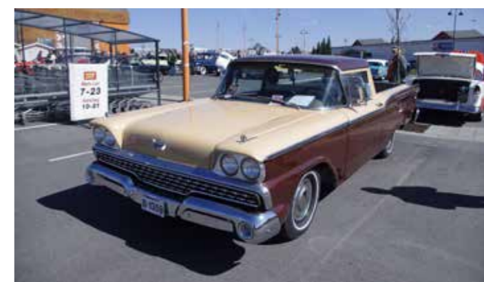
▼ Pickup med personbilfølelse, 1959 Ford Ranchero.