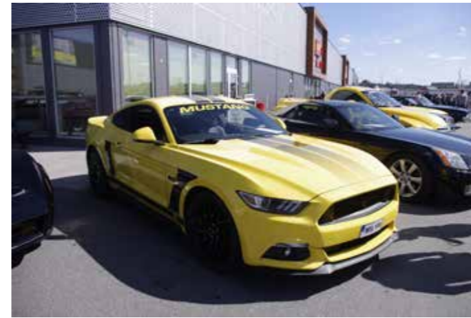
▲ Slik er vi vant til å se nyere amerikanere, med V8 og svenske plater