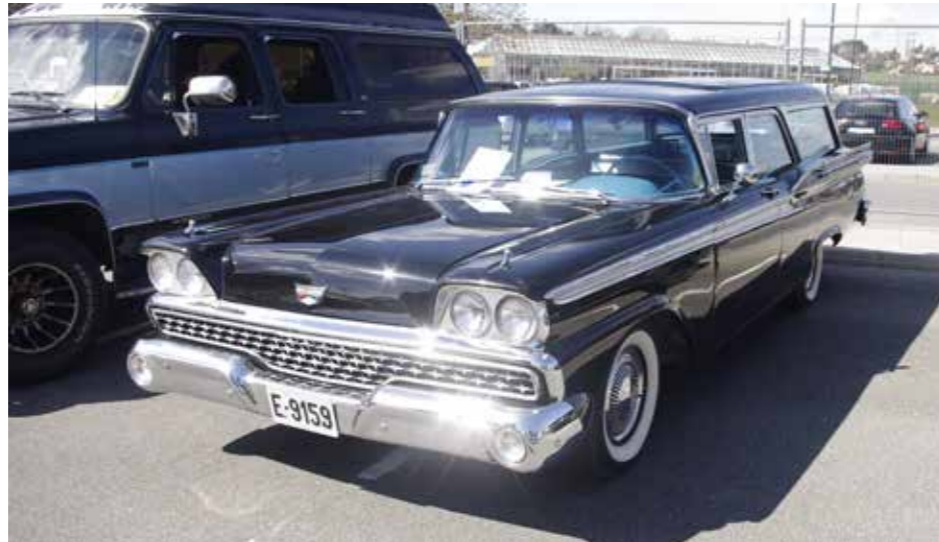
Stasjonvogner har fått seg en renesanse de siste årene. Biler som før ble sett på som donorbiler er dermed blitt sjelden vare. Og fint er det verdt at det ikke bare er toptoppe å se på.

Påskecruisingen er jo årets første, men det er ikke alltid det passer inn med ferdigstillelse av prosjekt eller dato. Skjærer det seg er det fint å kunne starte sesongen med en tur til Coop Tune og se hva som har funnet veien ut fra vinterdvalen. Årets mønstring bød på strålende solskinn og generelt bra treffvær. Årets treff må betegnes som stinn brakke hvor det ikke hele tiden var helt greit å få plass till alle som tok en tur, men med litt tålmodighet løste plasseringen seg.