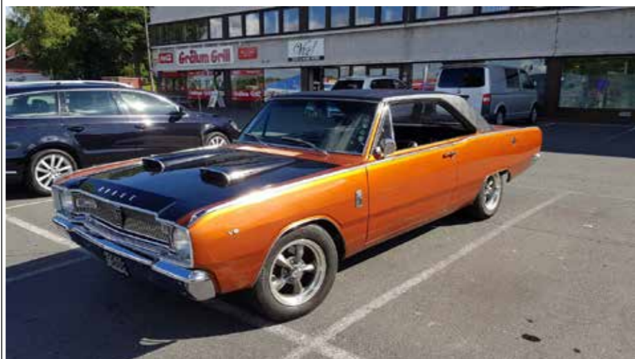
Sett i farta, hender en må på butikken og plukke opp litt for. Her er en til som var på butikken, 1967 Dodge Dart GT