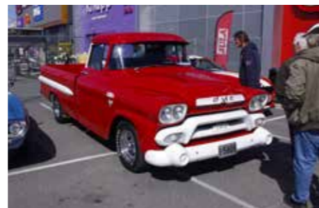
▲ En fin Pickup er heller ikke å forakte.