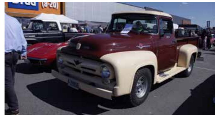
▲ Morsom 1956 Ford F-100