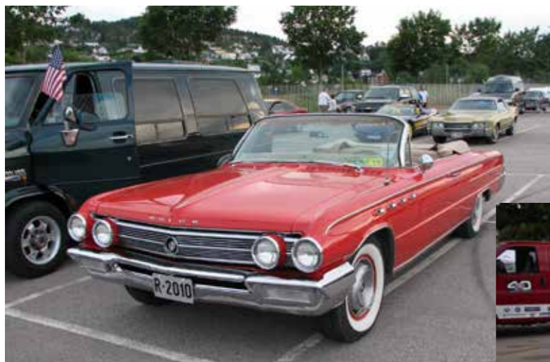
◀ 1962 Buick Electra 225 Convertible