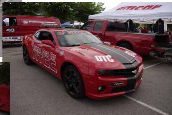
▲ Amcars stand med en råtass, Camaro