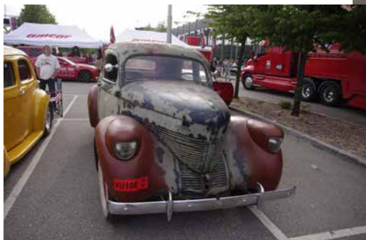
◀ 1939 Willis Overland