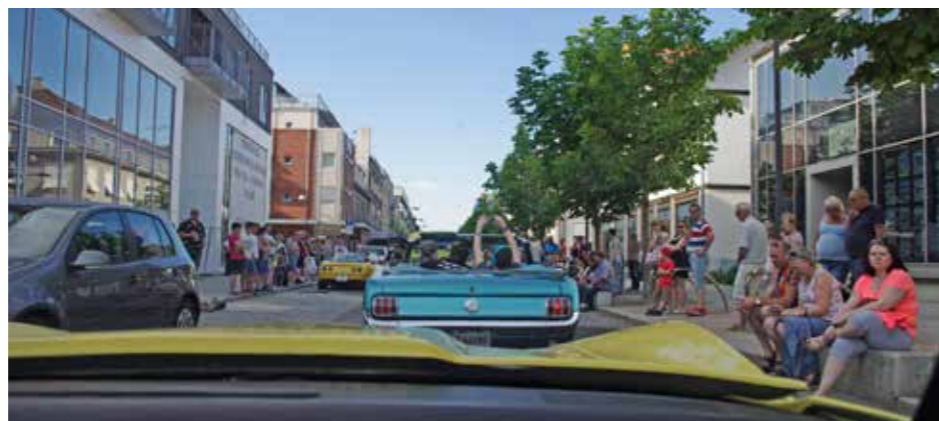
Sånn kan crusing gjennom Lillestrøms gater fortone seg, grei utsikt det..

I 1776 deklarte nybyggerne i de nye provinsene uavhengighet fra «moderlandet» Storbritannia og som enhver nasjon må man ha en grunnlov. Den nye grunnloven ble på denne dagen godkjent av den nye kongressen og ble også med tiden en nasjonal helligdag. Dagen feires også her i Norge, ambassaden har en feiring i Frognerparken, mens det største arrangementet er den årlige fjerde juli cruisingen i Lillestrøm. Lillestrømklubben startet den første cruisingen i 1989 og med årene har dette vokst til en av landets største. Med utgangspunkt i varemessens område er det lagt opp «løyper» gjennom Lillestrøm, hvor enkelte gater kun er åpne for US-biler. At arrangementet er blitt så populært har