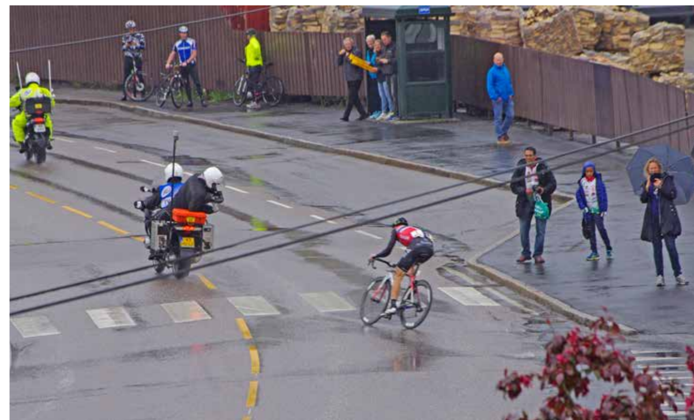
Her er en liten en for de som måtte ha slike interesser... Edvald Boasson Hagen i tet opp Grålumveien. og etter denne digresjonen går vi tilbake til bil.