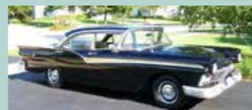
1957 Ford Fairlane 500 4dr sedan. Bilen er original Sort med sort og gult interiør. Bilen er i bruksstand, har ikke vært restaurert men tatt noenlunde vare på