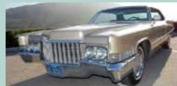
1970 Cadillac Sedan Deville 4dr HT. 472 og MYE utstyr. Bilen har kun hatt få eiere og er i meget god stand.

Den nye MOON katalogen er på lager selvfølgelig. Sendes direkte i postkassa ved forskudd Kr 75.- til konto 61050582425 Merk Moon 2012 !