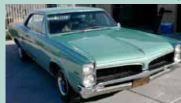
1967 LeMans Coupe. Superfin Californiabil med 121000 miles på telleren. Original bil med 326 og Automat. Har servostyring og bremses samt dobbelt exosanlegg.