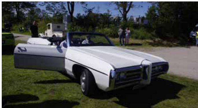
▲ Roy er på plass med Bonneville ▼ Fiin gammel Buick, «When better cars are built Buick will build them»