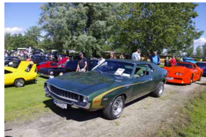
▲ AMC Javelin, ikke dagligdags kost ▼ Kø av biler frem til bedømming