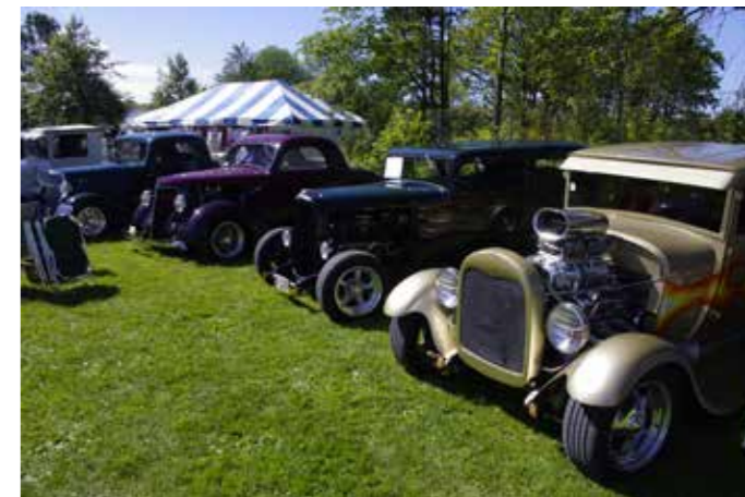
▲ Rod-folket har funnet sammen ▼ Og noen tok «sykkelen» fatt