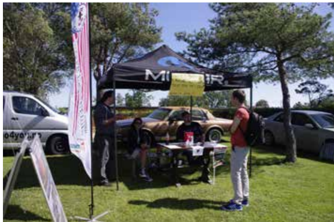
▲ amcar Fredrikstad info. telt

En æra er over, fjorårets Power Meet var det siste i Norge, men det betyr ikke at det er vårt siste treff. Vi kjører i gang igjen i år, samme sted med nytt navn. Noe det jobbes med i disse dager, så følg med..