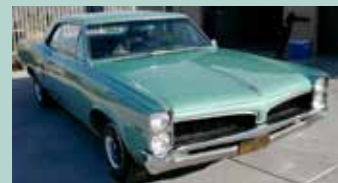
1967 LeMans Coupe. Superfin Californiabil med 121000 miles på telleren. Original bil med 326 og Automat. Har servostyring og bremses samt dobbelt exosanlegg.