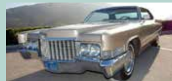
1970 Cadillac Sedan Deville 4dr HT. 472 og MYE utstyr. Bilen har kun hatt få eiere og er i meget god stand.

Den nye MOON katalogen er på lager selvfølgelig. Sendes direkte i postkassa ved forskudd Kr 75.- til konto 61050582425 Merk Moon 2012 !