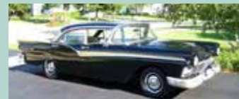
1957 Ford Fairlane 500 4dr sedan. Bilen er original Sort med sort og gullt interiør. Bilen er i bruksstand, har ikke vært restaurert men tatt noenlunde vare på