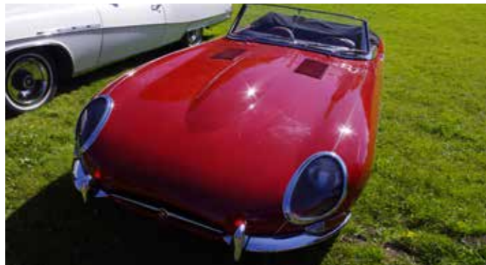
▲ Det er også åpent for annet enn US biler, her en klassisk Jaguar ▼ Åpne pansere trekker motorfolket