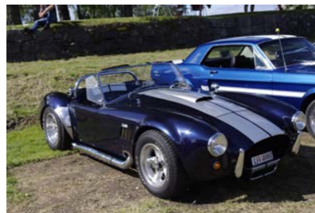
▲ Du sniker deg ikke avgårde med denne bilen....