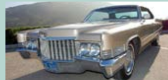
1970 Cadillac Sedan Deville 4dr HT. 472 og MYE utstyr. Bilen har kun hatt få eiere og er i meget god stand.

Den nye MOON katalogen er på lager selvfølgelig. Sendes direkte i postkassa ved forskudd Kr 75,- til konto 61050582425 Merk Moon 2012 !