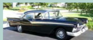
1957 Ford Fairlane 500 4dr sedan. Bilen er original Sort med sort og gult interiør. Bilen er i bruksstand, har ikke vært restaurert men tatt noenlunde vare på

ORDRETELEFON: 69 97 19 00 - FAX: 69 97 19 01