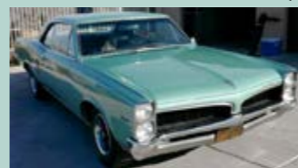
1967 LeMans Coupe. Superfin Californiabil med 121000 miles på telleren. Original bil med 326 og Automat. Har servostyring og bremses samt dobbelt exosanlegg.