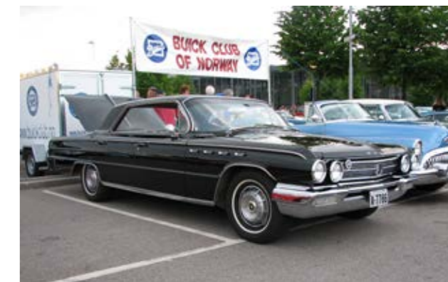
▲ 1962 Buick Electra 225, ikke ofte du ser rundt på veien. Dette er en senere import, men det ble faktisk importert en del av disse og førstegangsregistrert i 1962