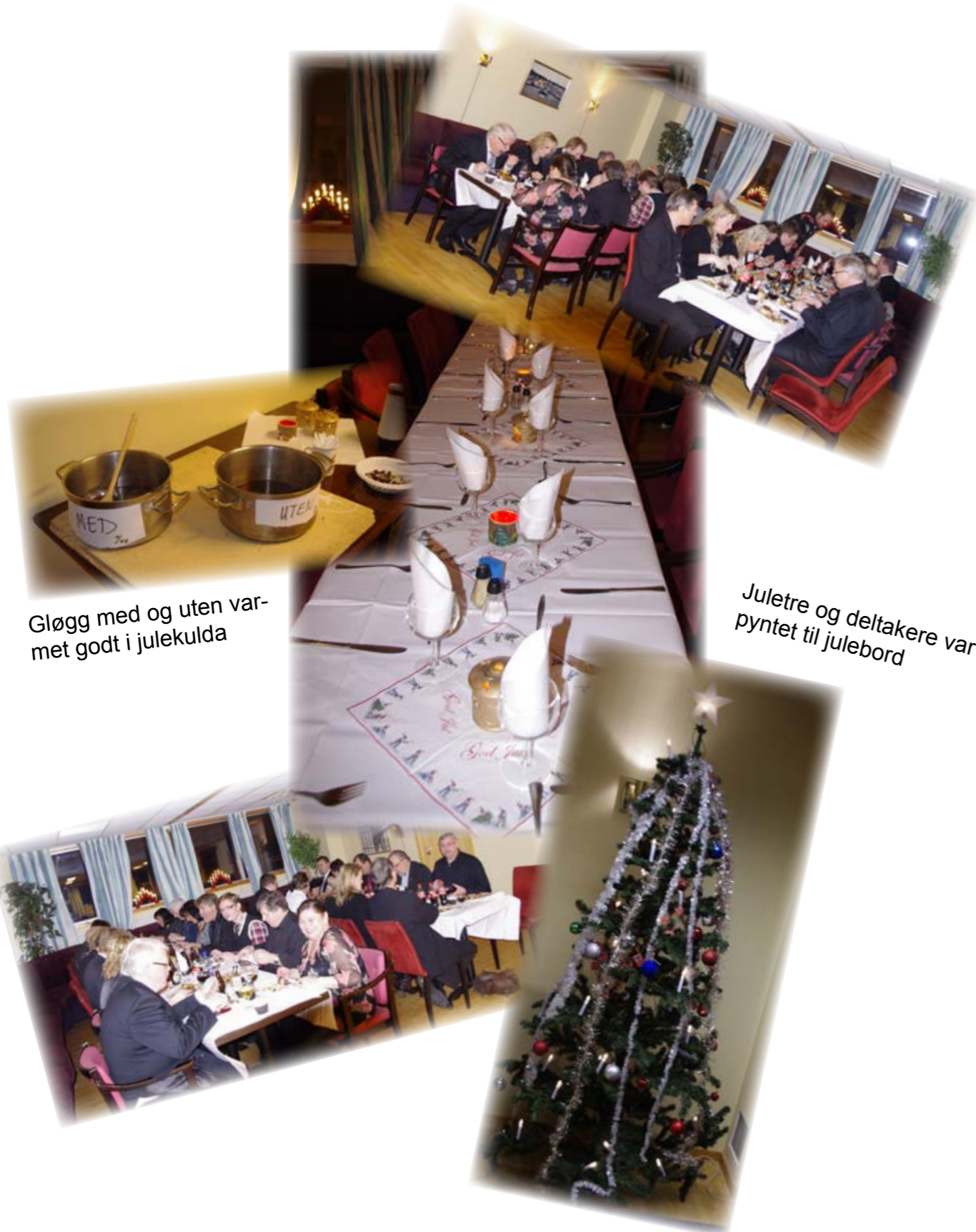
Gløgg med og uten var- met godt i julekulda

Som seg «hør og bør» arrangerte vi julebord på klubben i desember og til julebord hører det juletallerken med tilbehør. Selv om fremmøtet var noe lavt hadde de som kom en fortreffelig aften med mat, dessert, drikke og litt «jug og tull»