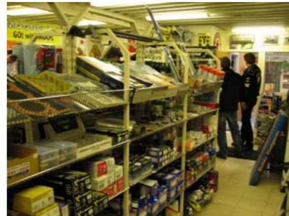
Velfylte hyller, med litt av varje for bilen og gjerne litt til hagen og huset og.