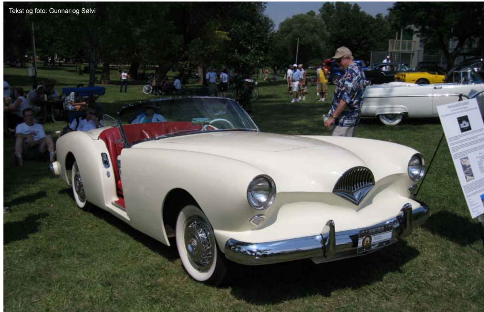
Bilen har en spesiell «look» med dørene som forsvinner inn i forskjermen, ingen fare for å slå døren inn i andre biler på parkeringen.