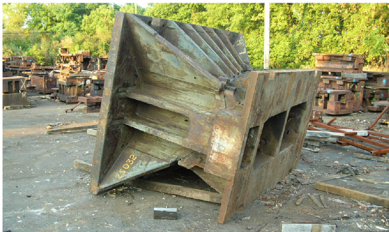
A-formen sett fra siden

for å gi en referanse. Og ja, noen av verktøyene vil bli skrotet, men vi kommer til å ta vare på noe og Ford kommer også til å beholde noen. Tenk på at disse er gjort med 50 år gammel teknologi. Så for å lage en del den gangen kunne det bety fire forskjellige former - en for å forme, en for å stanse hull, en for å trimme osv. Mens man i dag kan gjøre alle disse stegene med et verktøy.