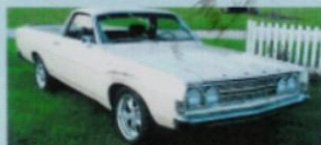
1968 Ford Ranchero kr. 90.000. 302 man. 17" American Torque-Thrust II, dobbel eksos etc. PPG white med sort interiør. Nydelig nyfakkert rustfri CA-bil.

Ny Moon-katalog! Kr.75,- fritt tilsendt mot forskuddsbetaling til vår bankkonto 6105 05 82425