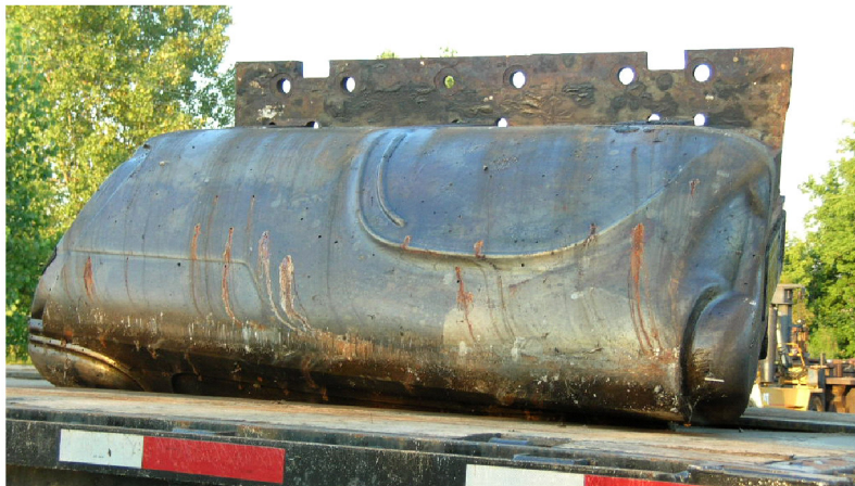
Man kan tydelig se linjene til forskjermene på B-siden av formen