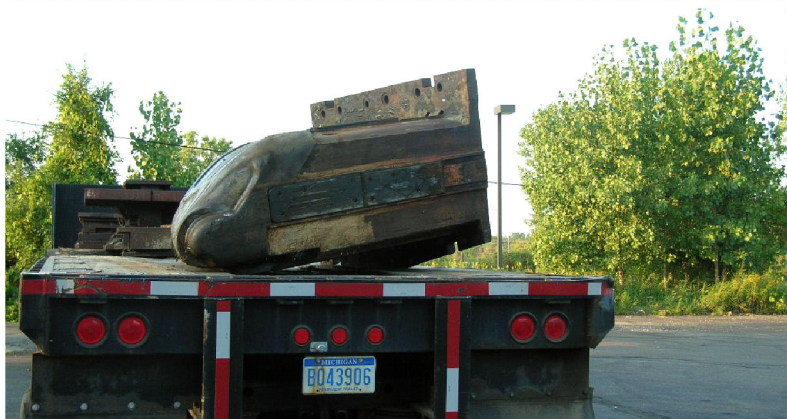
Solide saker som skal transporteres