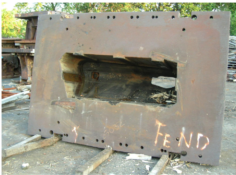
A-siden på verktøyet for forskjermene