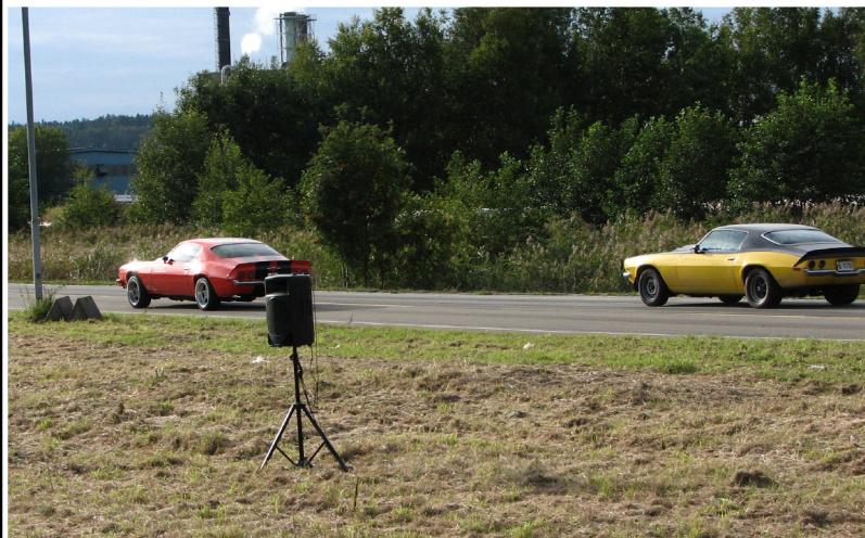
Ikke alle kom seg videre, selv om tanken bak navnet nok var tiltenkt konkurrentene