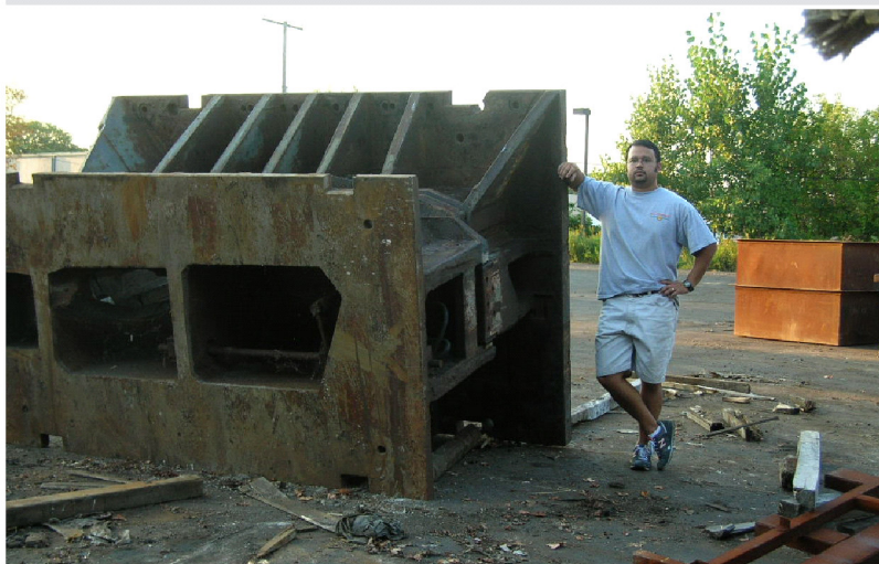
Pat viser her tydelig hvilke dimensjoner disse verktøyene hadde (har)

Som man kan se av bildene var det dimensjoner på det som var utgangspunktet for bilene vi duller med i dag.