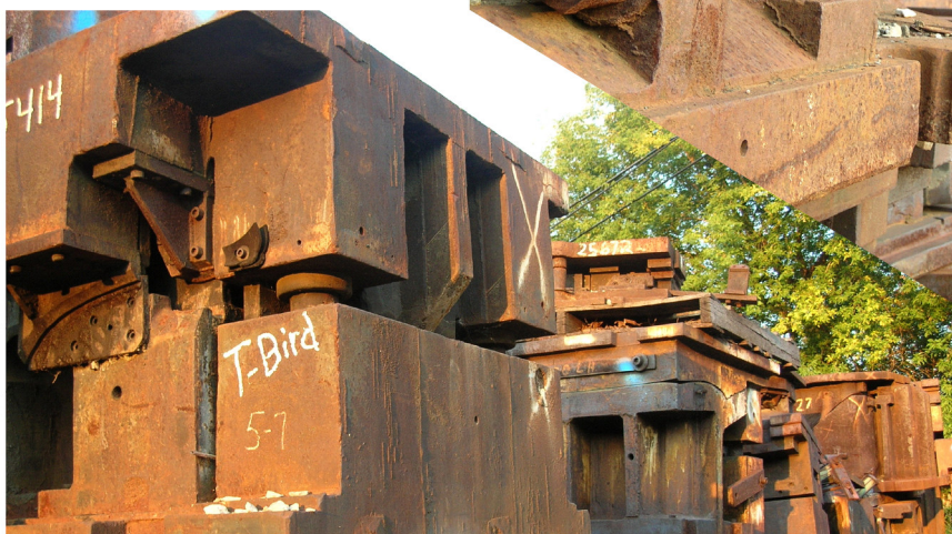
Det er dimensjoner på det som ligger her. I bildet til venstre kan man tydelig se hva dette hører til