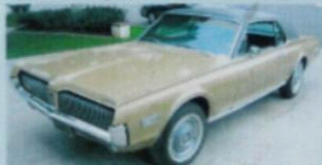
1968 Mercury Cougar kr. 129.000. 302 "J"-code (4 port), aut., PS, PB, med skiver. Gull metallic med originalt vinyttak. Sort pent interiør. Kun en eier.