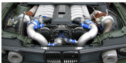
BMW med V12 var lenge med i kampen, men ble tilslutt slått av Erik Røssåsen.

Boys (Girls) 7.70 sekunder. Flere ganger kunne man se at raskeste bil bremsset ned før målplassering for å unngå å ryke ut. Ved flere anledninger fikk de heftigste og raskeste reisepass for å ha gått under minimumstiden. I Bracket kjørte man mot «egen» oppsatt idealtid. Det stilte 7 lokale deltagere, men havarier ødela dessverre dagen for noen av disse. Sylvia Andreassen fra klubben var raskeste jente, men ble tilslutt slått av Martin Sundli som gikk av med seieren i Bracket. Sue Torbergsen holdt frem til kvartfinalen, men