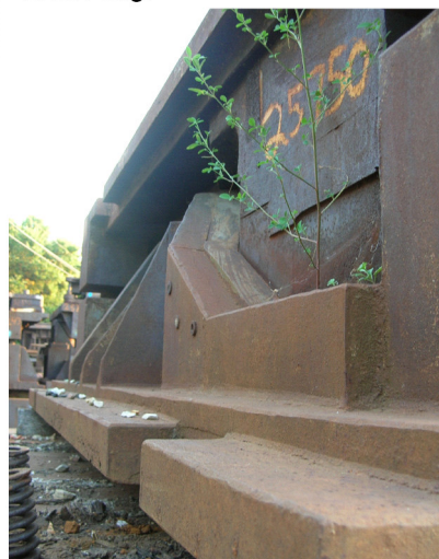
Verktøy i alle former, skulle gjerne hatt en runde på plassen og studert hva som virkelig fantes der.

10 eller 15 tonn hver! Det er vel unødig å si at vår tidligere flate parkeringsplass ikke lengre er så flat. Bildet av formen som ligger på siden er av A-siden av formen for forskjermen, hullet er der delen på hengeren passer inn i. Stokkene som verktøyene ligger på er 5"X5"