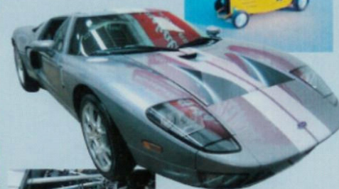
2006 Ford GT er nå levert! 550 hk - Powered by Ford. Vi kan skaffe flere!