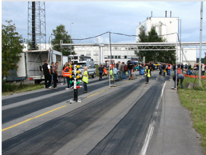
Det lå godt med gummi og «klister» på «plata» etter løpet