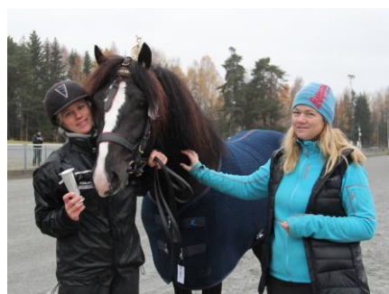
Bilder: Hage Lomen kvalitet I hingst. Voje Maren kvalitet I hoppe og dagens hest. Gikling Leodin TGN' mønstringspokal.