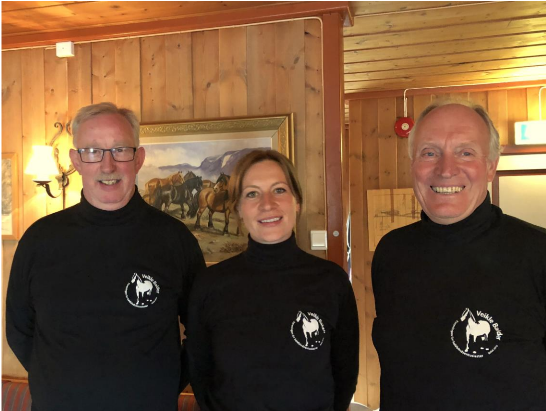
Synlig representasjon i Sikkilsdalen

«Statskonsulent-laget». Veikle Balder vil gratulere Norsk Hestesenter, Starum med et svært vellykket jubileum i Sikkilsdalen.