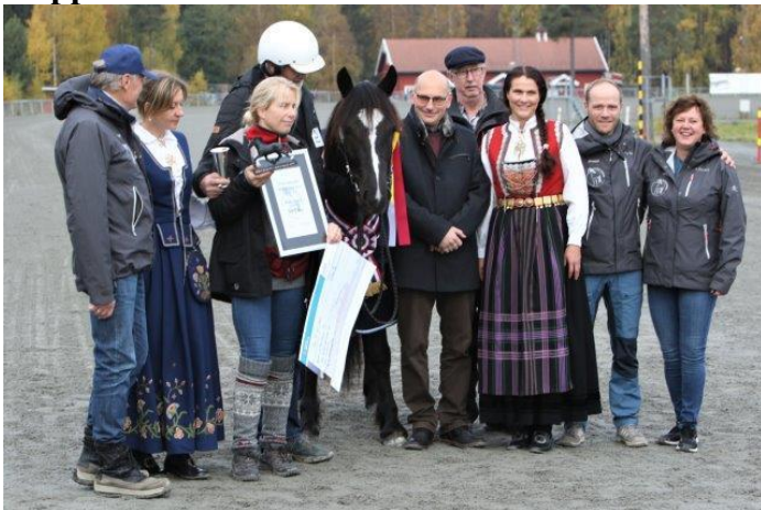
Premieutdeling Gull Odina

Kvalitet I: Gull Odina e. Moe Odin u. Alm Ingrid e. Järvsöfaks.