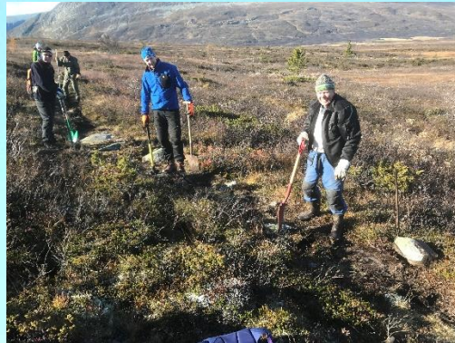
Dugnad høsten 2017