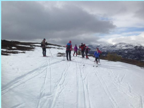
Skitur på lite snø, påsken 2017