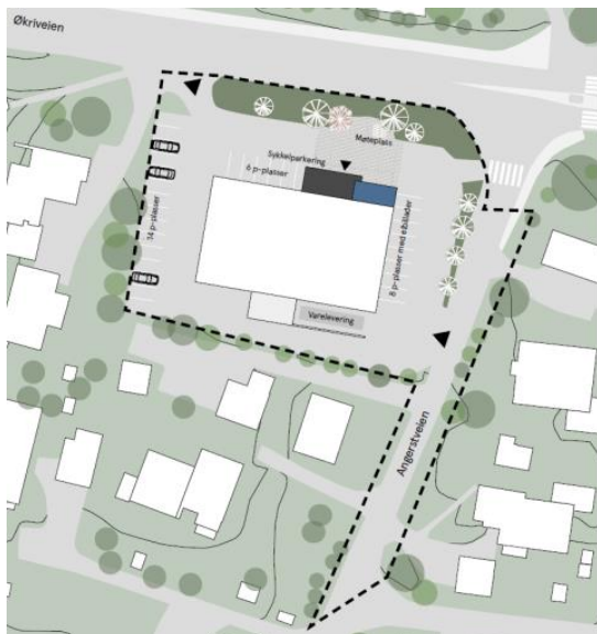
Skisse av LPO arkitekter

Planen, som vil bli fremmet med det første, vil omfatte området der bensinstasjonen ligger i dag. I tillegg vil den omfatte en fortausløsning fra Økriveien ned mot innkjøring til Olaf Bryns vei.