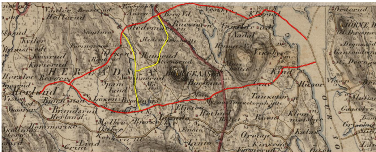
Vinterveier Herland 2. Kart fra 1854

Tilbake til Hedemarken. I krysset der tar det av en vei sørover. Midt på Skinnerudtjernet går det av en vei til venstre til Stensrud og Hedemarkenhytta. Den andre veien følger vassdraget oppover og munner ut i den andre veien midt på Lundebyvannet.