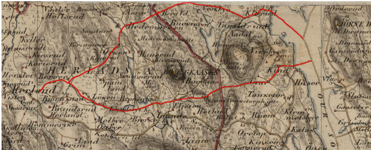
Vinterveier Herland. Kart 1854

østover, passerte grensen til Rødnes der den passerer Berg, Vestby og Klerud, før den kom ut på Rødnessjøen.