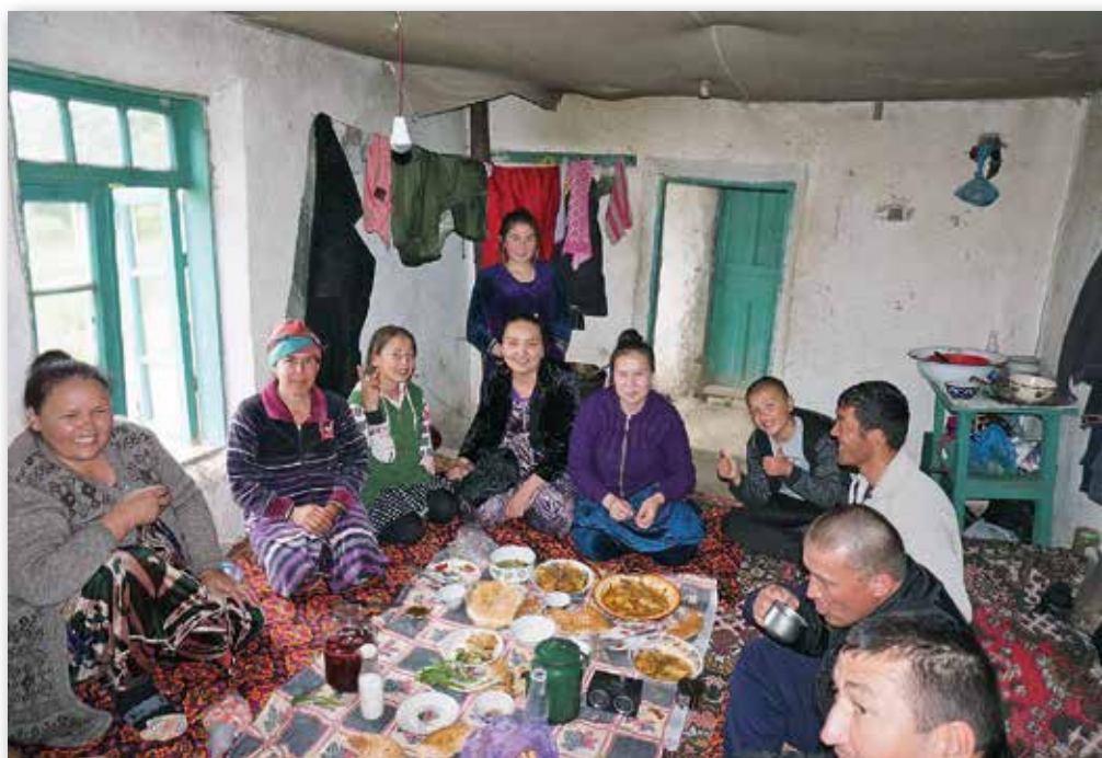
Invitert på lunsj med sang og dans, Navoiy i Usbekistan.

Å komme inn i Azerbaijan gikk greit. Landet er nokså flatt,