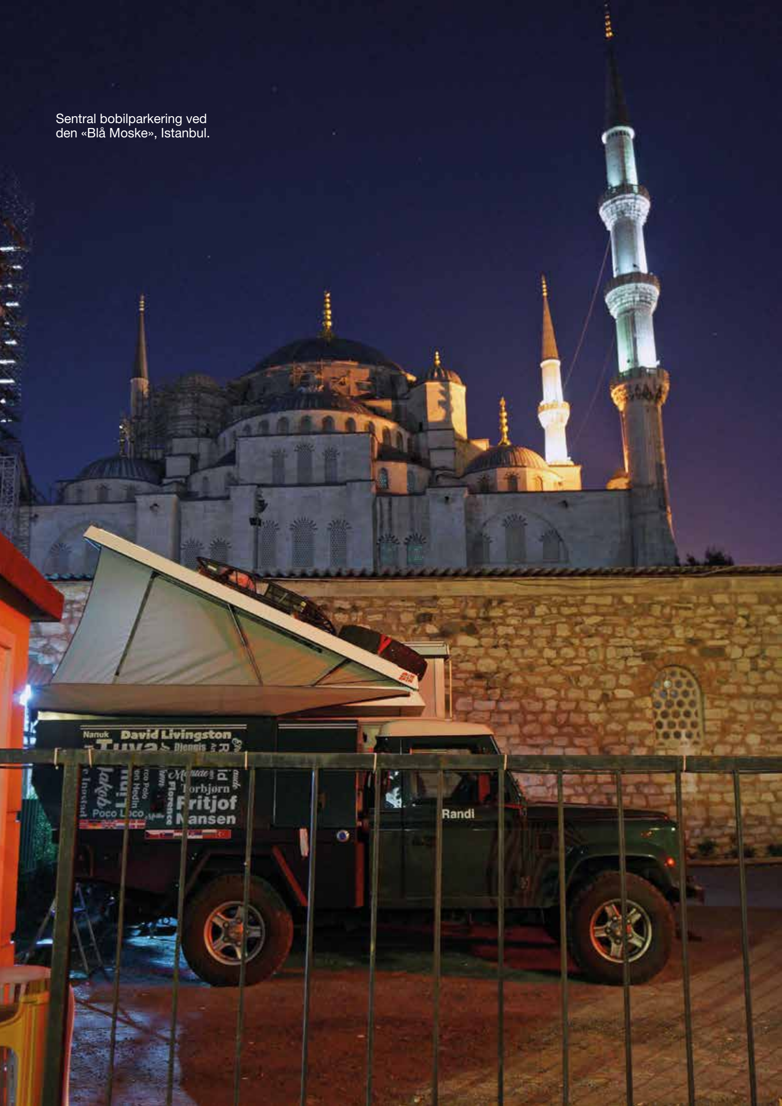
Sentral bobilparkering ved den «Blå Moske», Istanbul.