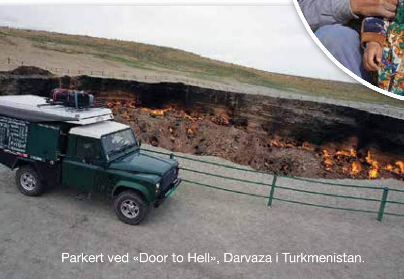
Parkert ved «Door to Hell», Darvaza i Turkmenistan.