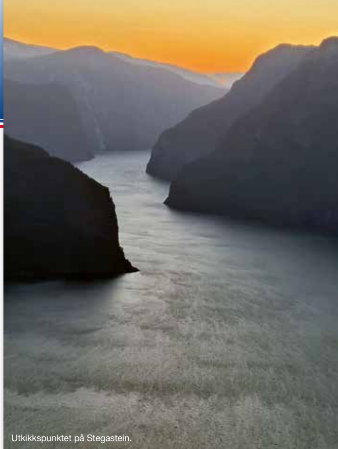
Utkikkspunktet på Stegastein.

Geiranger et typisk overfylt turiststed, så til de grader.