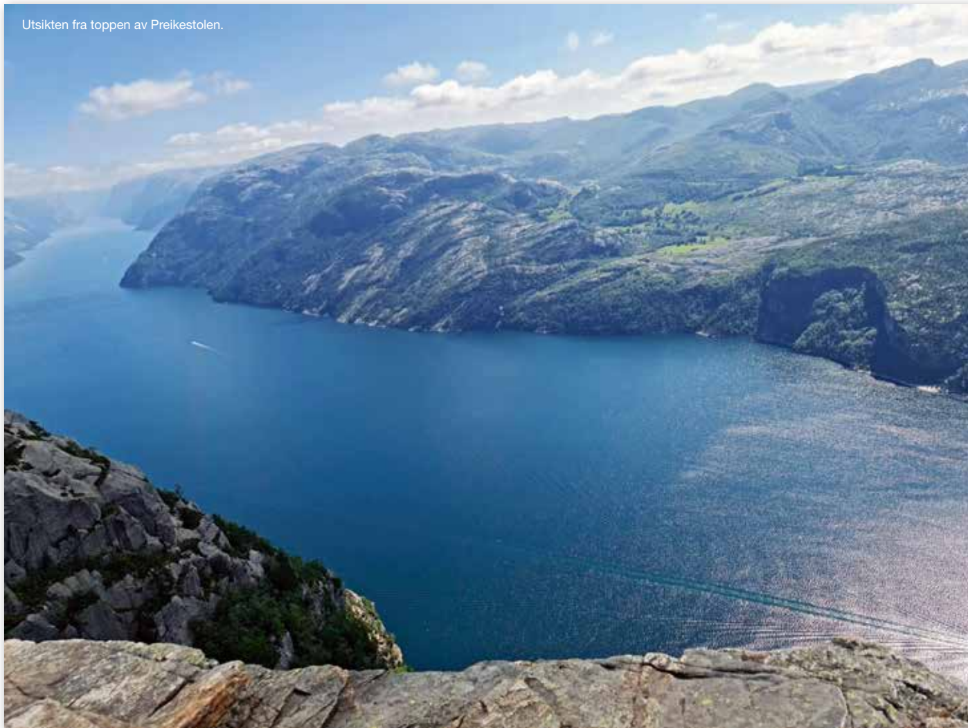
Utsikten fra toppen av Preikestolen.

Videre gikk turen strake veien rett til Jørpeland for litt matshopping og Pizzabakeren før vi innlosjerte oss på Preikestolen Camping like før resepsjonen tok natten. Her ble vi nok litt overrasket over hvor lite folk som var - god plass var det i hvert fall.