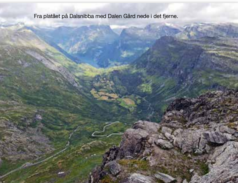
Fra platået på Dalsnibba med Dalen Gård nede i det fjerne.