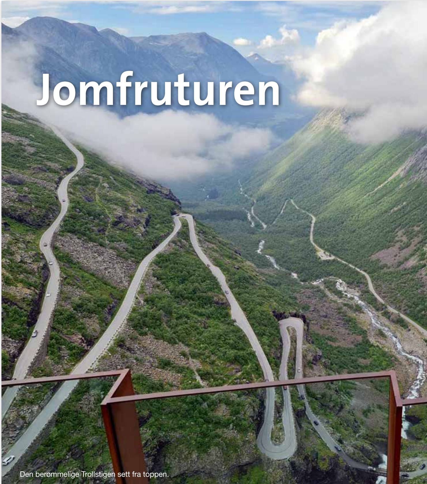
Den berømmelige Trollstigen sett fra toppen.