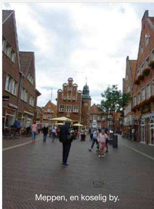
Meppen, en koselig by.

da vi kom dit. Da vi hadde planer om å stå her noen dager, fikk vi et stort og fint område nesten for oss selv inne på campingplassen, like ved servicebygget.