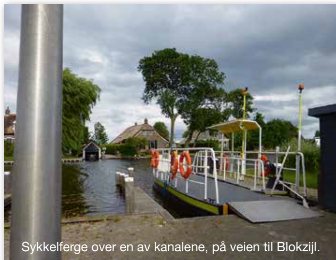
Sykkelferge over en av kanalene, på veien til Blokzijl.