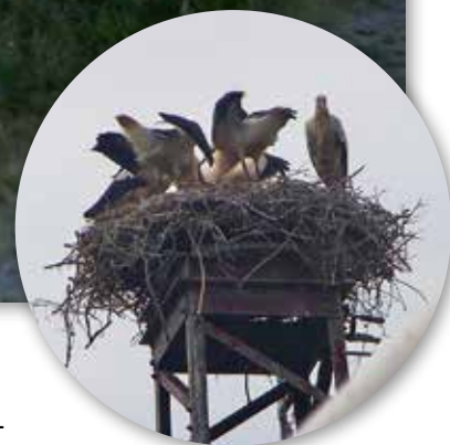
Storker ved stellplatz an der Mühle, ved Leer.

været er bra, kan en ta båt over til øya Marken og den sjarmende landsbyen på øya.