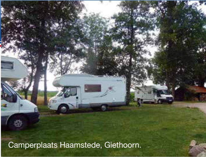
Camperplaats Haamstede, Giethoorn.