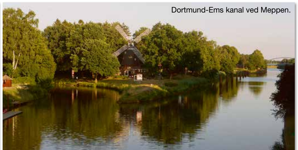
Dortmund-Ems kanal ved Meppen.