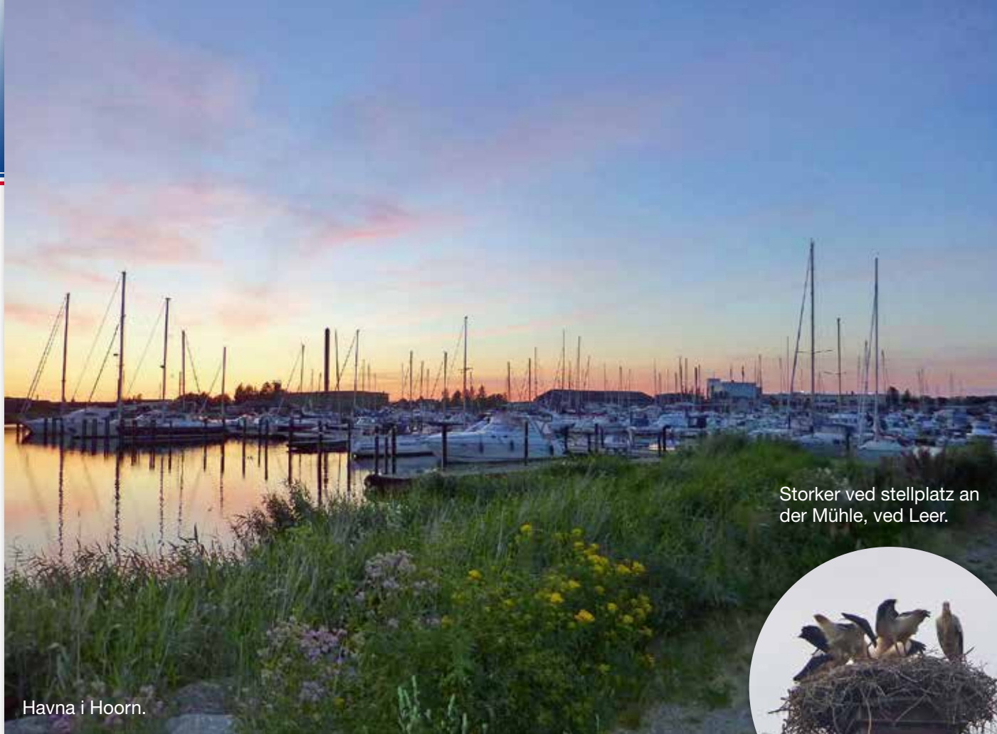
Havna i Hoorn.