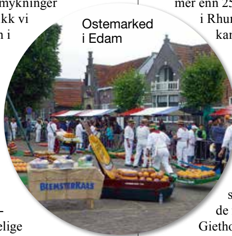
Ostemarked i Edam

Etter noen fine dager i Bremen var det å kjøre noen mil, noe på autobahn, men mest på bundesstrasse. Å kjøre disse mindre veiene tar mye lengre tid enn å kjøre autobahn, fordi bundesstrasse ofte går gjennom små hyggelige byer. Det at vi kjørte mest på mindre veier, er at jeg har mer en 40 år bak et lastebilratt rundt om i Europa, og blir temmelig lei av jaget og "stau" på autobahn. For Tyskland er jo så mye mer enn Autobahn og Jägersnitzel. Da vi hadde valgt ut Meppen som neste stopp, er det ikke mulig å kjøre så mye på Autobahn.