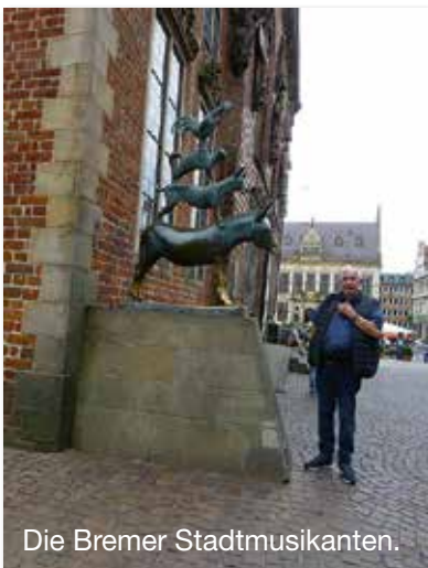
Die Bremer Stadtmusikanten.

Da Meppen bare var en overnattingsplass på veien, var det tidlig avgang neste morgen for å kjøre videre til Giethoorn i Nederland og Camperplaats Haamstede, Kanaaldijk 17, Giethoorn. GPS N52.7286 E6.0725. Denne plassen er omtrent 10 min. gange inn til kanalbåtutleie, turistinfo. og foretninger. Her kan en leie en elektrisk kanalbåt og kjøre selv, og det er også mulighet for å ta en sightseeingbåt. Det å ta en båtutur på kanalene og se de flotte plantene og blomstene, er det som gjør Giethoorn så fin. Så en times båtutur bør en få med seg. Det er også fint å gå langs kanalene. Kanalene er vel det som gjør Giethoorn til Nederlands Venezia, eller kanskje Spreewald. Noen i følget hadde også en fin sykkelutur langs naturreservatet til den lille byen Blokzijl. Her går sykkelveien forbi små bondegårder og campingplasser, og til Jonen og den spesielle sykkelfergen over en av de mange kanalene.