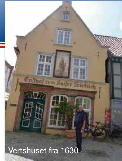
Vertshuset fra 1630

fotograferte statuen i byen. Det er bronsestatuen av Die Bremer Stadtmusikanten. Denne statuen med eselet, hunden, katten og hanen er etter ett av de kjente eventyrene til brødrene Grimm. Da vi hadde bestemt oss for å spise lunch i bydelen Schnoor-vertel, gikk vi gjennom den kjente Böttcherstrasse med det gullforgylte relieffet i Art-Deco stil. Her er det også flere historiske bygninger med fine utsmykninger mellom gavlene. Framme i Schnoor gikk vi gjennom Bremens smaleste gate og inn i denne sjarmerende bydelen som vel er Bremens best bevarte gamleby. Her er det små foretninger og kroer. Lunchen inntok vi i Gasthof zum kaiser Friedrich, et vertshus fra 1630.