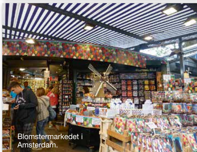
Blomstermarkedet i Amsterdam.