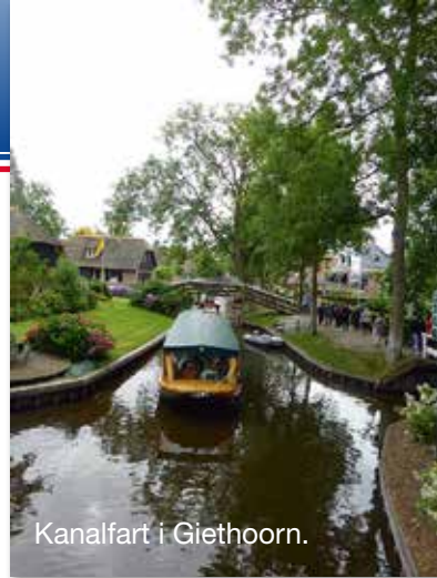
Kanalfart i Giethoorn.