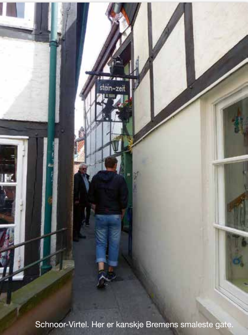
Schnoor-Virtel. Her er kanskje Bremens smaleste gate.

Bare en kort sykkeltur fra Volendam ligger ostebyen Edam. Som navnet sier, kommer den kjente Edamer herfra. Ostemarkedet her har røtter helt tilbake til 1500-tallet, men på grunn av økonomiske nedgangstider, opphørte markedet i 1922, etter mer en 300 år. Men i 1989 ble markedet gjenopplivet for turister hver onsdag formiddag om sommeren. Kjøper en dagsbillett på bussen og tar denne fra Volendam, kan en besøke ostemarkedet om formiddagen og ta bussen videre til Hoorn, og bruke ettermiddagen her. Hoorn ligger ved IJsselmeer og er en god del større enn Volendam og Edam. Her er det et fint havneområde med noen gamle spesielle bygninger. I gågata er det mange små forretninger og kafèer. Fra Volendam, hvis