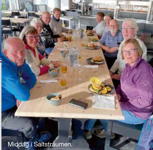
Middag i Saltstraumen.