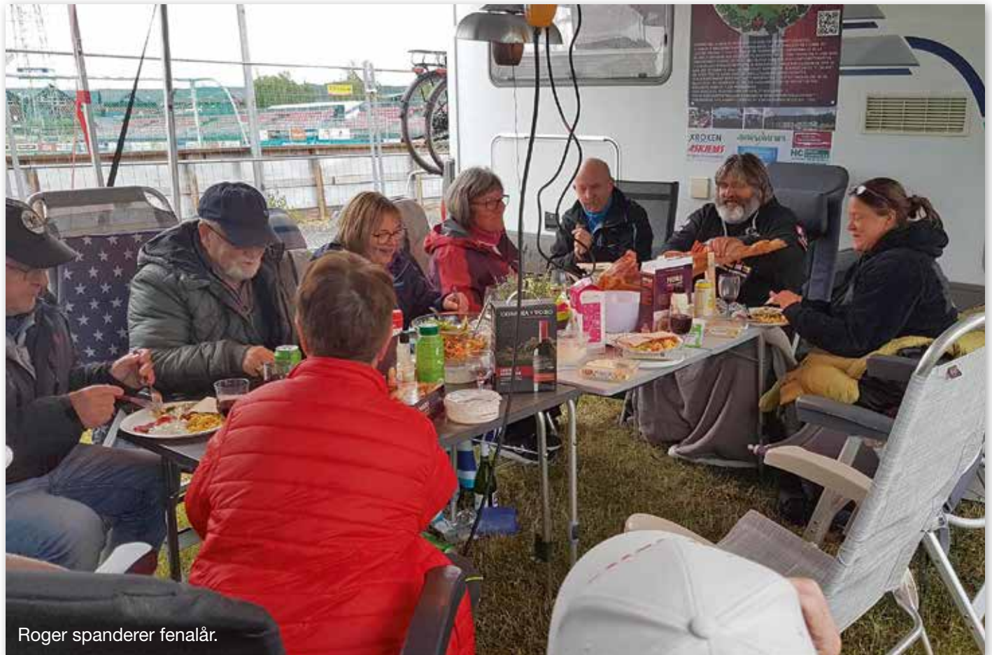
Roger spanderer fenalår.