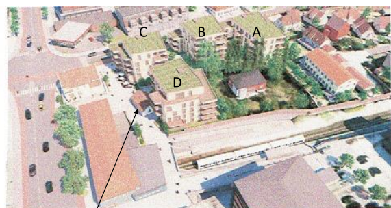
Det eldste huset i sentrum er flyttet og satt på bakkeplan tett inntil blokk D