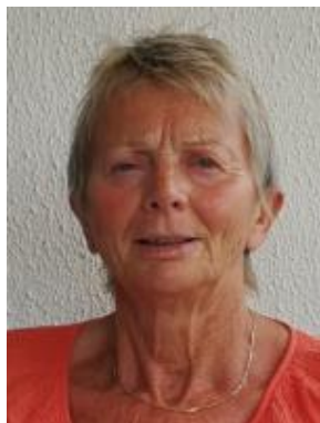
Frøydys Sjølyst Medlem