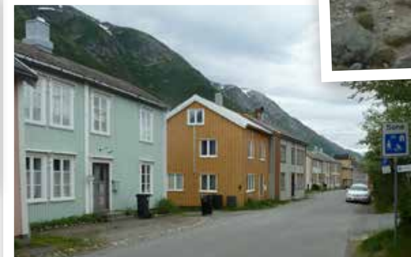
1. Batteri Dietl på Engeløya. 2. Frihet/Minnesmerke fra krigen. 3. Sjøgata i Mosjøen. 4. Viewpoint Snøhetta. 5. Stellplassen på Engeløya, utsikt mot Lofotveggen.

Blå byen som Sortland blir kalt, satte vi kursen mot Raftsundet og Raften bobilparkering og camping. Vi hadde håpet på å se Hurtigruta passere gjennom sundet, men den så vi ikke. Det lønner seg å sette seg inn i rutetidene, men vi så flere andre skip. Fra Raftsundet satte vi kursen mot Narvik, men det ble først en overnatting på Tjeldsundbrua camping. Plassen her ligger fint til ned mot sjøen.