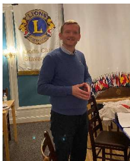
Soneleiar i sone 10, Jarl Sie

Distriktsmøtepapira blir sendt ut rundt 20.mars.