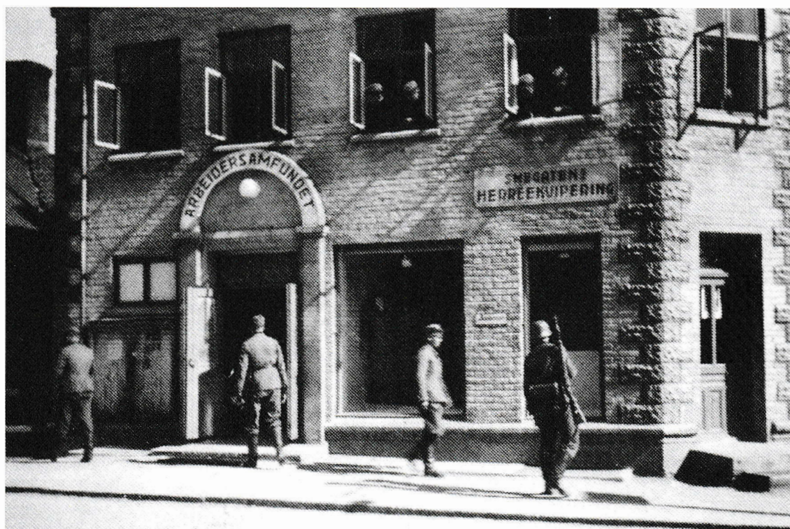
Arbeidersamfundet var til sine tider rekvirert av tyskerne under okkupasjonen, med bl.a. kinosalen til bruk for egne forestillinger. Tekst og bilde fra Mysen-leksikon av Hans Wåler.

Men fra tid til annen kunne Mysens befolkning bruke salen til egne tilstelninger, men ikke til revyer, som kunne skape forargelse for okkupasjonsmakten. Revyer og tilstelninger ble det likevel. Jeg fant en gang ved en tilfældighet