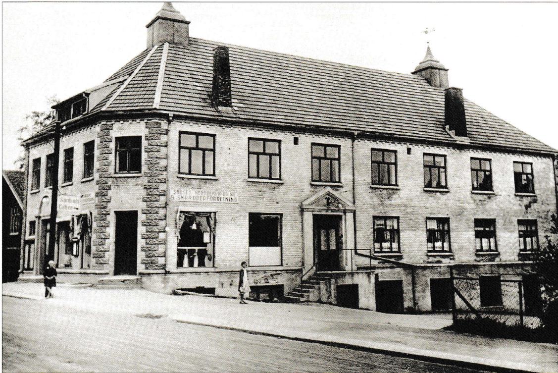
Arbeidersamfundet i Smedgata, en gang Mysens kulturelle høyborg i 40 år, sto ferdig bygget i 1922.

«Folkets hus», eller «Håkonshallen» som vi også kalte bygget. Men etter en strid innad i arbeiderbevegelsen ble denne splittet i 1921, og den moderate delen av bevegelsen, Eidsberg Socialdemokratiske Arbeiderforening bygget sitt nye bygg i Smedgata i krysset mellom Smedgata og Anton H. Granlis gate. Bygget fikk navnet «Arbeidersamfundet» og sto ferdig i 1922 med en grunnflate på 266 kvm., så dette ble et ruvende bygg etter datidens standard. Nybygget ble bygget i to etasjer pluss kjeller.