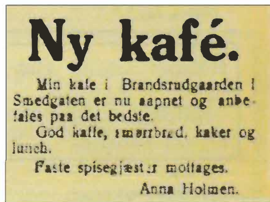
Brandsrud Kafé ble åpnet i mars 1920. Annonse i Indre Smaalenenes Avis 29. mars 1920.

Da starter vi ved Brandsrudgårdene, de to fine murgårdene som ligger på hver sin side av Mørstadbakken. I det østre bygget var det et hospits med en spisesal i første etasje mot Smedgata. Denne ble også brukt som kafé i det daglige. Det var den gangen en trapp fra Smedgata og inn til spisesalen og det var store vinduer ut mot gata. I dag er både inngang og vinduer erstattet med vanlige vinduet slik at sporene etter