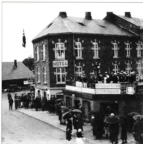
Norrøna kafé hadde utesevering på nabobygget.

fra fusel (hjemmebrent som ikke var kokt ferdig), hjemmebrent og andre typer sprit. Noen kjøpte rødsprit og pottaske som de hadde på ei flaske. Så var det å riste dette til vesken ble klar og ferdig til å drikkes, men det smakte nok ikke godt, virket det som. Noen smurte også skokrem på brodskiva med en sardin på. Det var visst litt alkohol i skokremen. Disse samlingene opphørte mer eller mindre når bussene flyttet hit fra Krosby-tomta og Linjegods overtok mye av plassen. Da ble det nok for mye folk der.