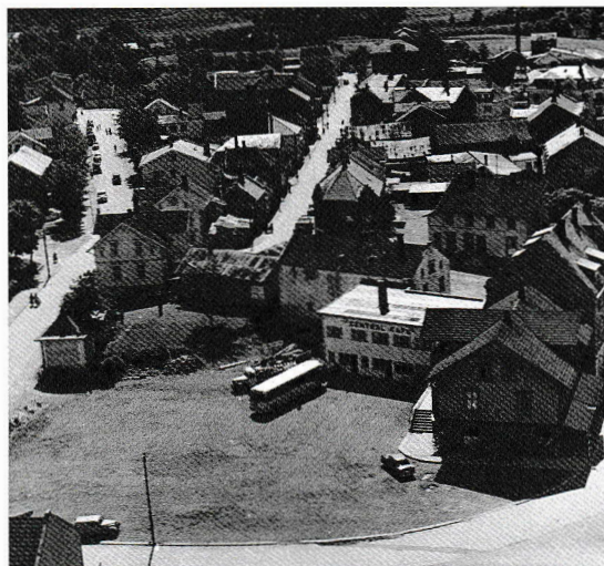
Krosby-tomta hvor Østfold Bilruiter hadde sin virksomhet fra 1948. I det hvite bygget bak bussen lå Central Kafé.