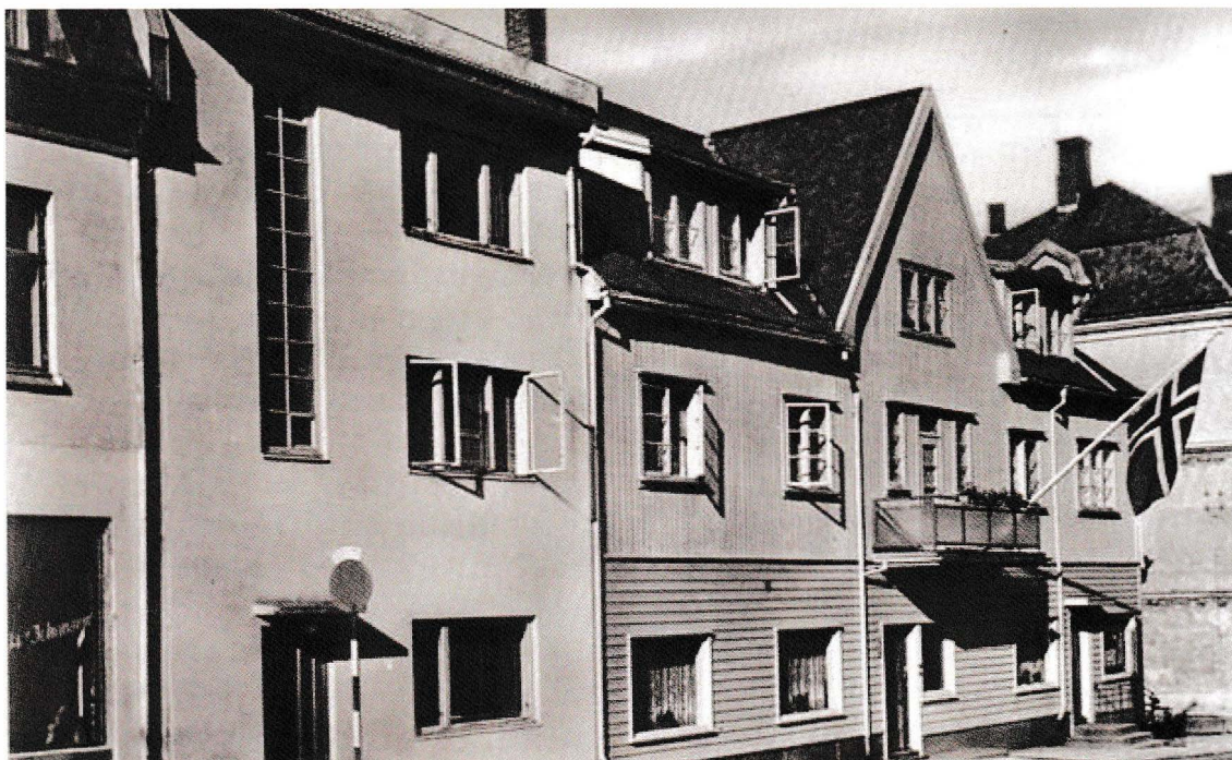
Grand hotell i Storgata, ligger mellom Johansens kjøttforretning i venstre kant, og Ravnsborg til høyre.