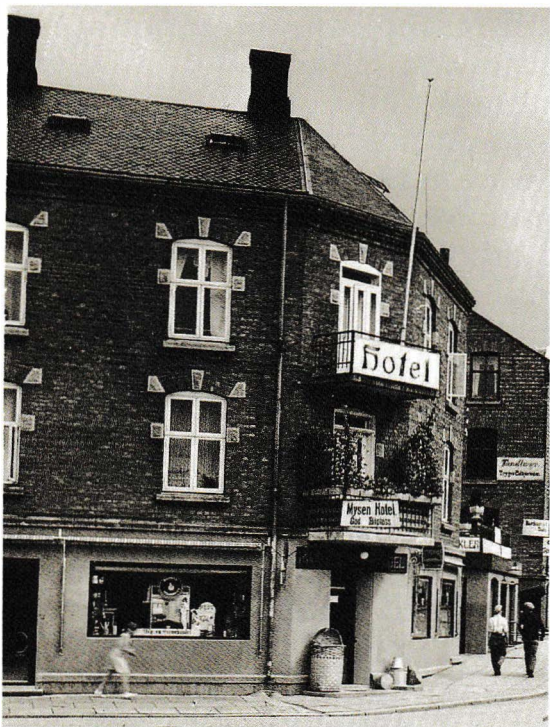
Bygården Solhøi i Jernbanegata fra 1907–08 inneholdt for lenge siden Norrøna kafé, og her var det også hotell.

Så var det på tide å vandre videre, og på lørdagene var faktisk første stopp-plassen utenfor pakkhuset. Der på rampa satt det som regel mange av de garva gutta som hadde treff. Da gikk det i mange varianter av rusmidler, alt