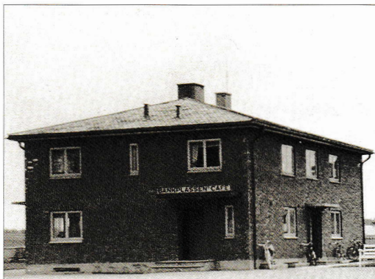
Bankplassen Cafè ved siden av Eidsberg sparebanks filial på Heggin. På 1980-tallet lokaler for Heggin barnehage.

Denne kaféen er også lagt ned for mange år siden, men på 1980-tallet ble Heggin barnehage etablert i bygget. I dag er huset en del av Eidsberg ungdomsskole.