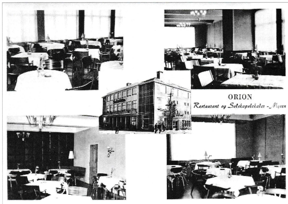
Orion restaurant- og selskapslokaler i 2. og 3. etasje i Festiviteten.