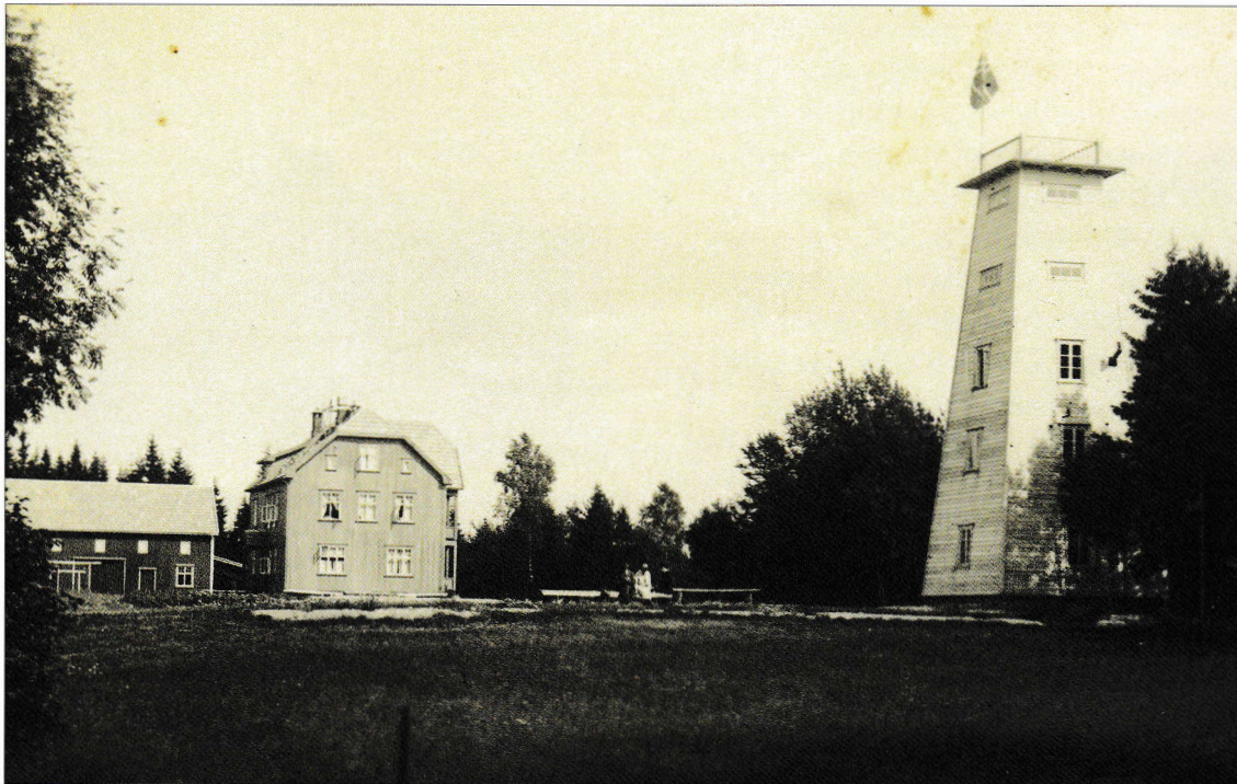
Mona Hotell med utsiktstårnet hvor man kunne se helt til Sarpsborg!

I tillegg til hotellet var det også et stort utkikkstårn der oppe på Monaryggen, med god utsikt helt til Sarpsborg i syd, så både hotelldriften