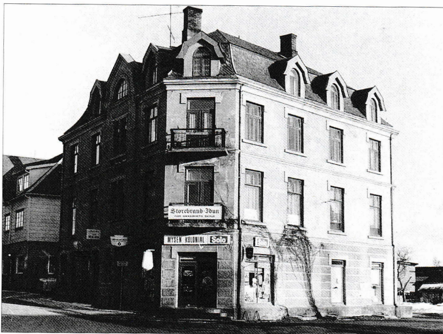
Ærverdige, og eneste jugendstil-bygget i Mysen, Ravensborg, har inneholdt mange geskjefter i sin levetid, deriblant Solstad kafé (tidligere Promenadekaféen). Dessverre ble denne perlen jevnet med jorden i 1979, da Eidsberg sparebank skulle oppføre sitt nybygg.

I første etasje i dette bygget var det en kolonialbutikk, en kiosk og urmakerbutikken til brødrene Moen. Solstad kafé lå i andre etasje. I tillegg til kaféen var det også en liten balkong ut mot gata hvor det til nød var plass til