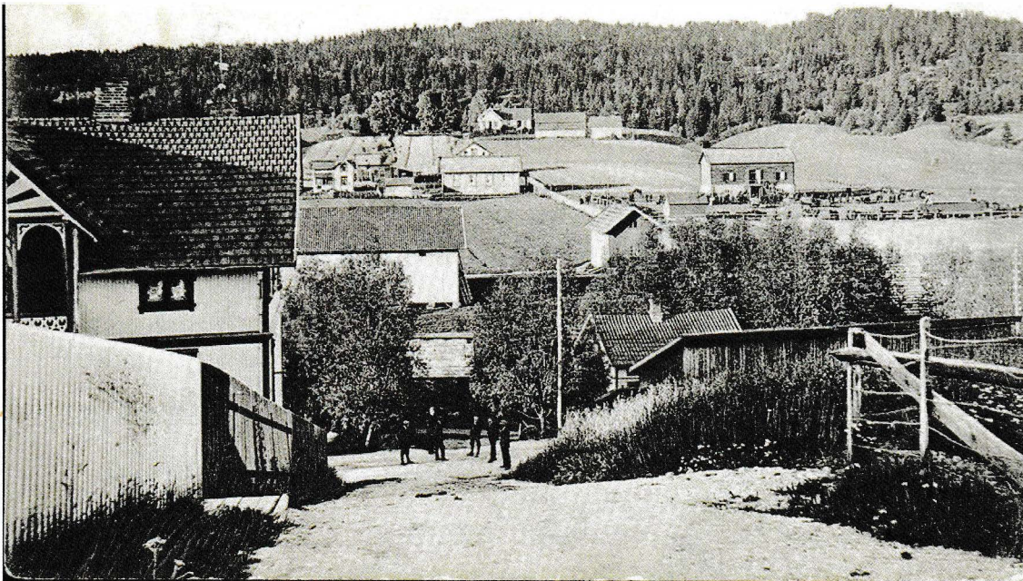
Korterudbakken er fortsatt en snarvei opp i sentrum fra Smedgata. Postkort: Jul Aage Krosby.

Når vi gutta gikk opp Korterudbakken fra Smedgata, gikk vi forbi denne hesterekka. Jeg husker enda lukten av svette hester og gomlingen av høy som