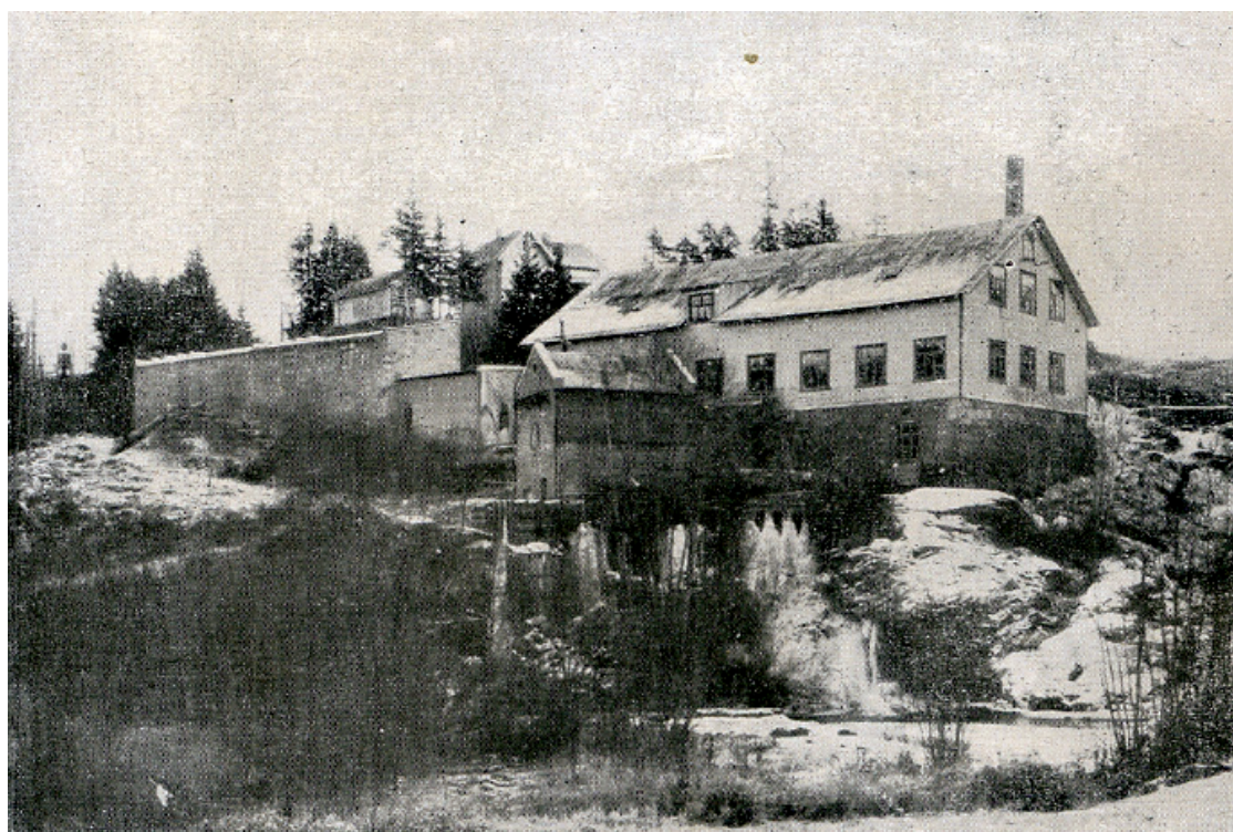
Fabrikken sett nede fra Spinneridalen.