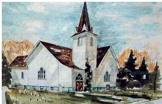
Bethany lutherske kirke.