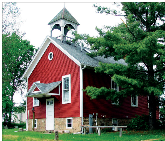
Skolen i Sunrise.

Gradvis blir de små Thorpe-guttene store nok til å hjelpe til skikkelig,