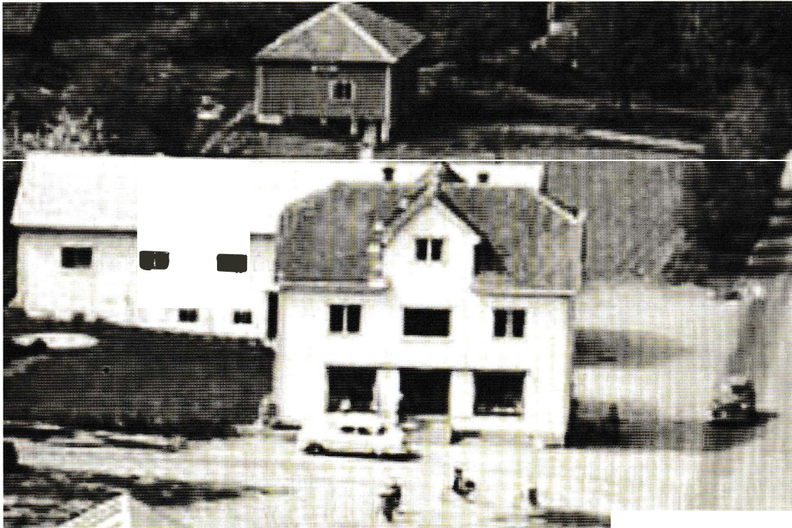
O.H. Gløruds Eftf. i Glørudkrysset i Trømborg

Forretningen var altså opprinnelig kombinert meieri og landhandel. Etter hvert ble det trangt om plassen og ny butikkbygning ble reist nær veikrysset.