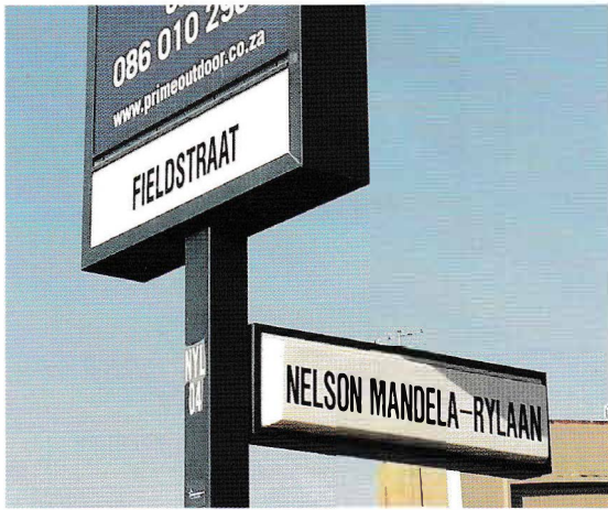
Fieldstraat i Modimolle (tidl. Nylstroom). Navnet på gata er formelt endret, men gateskiltene står der fortsatt (2018).

da jernbanen kom i 1898. Ludvig ble med tiden en aktet og avholdt mann i Nylstroom ettersom han satt som medlem av byrådet (dorpsraad) i 20 år og var byens borgermester (burgemeester) i fire år.